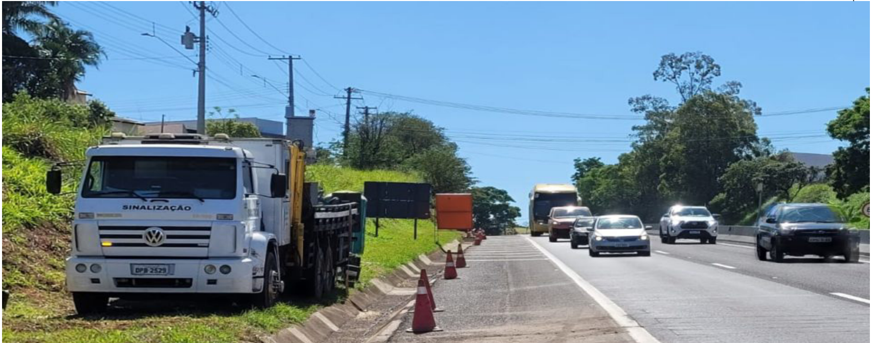
Um dos pontos de operação dos novos radares na SP-294 em Marília, no km 450 (pista leste)