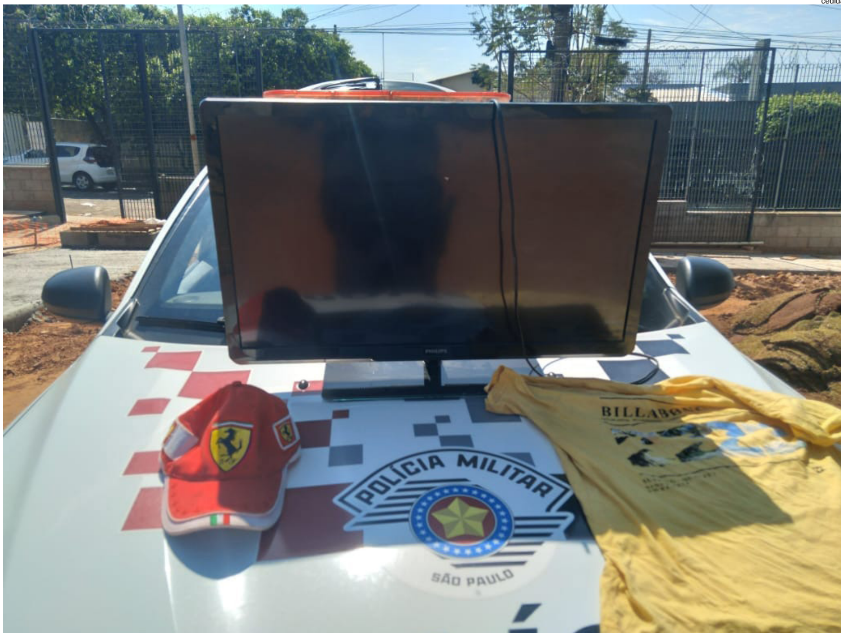
Aparelho de TV furtado e recuperado pela PM