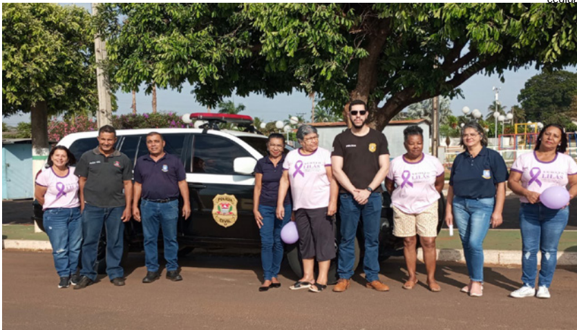
Carreata da Campanha de prevenção da violência contra a mulher em Ouro Verde