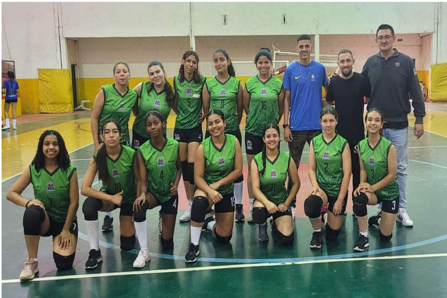
Equipes de base de vôlei de Dracena se destacam nas competições