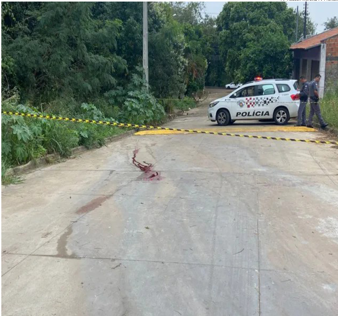
Local do crime ocorrido domingo em Álvares Machado