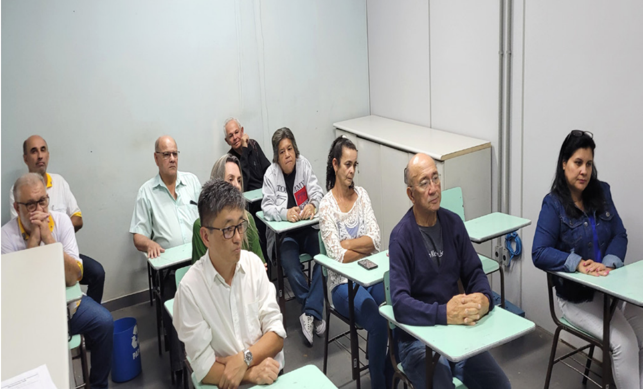
Reunião do Conseg de Dracena