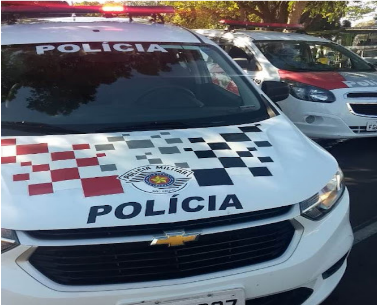
Homem era procurado da Justiça pelo crime de roubo