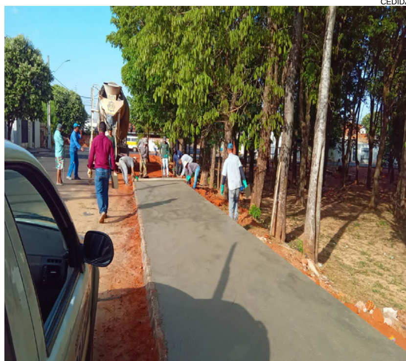
Obras de calçamento do Parque do Bosque, no Jardim Brasilândia