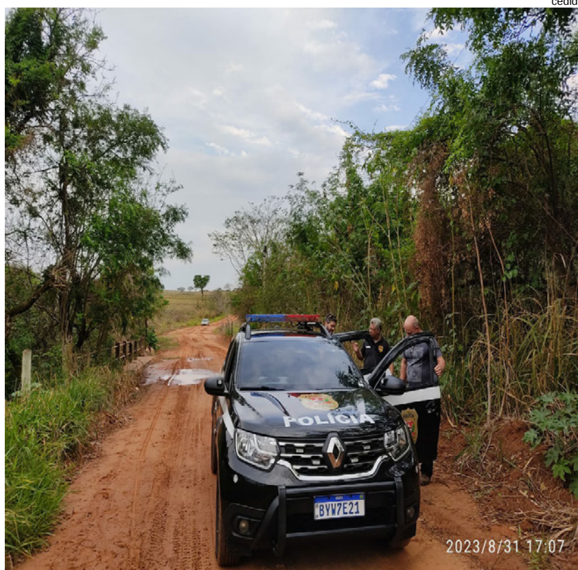
Diligência à procura de drogas em área de mata