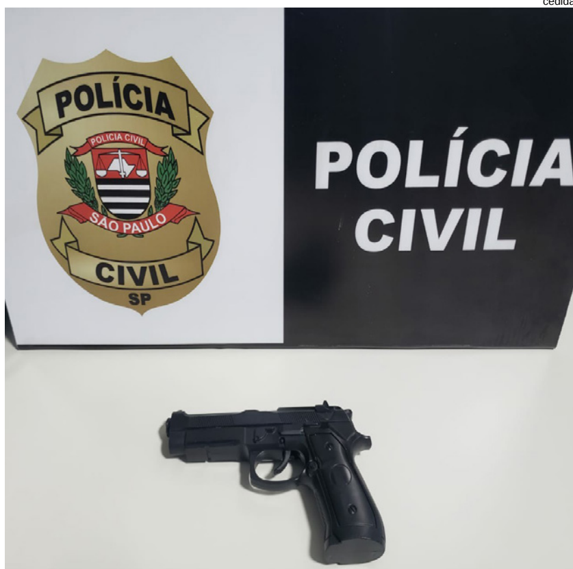
Simulacro de arma apreendida