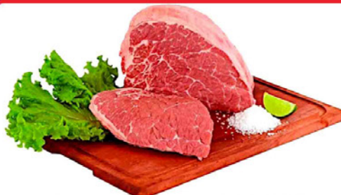
CUPIM BOVINO FRIGO ESTRELA KG