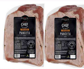
PANCETA SUÍNA CHEF TEMPERADO KG