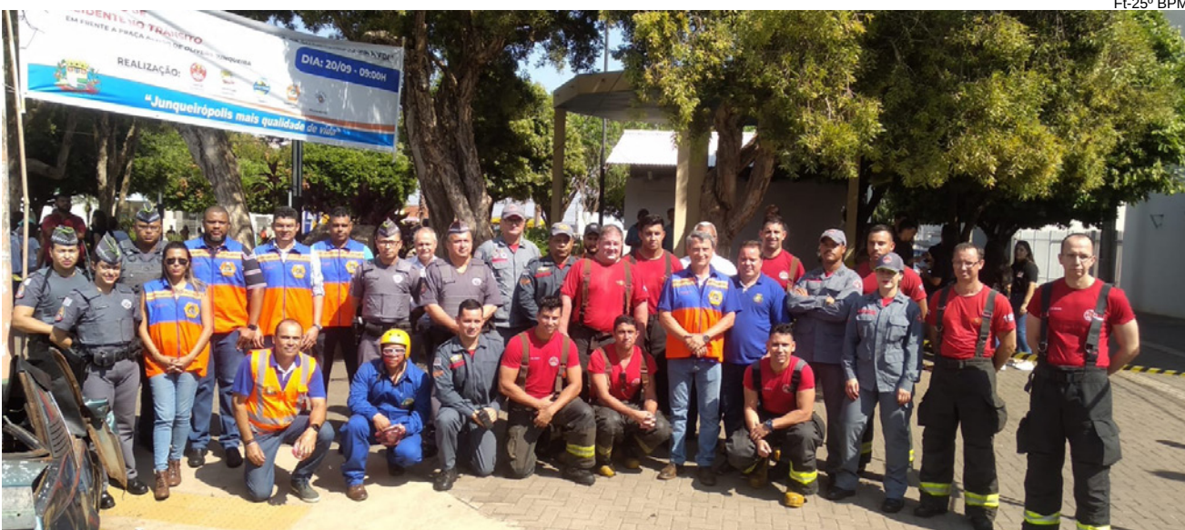
Ação teve participação de órgãos de segurança, Prefeitura e alunos da Fundec