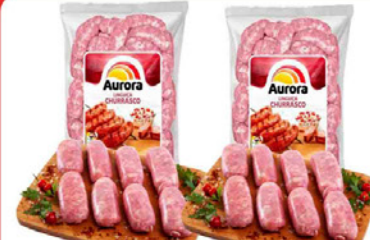
LINGUIÇA AURORA CHURRASCÃO À GRANEL KG