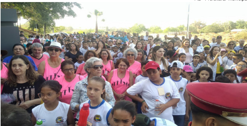
Centenas de moradores compareceram