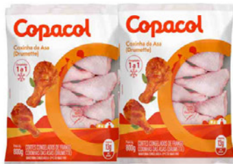
COXINHA DA ASA FRANGO COPACOL 800 GR PACOTE