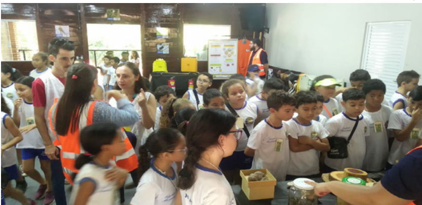
Centro de Estudos Educacional da Flora e Fauna Brasileira