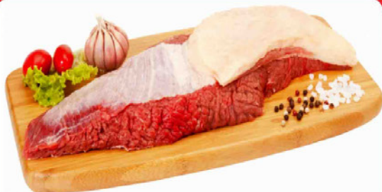
FRALDINHA DE BOI KG