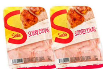
SOBRECOXA FRANGO SADIA 1KG BANDEJA