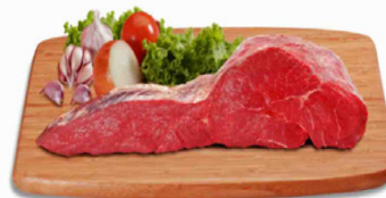
ALCATRA COM MAMINHA KG