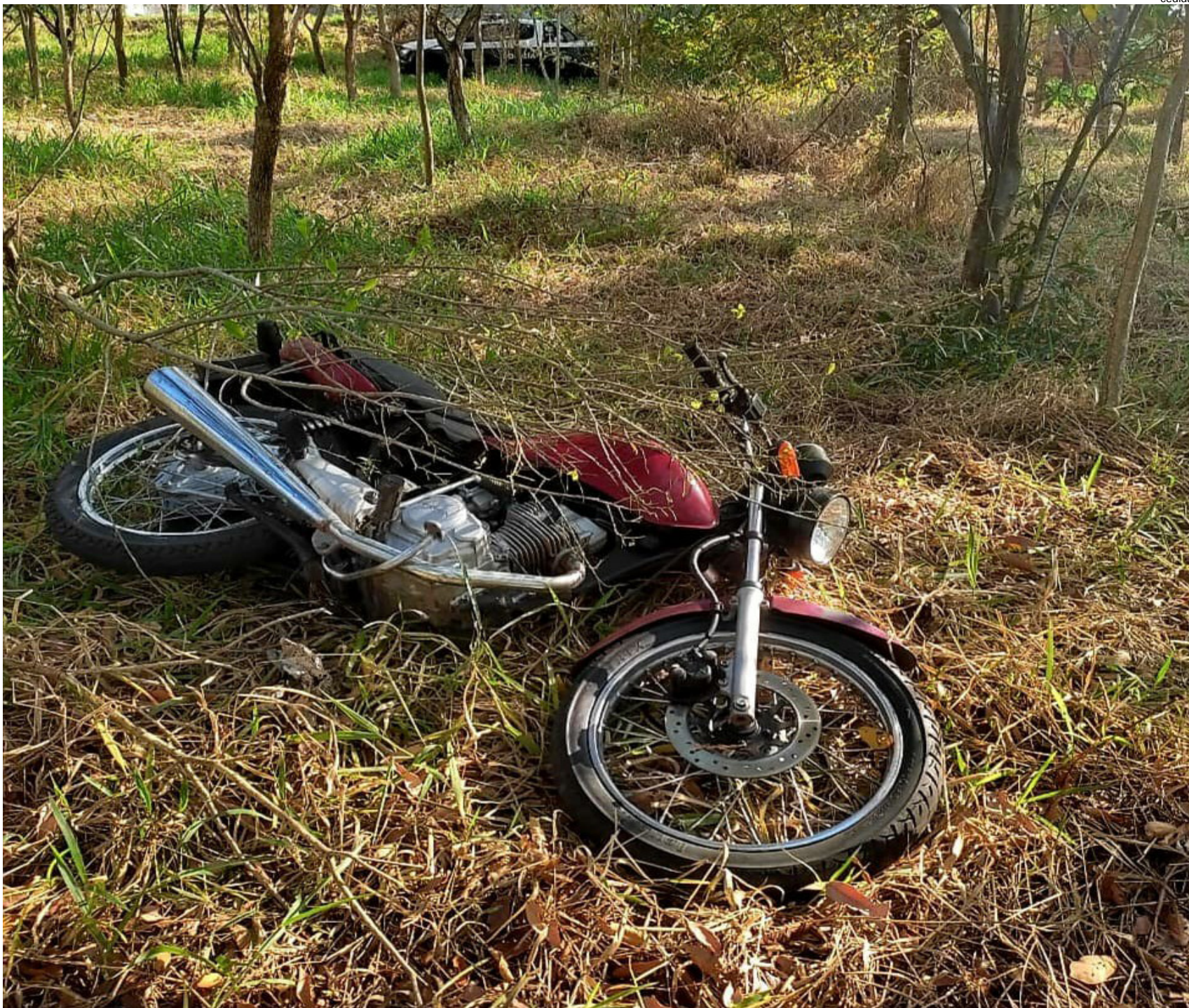
Moto localizada em área verde do Residencial Pitangueira II