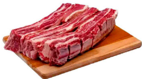
COSTELA DE BOI RIPA GAÚCHO KG