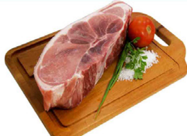
PALETA SUÍNA COM OSSO KG