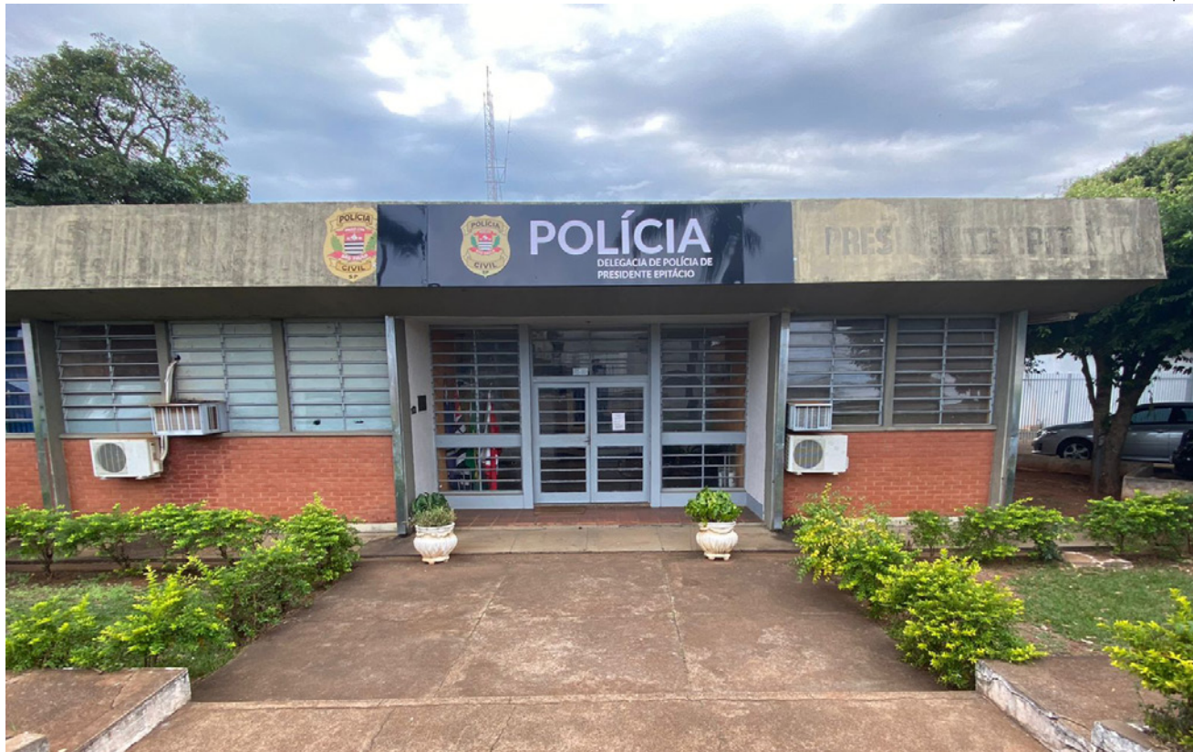
Polícia Civil de Presidente Epitácio identifica acusado do roubo do cordão e pingente de ouro