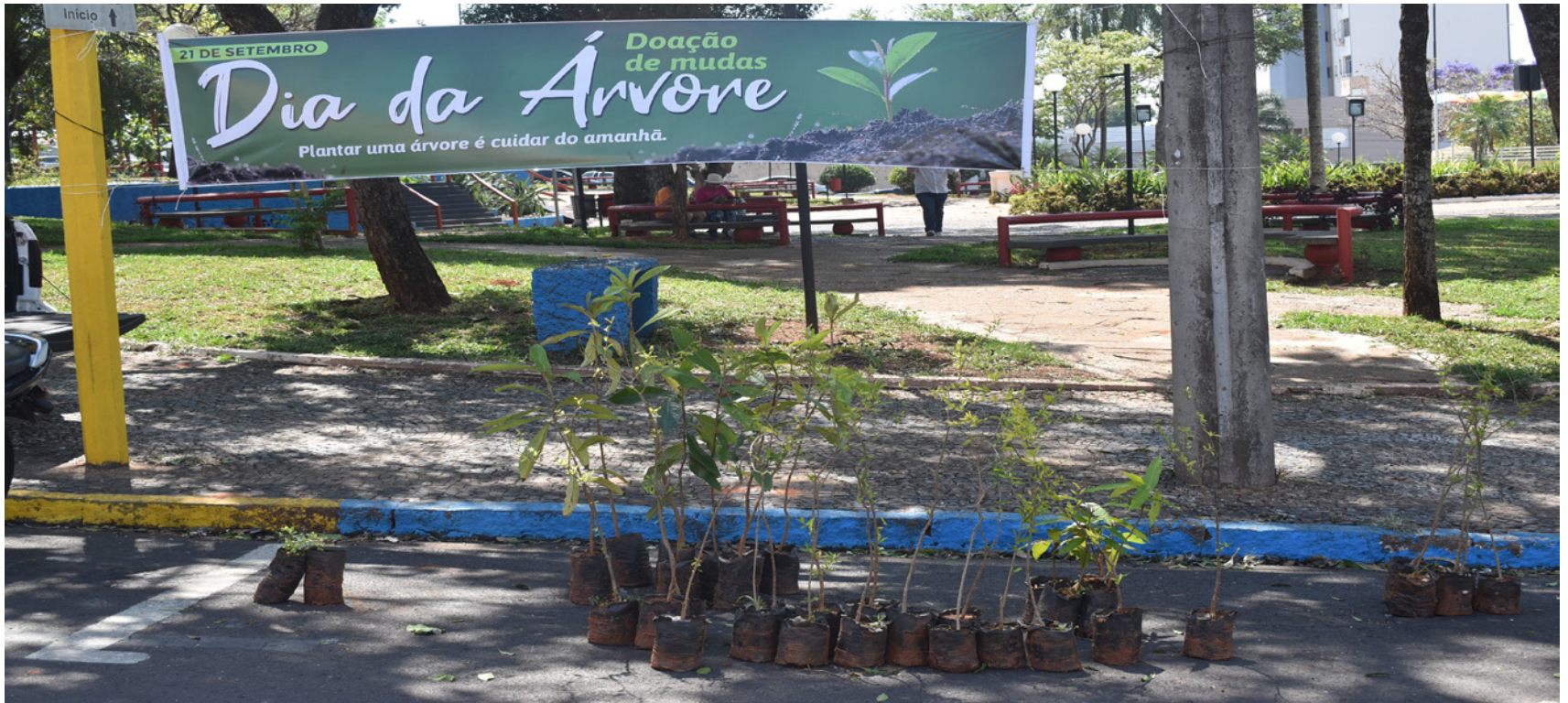
Doação das mudas ocorreu na praça Elio Micheloni, centro, nesta quinta-feira