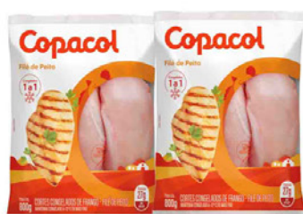
FILÉ DE PEITO FRANGO COPACOL EM BIFES 800 GR PACOTE