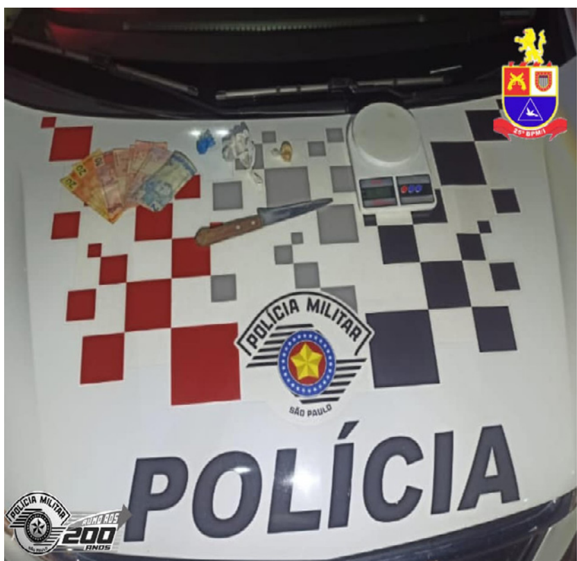
cedida Crack e maconha foram apreendidos e homem foi preso