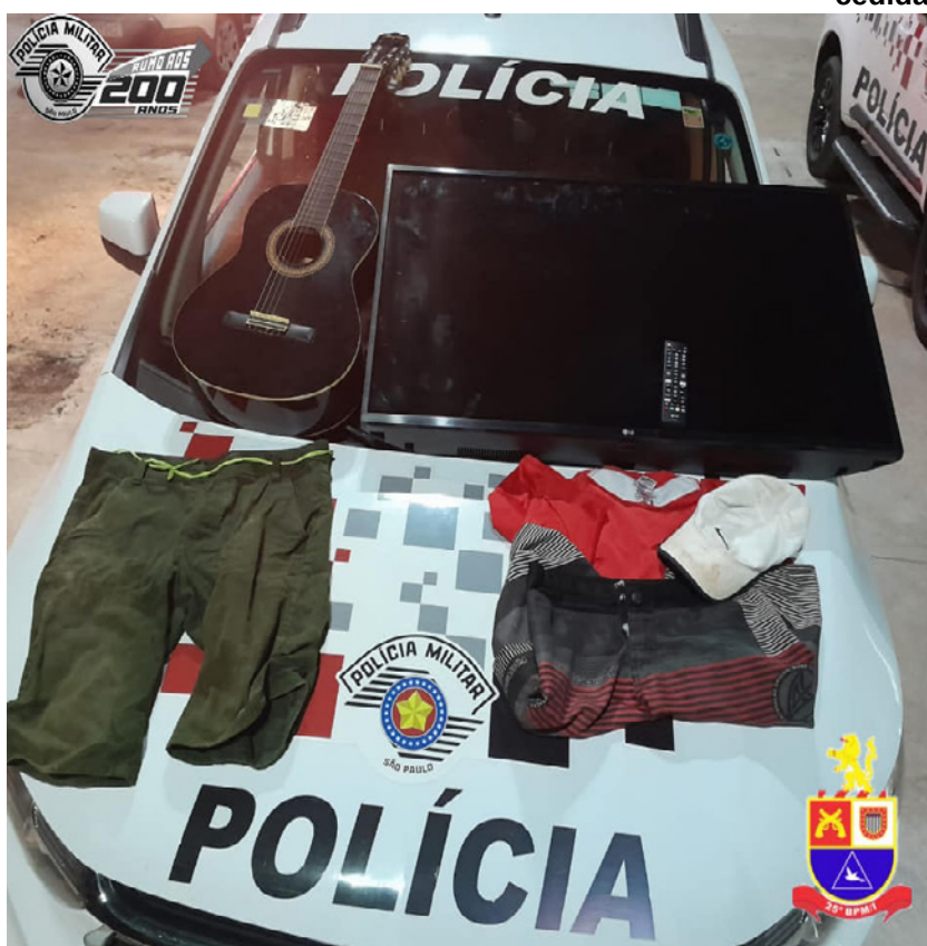
cedida Televisor e um violão furtados da escola estadual recuperados