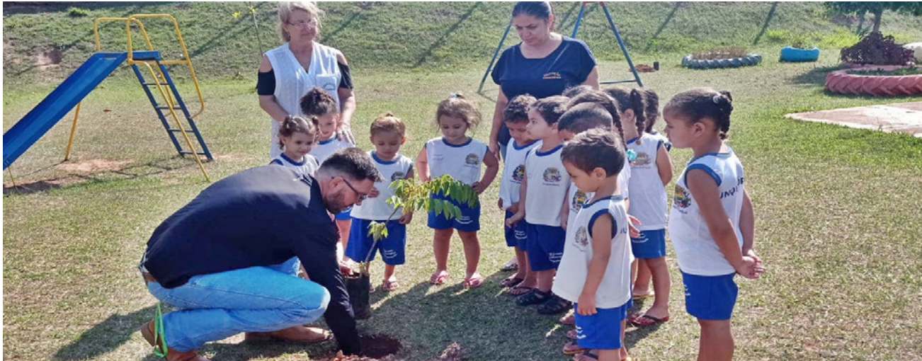
Fts- Prefeitura Municipal