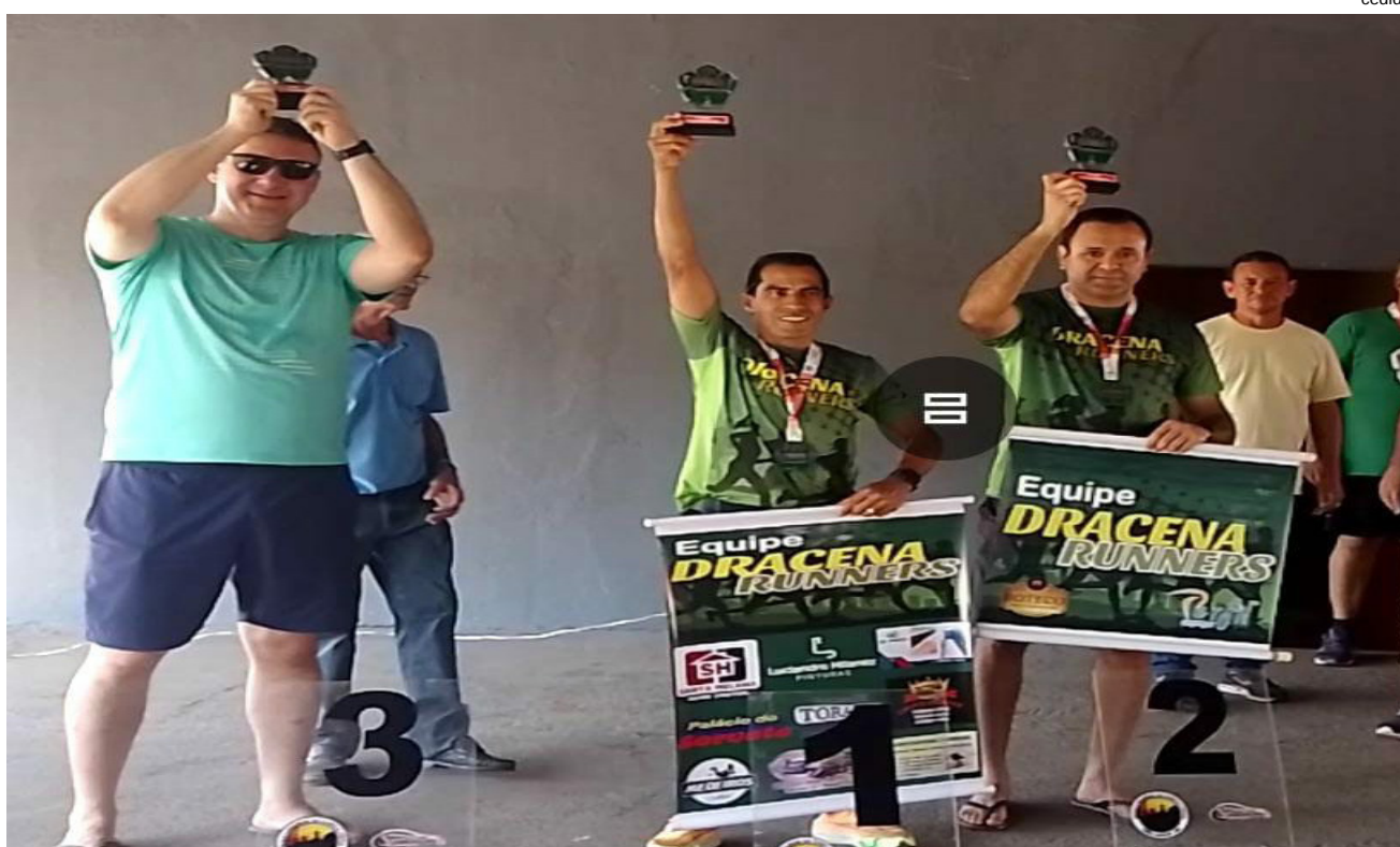
Atleta concluiu a prova em 18 minutos e 17 segundos