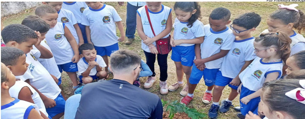
Fts- Prefeitura Municipal

Plantio visa melhorar arborização nos ambientes escolares