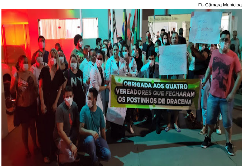
Ft- Câmara Municipal