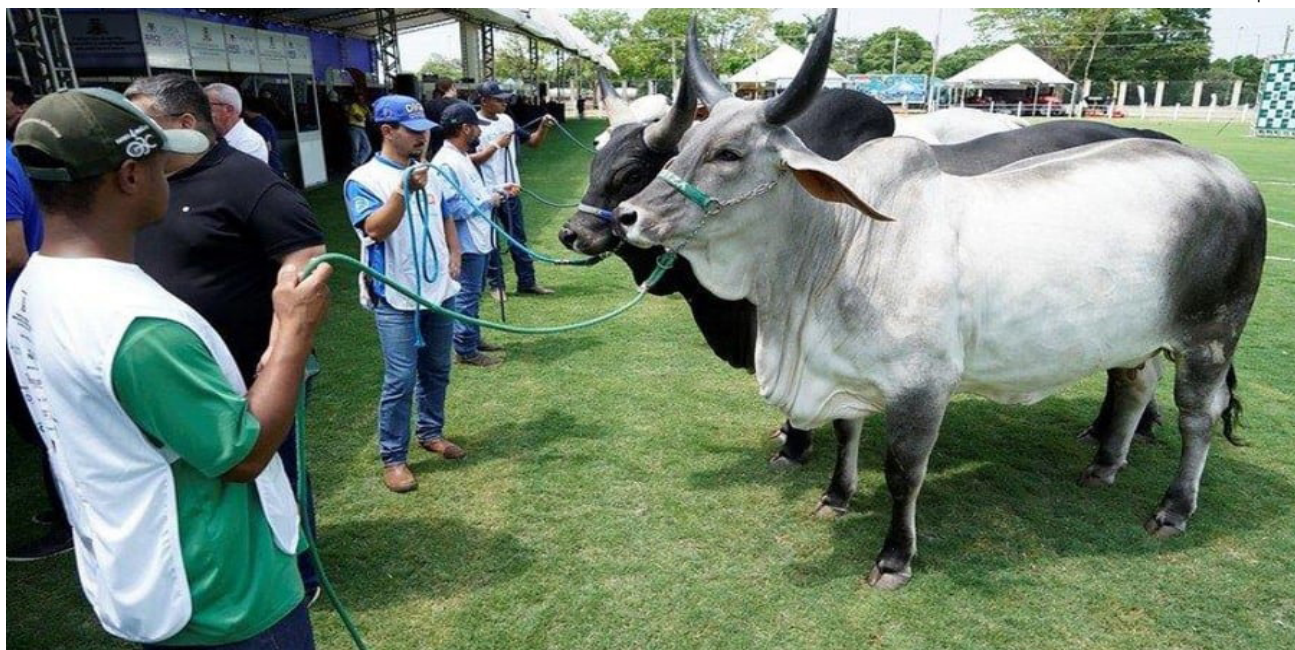
O julgamento na Expo Rio Preto envolve criadores de dez raças zebuínas diferentes

oportunidade valiosa para destacarem a qualidade e o aprimoramento genético de suas raças.