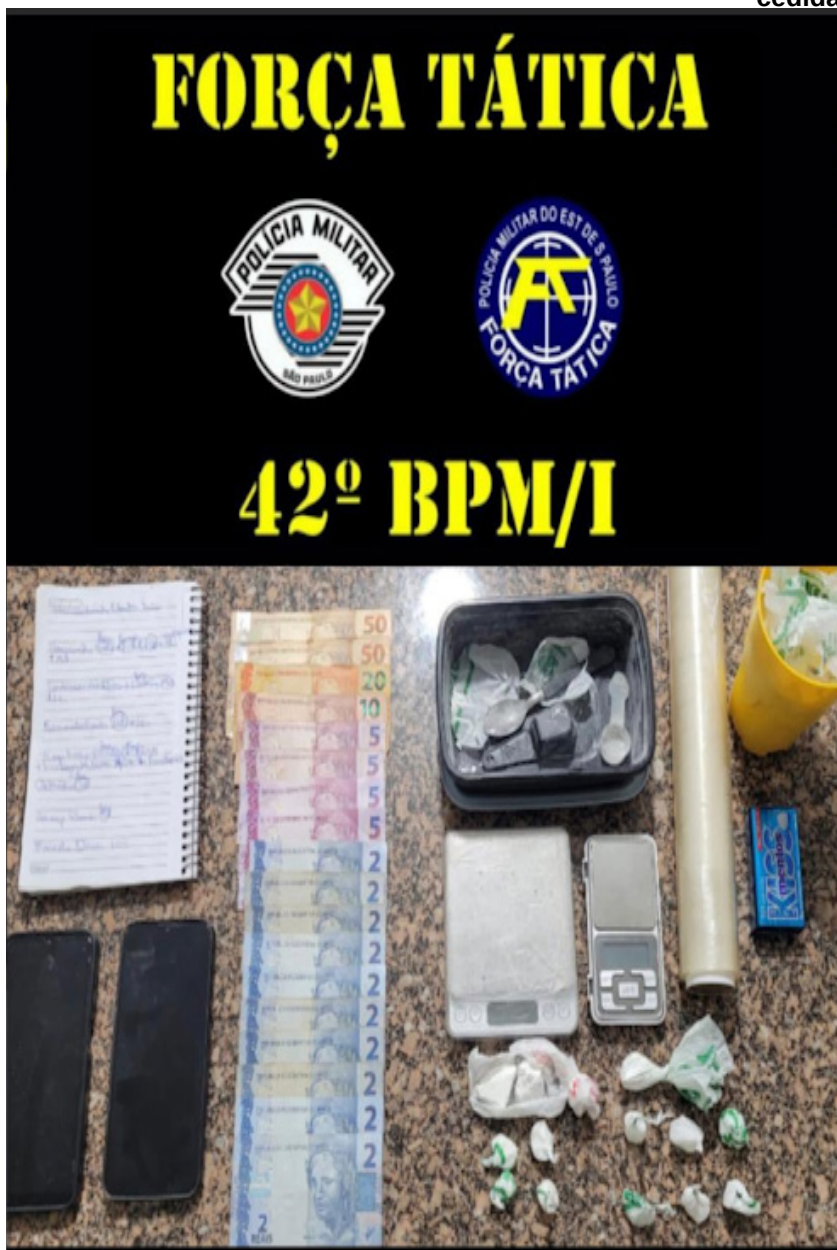
Foram apreendidos cocaína, dinheiro, balança e caderno de anotações