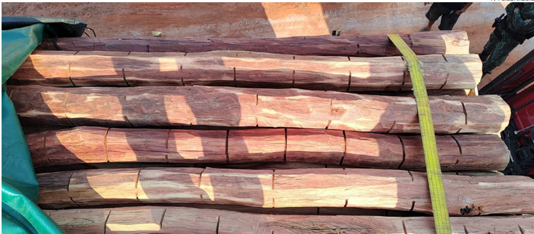
Madeira da espécie jurema-preta estava sendo transportada do Ceará para o Paraná