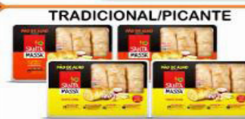
TRADICIONAL/PICANTE PÃO DE ALHO SANTA MASSA 400 GR UNIDADE