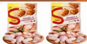
FRANGO À PASSARINHO SADIA 1 KG IQF PACOTE