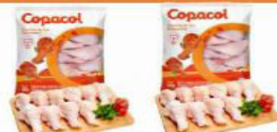
COXINHA DA ASA FRANGO COPACOL 800 GR IQF PACOTE