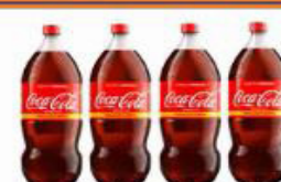
REFRIGERANTE COCA COLA 2,5 LT PET