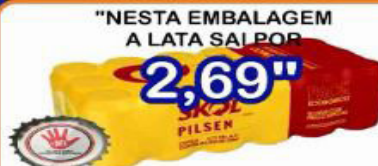
"NESTA EMBALAGEM A LATA SAI POR 2,69" CERVEJA SKOL PILSEN C/18 UND PACOTE