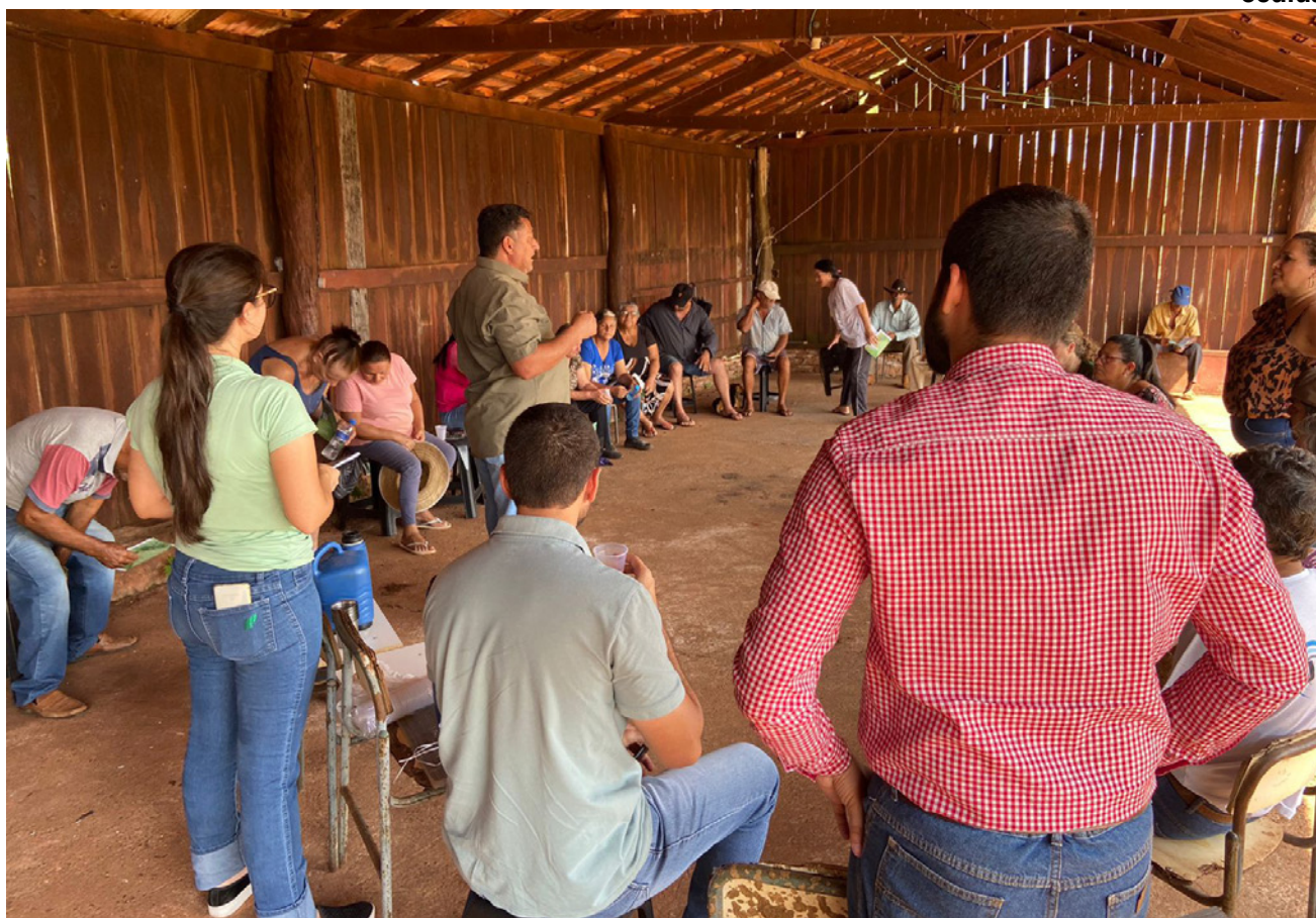
Encontro realizado no assentamento Nova Canaã