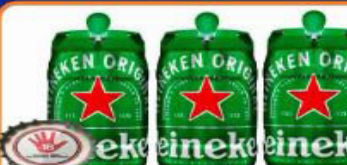
CHOPP HEINEKEN 5 LT BARRIL