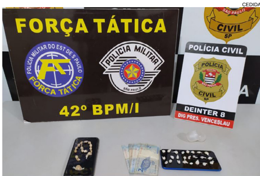
Drogas e dinheiro apreendidos durante os mandados de buscas, duas pessoas foram presas