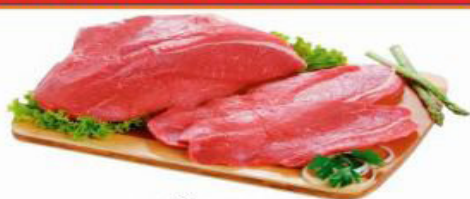
COXÃO DURO KG

CHURRASCÃO DO FINAL DE SEMANA COMEÇA NA REDE TROYANO!