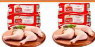
COXA E SOBRECOXA DE FRANGO RICO KG