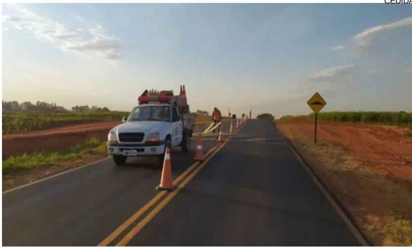
Estrada Salgado Filho