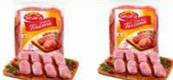
LINGUIÇA TOSCANA SEARA À GRANEL KG