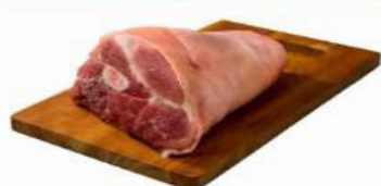
JOELHO SUÍNO KG