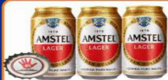
CERVEJA AMSTEL 350 ML PURO MALTE LATA