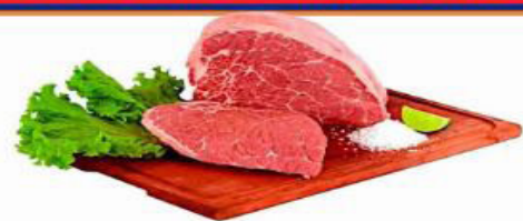
CUPIM BOVINO "ESTRELA"KG