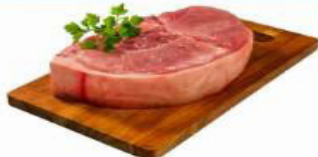
PERNIL SUÍNO KG