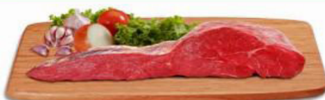
ALCATRA COM MAMINHA KG