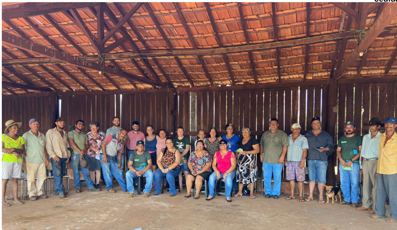
Encontro realizado no assentamento Nova Canaã