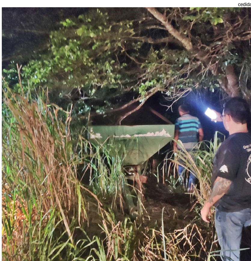
Implementos agrícolas furtados foram localizados escondidos em Presidente Bernardes e Sandovalina