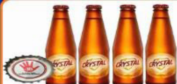
CERVEJA CRYSTAL 250 ML PILSEN LONGNECK