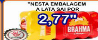
"NESTA EMBALAGEM A LATA SAI POR 2,77" CERVEJA BRAHMA CHOPP C/18 UND PACOTE