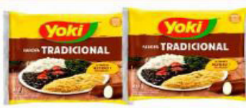
FAROFA MANDIOCA TEMPERADA YOKI 400 GR PACOTE