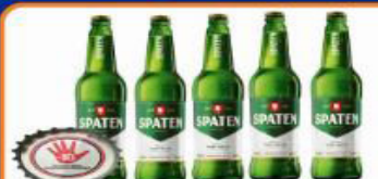
CERVEJA SPATEN 600 ML ONE WAY GARRAFA