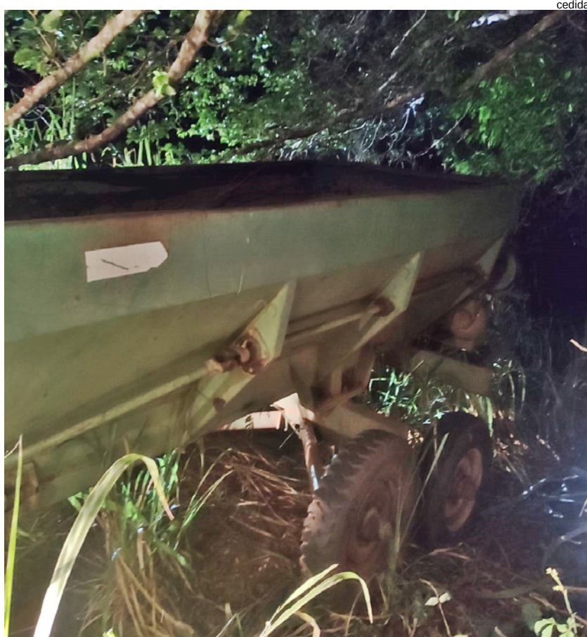
Implementos agrícolas furtados foram localizados escondidos em Presidente Bernardes e Sandovalina