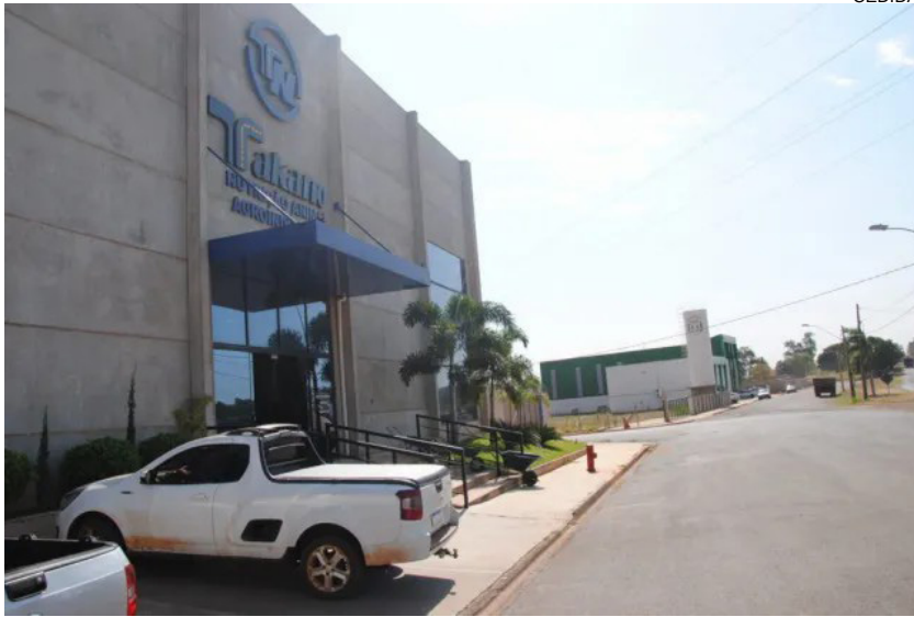
Distrito Industrial IV