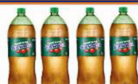
GUARANÁ FUNADA 2 LT PET