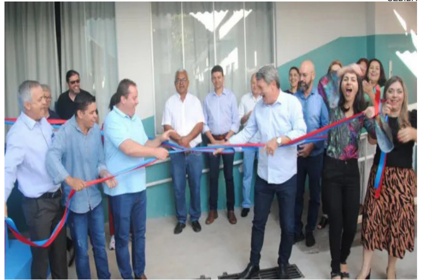
Salas de Aula