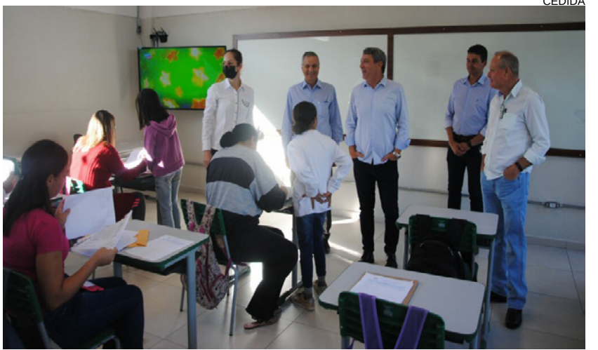
Salas de Aula