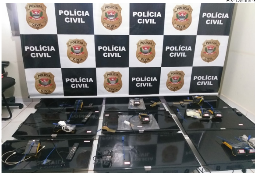
Polícia Civil da região executou os mandados de buscas em apreensões

de de Emilianópolis mais especificamente na modalidade de bingos "on-line", também conhecida como vídeo bingo "on-line".