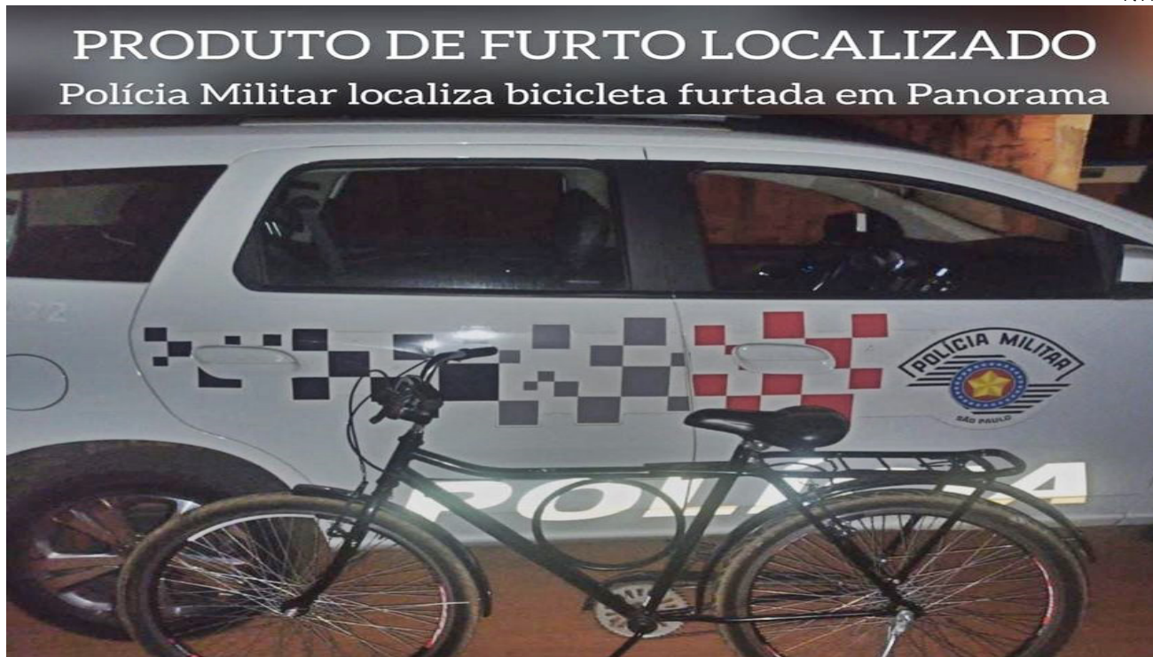
Bicicleta recuperada em Panorama

adquirido a bicicleta de dois adolescentes. A vítima compareceu ao local e reconheceu a bicicleta como de sua propriedade.