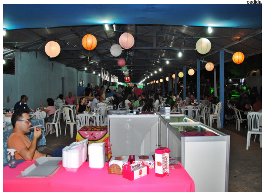
Cantina do Junqueirópolis Esporte Clube