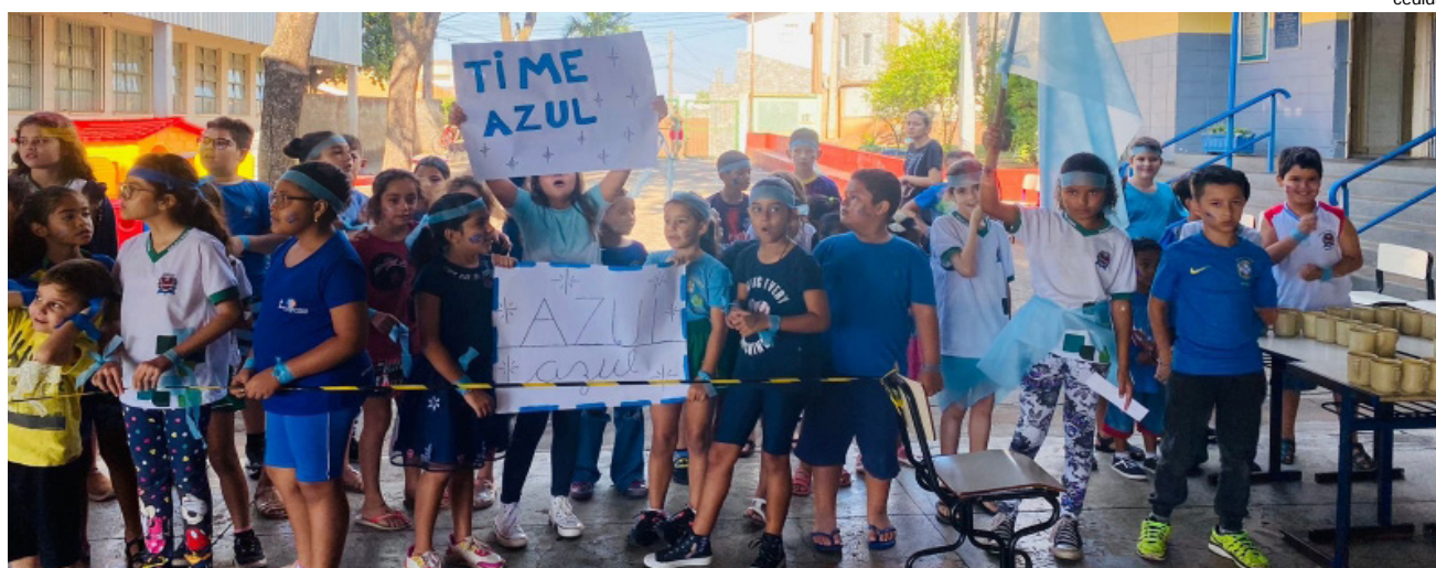
Gincana realizada durante a semana em comemoração ao Dia da Criança