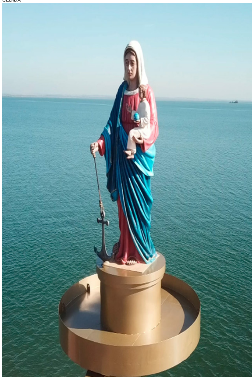
Estrutura para imagem de N.Sª dos Navegantes, em Presidente Epitácio: obra realizada com recursos repassados