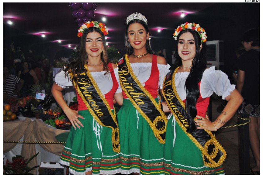
Rainha e Princesas da Festa na abertura