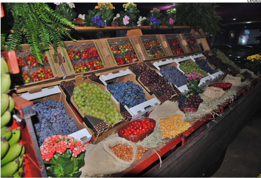
Produtos da fruticultura expostos na Aceruva