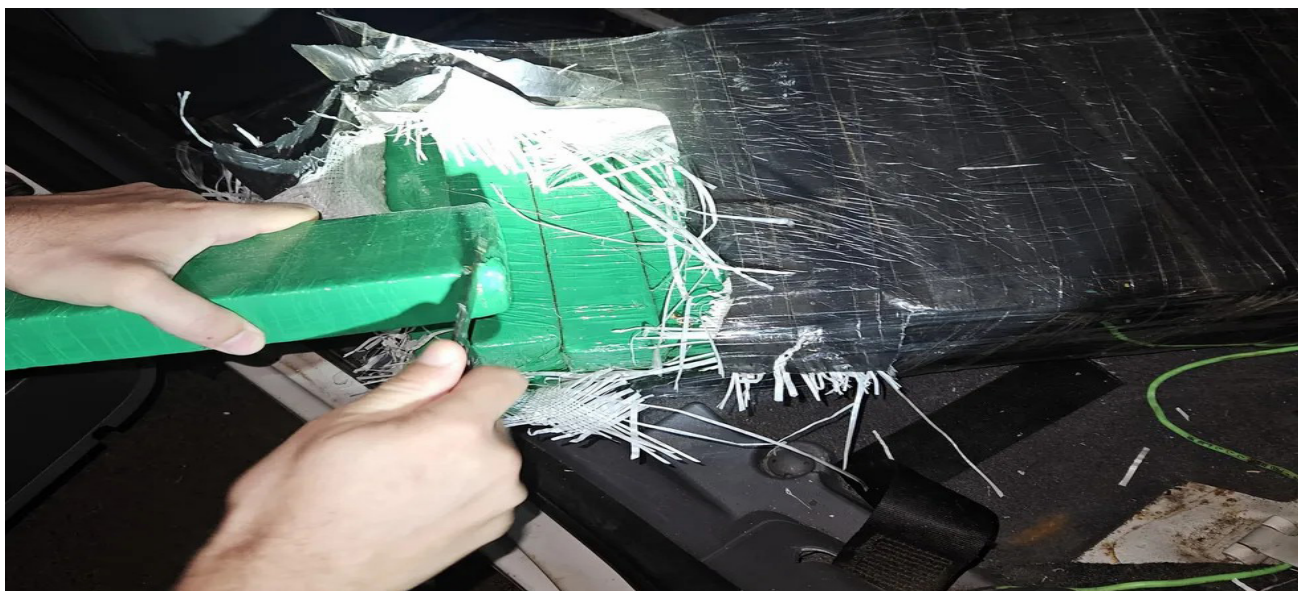
Tabletes de maconha encontrados no veículo