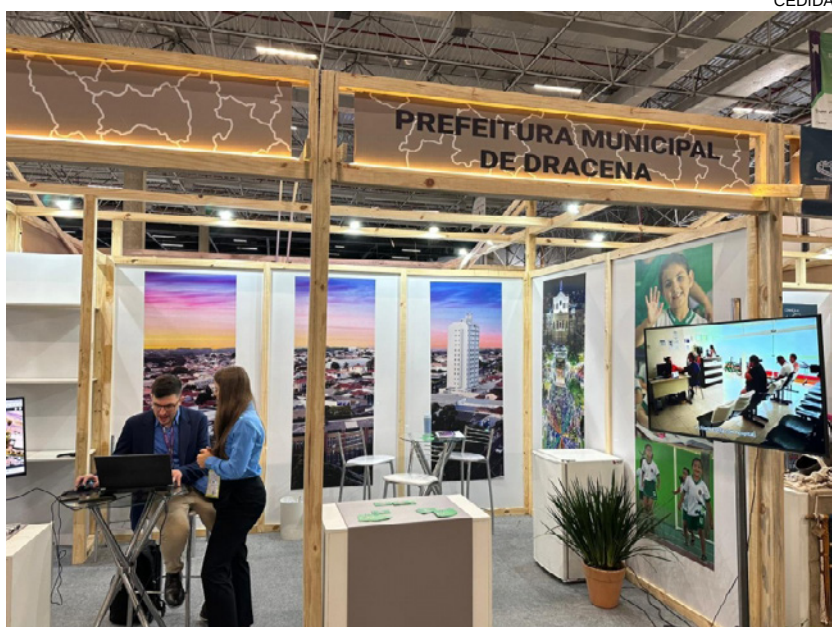
Estade da Prefeitura de Dracena