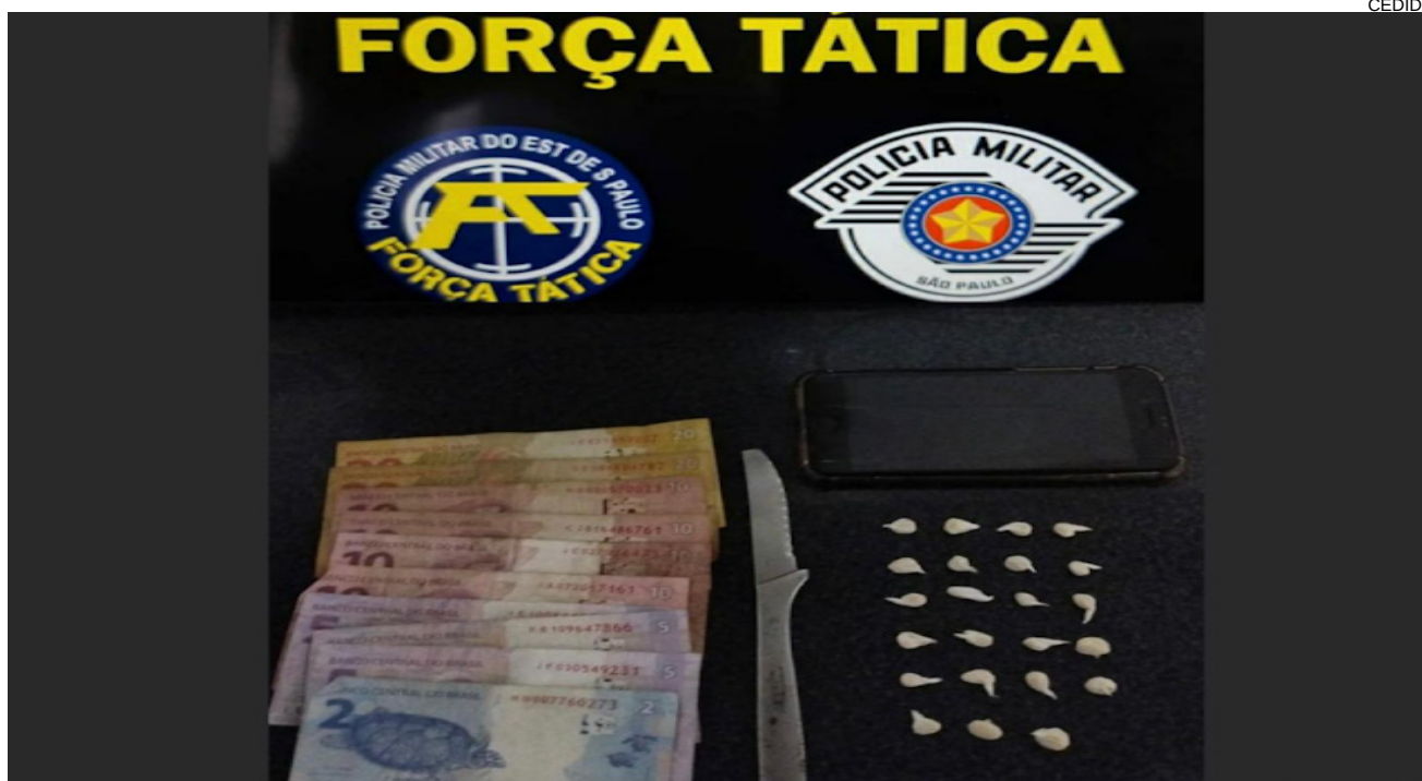
Foram encontrados com menor 23 pedras de crack