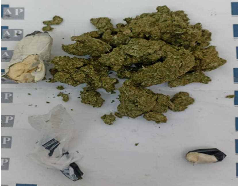
Cocaína e maconha apreendidas com visita na penitenciária de Presidente Bernardes