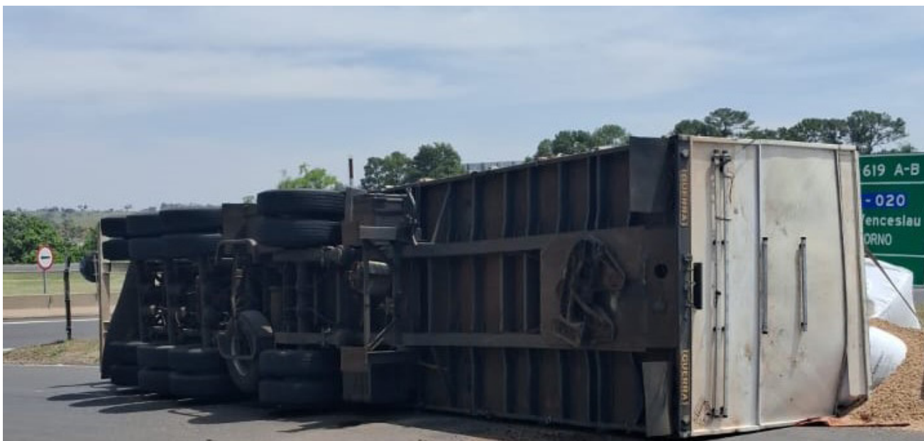
Carreta transportava carga de ração