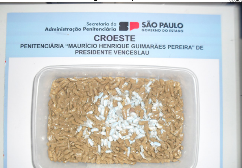
976 comprimidos foram apreendidos nos pertences de visitante, na P2 de Presidente Venceslau