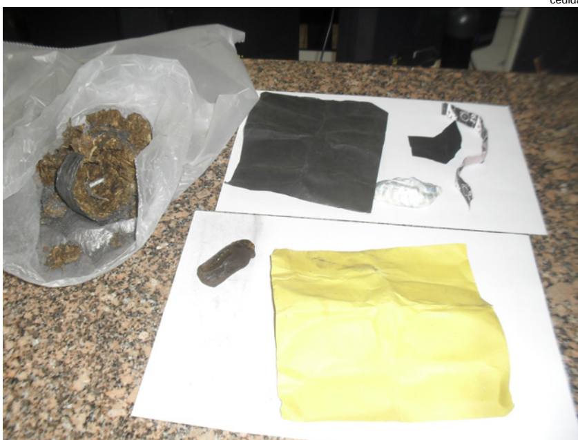
Na Penitenciária 2 de Presidente Venceslau, visitante levava drogas e comprimidos