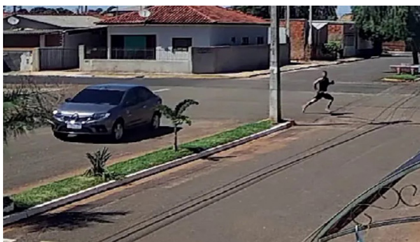
Imagem do homem ao fugir da prisão em flagrante na Delegacia de Narandiba há quase duas semanas