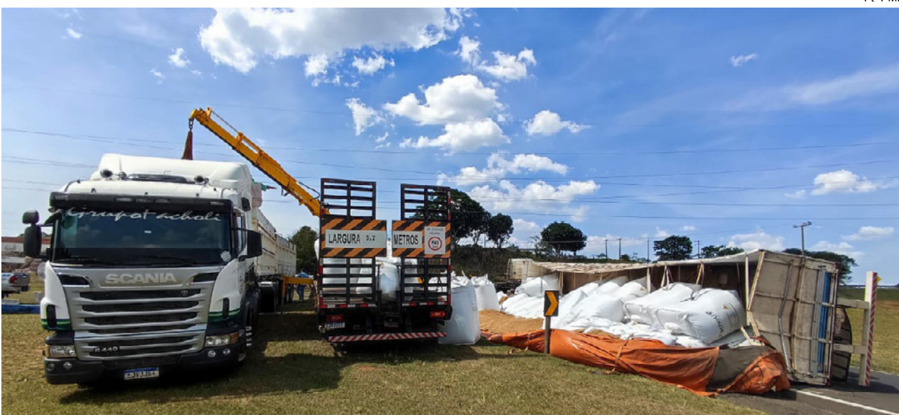
Acidente ocorreu na alça de acesso à rodovia Integração