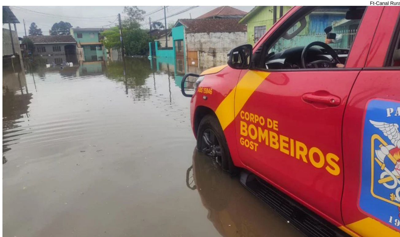
Estado do PR registra fortes chuvas nos últimos dias e lavoura está seriamente prejudicada

dicadas- As lavouras de soja, milho e feijão, que estão sendo plantadas, também foram prejudicadas. As chuvas volumosas podem exigir replantio ou nova colocação de adubo, o que aumenta os custos de produção.