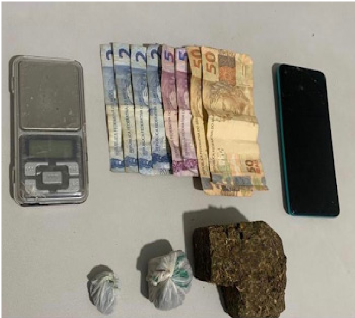
Maconha encontrada na residência do acusado de tráfico em Presidente Epitácio

Na segunda-feira (30) policiais militares do 42º Batalhão de Polícia Militar do Interior efetuaram a prisão de um homem por tráfico de drogas em Presidente Epitácio.