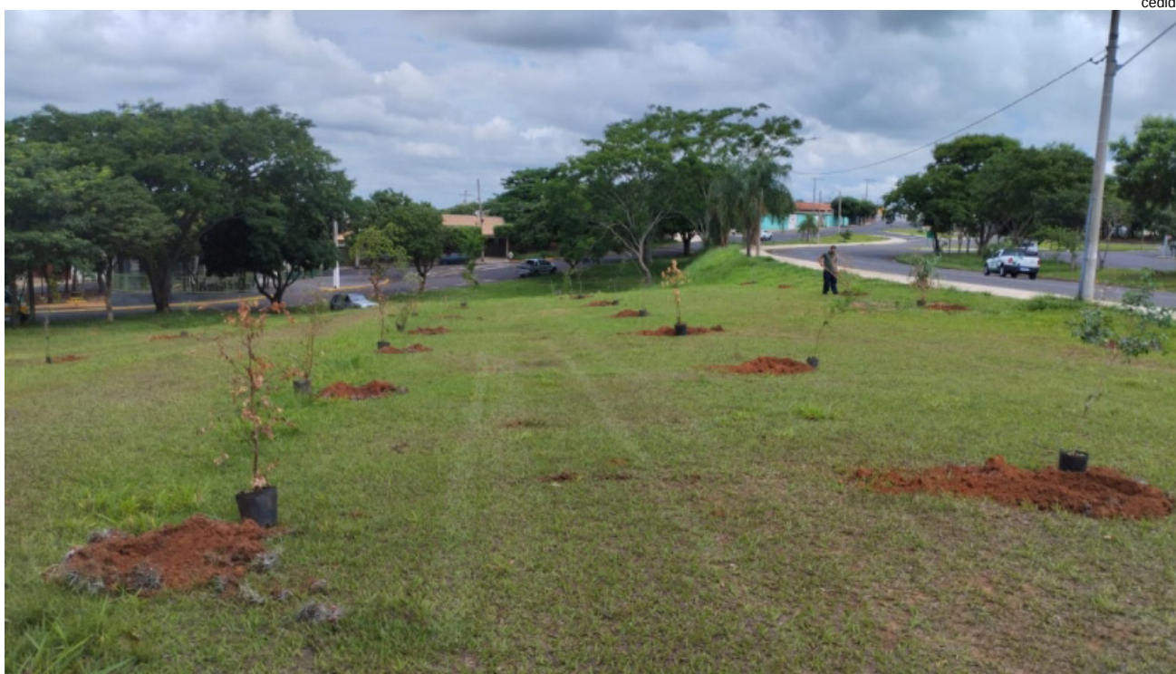
Calçada Ecológica no Postão Takashi Enokibara