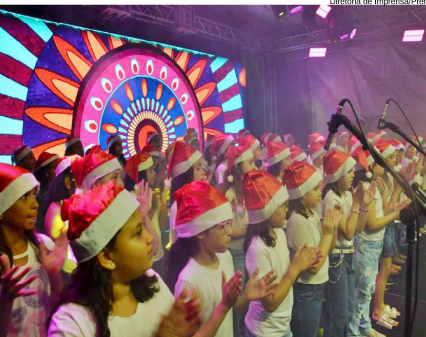
Diretoria de Imprensa/Pref.