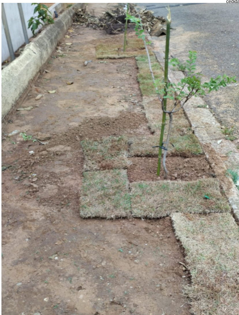
Calçada Ecológica no Postão Takashi Enokibara

creto) no local será feito pela empresa contratada para a reforma do postão.