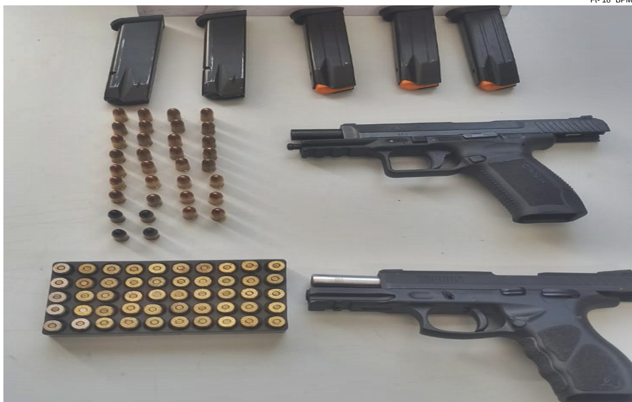
Ft- 18º BPM/I