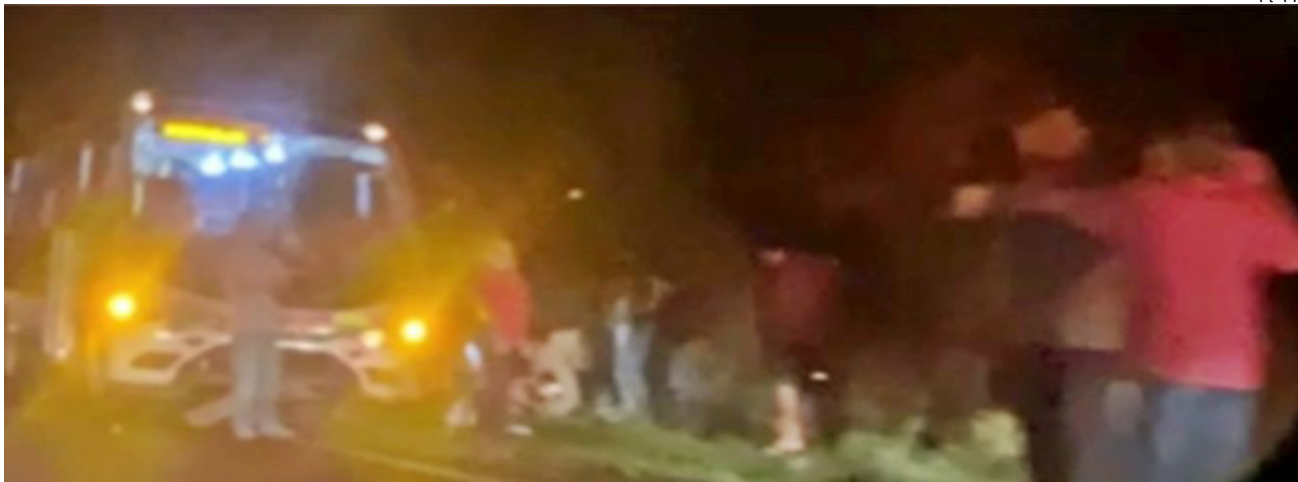
Acidente ocorreu na noite de ontem na vicinal Lucélia-Adamantina