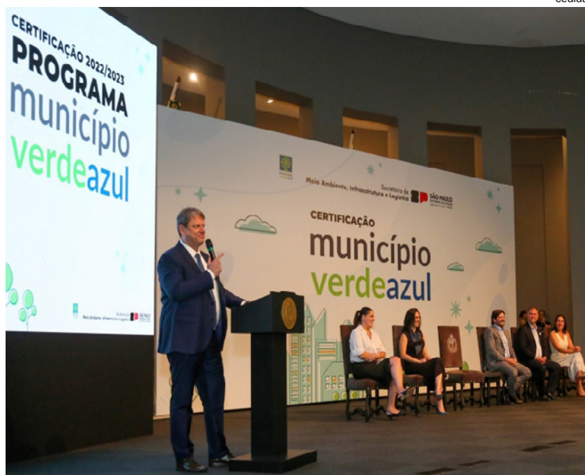
Governador Tarcísio de Freitas durante o ato no DAEE