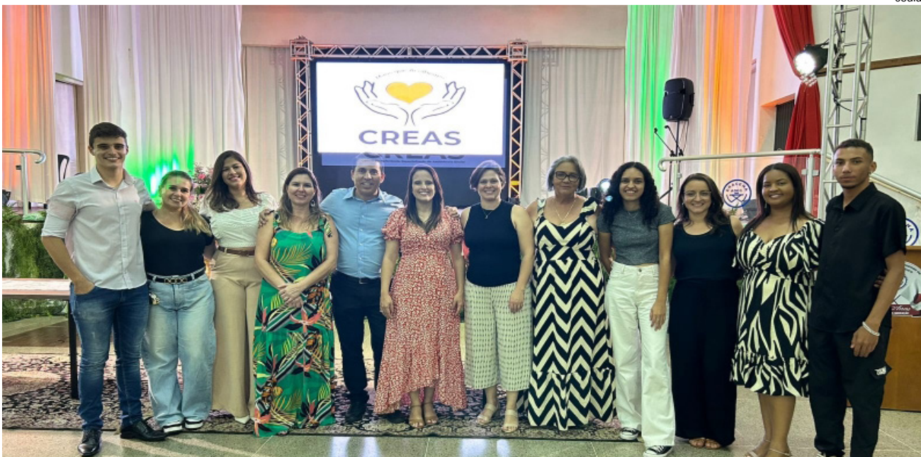
Equipe do equipamento CREAS