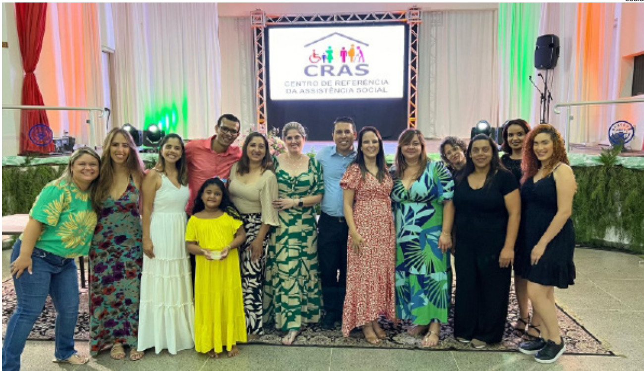
Equipe do equipamento CRAS