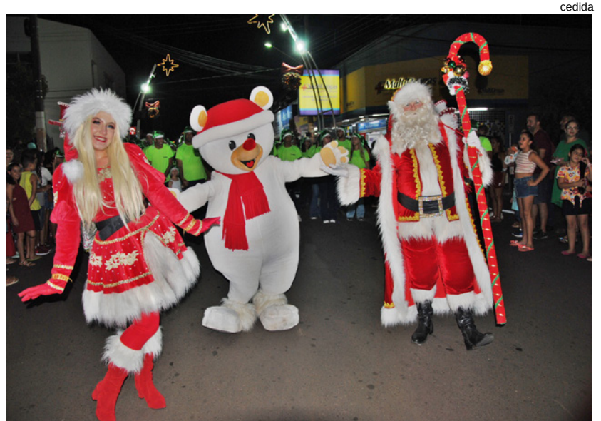
Caravana da Viterra Bioenergia atrai centenas de pessoas