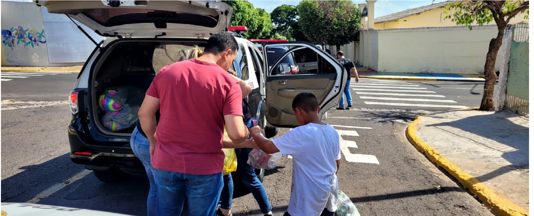
Policiais civil entregam doces, bolas e outros brinquedos para crianças