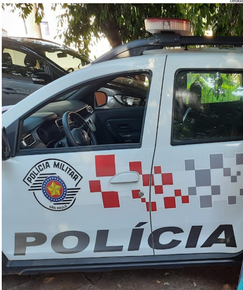
Homem de 71 anos foi preso após a agredir a companheira de 73 anos com socos