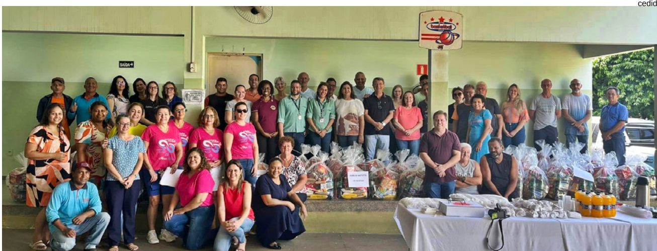
Entrega das cestas aos colaboradores para distribuição às famílias