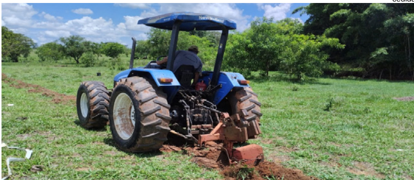
Plantio encerrou no último dia 15