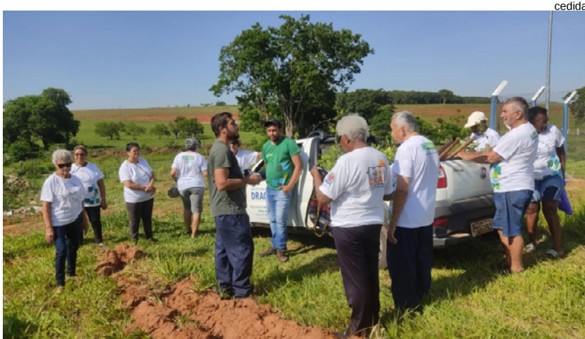
Integrantes do Centro de Convivência dos Idosos participaram do plantio