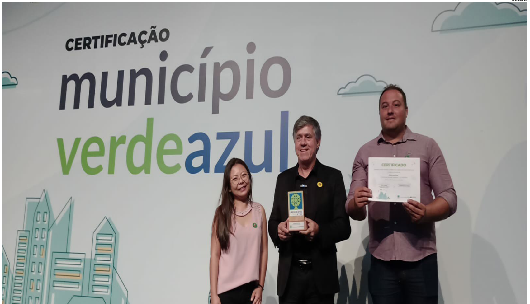
Prefeito Márcio Cardim (centro) com o prêmio Município VerdeAzul