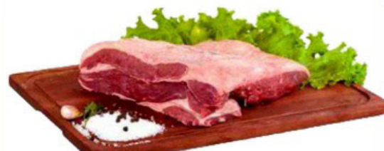
CAPA CONTRA FILÉ KG