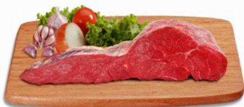
ALCATRA COM MAMINHA KG

Ofertas válidas de 28/12 a 29/12/2023 ou enquanto durarem os estoques.