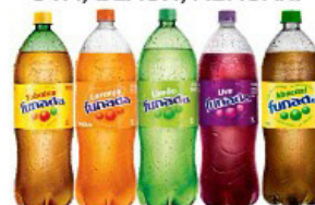
RERIGERANTE FUNADA 2 LT PET