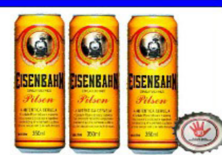
CERVEJA EISENBAHN PILSEN 350 ML LATA