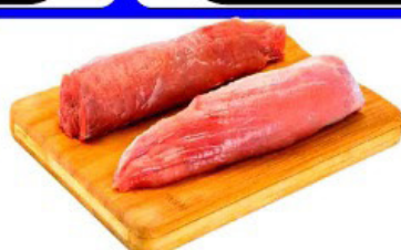
FILÉ MIGNON SUÍNO "FILEZINHO" KG