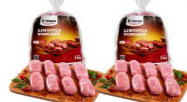
LINGUIÇA TOSCANA FRIMESA À GRANEL KG