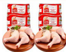
COXA E SOBRECOXA FRANGO RICO KG