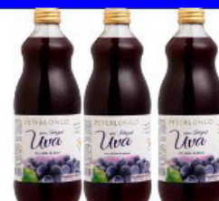
SUCO PETERLONGO UVA 1,5 LT GARRAFA