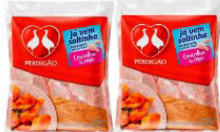
COXINHA DA ASA FRANGO PERDIGÃO 800 GR PACOTE