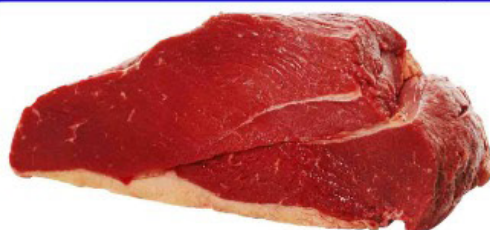
PONTA DE PEITO SEM OSSO KG