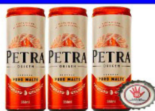
CERVEJA PETRA ORIGEM 350 ML PURO MALTE LATA