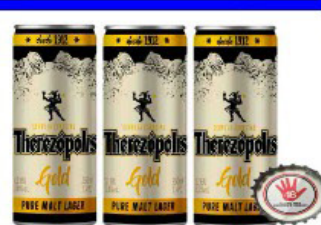
CERVEJA THEREZOPOLIS 350 ML PURO MALTE LATA