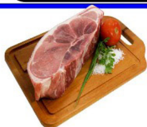
PALETA SUÍNA KG