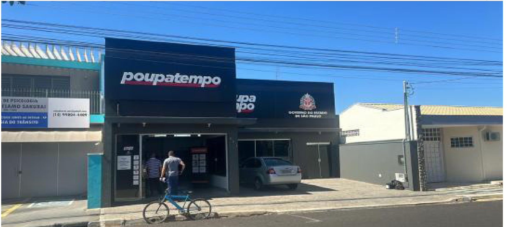
Homem foi preso ao regularizar seus documentos pessoais no Poupatempo