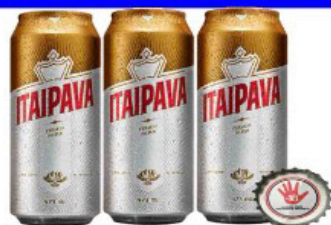
CERVEJA ITAIPAVA PILSEN 473 ML LATÃO