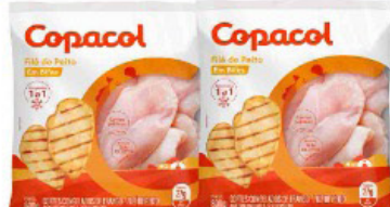
FILÉ DE PEITO FRANGO EM BIFÉS COPACOL 800 GR