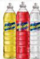
Detergente Miruano 500ml Limite O3un 2,49 CLUBE BIG DE DESCONTO 1,79 UN