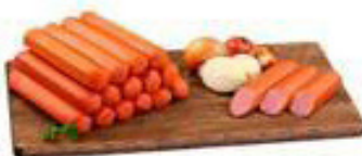
Salsicha Perdígão kg 14,98 CLUBE BIG DE DESCONTO 9,98 KG