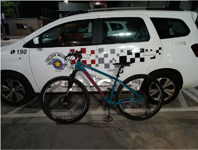
Bicicleta furtada em Dracena foi recuperada