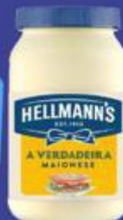
Malonese Hellmanns 500g Tradicional