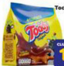
Achocolatado Toddy Sachê 480g 12,99 CLUBE BIG DE DESCONTO 10,99 UN