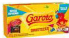
Bombom Garoto Sortidos 250g 11,98 CLUBE BIG DE DESCONTO 8,98 UN