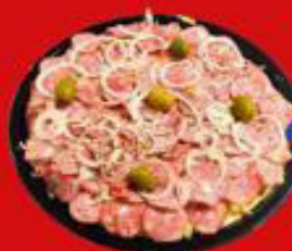
Pizza de Calabresa Big Cake kg

29,90 Ative no APP e economize! 25,90 kg