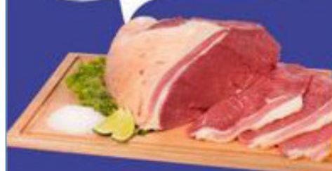
Coxão Mole Bovino Fatiado kg