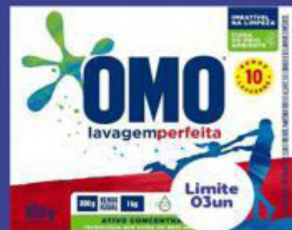
Sabão em Pó Omo Caixa 800g