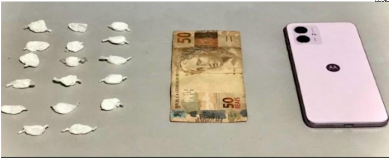
Porções de cocaína, dinheiro e celular encontrados com o homem

tou um indivíduo que ao perceber a viatura tentou fugir, contudo foi abordado. Submetido a busca pessoal os policiais encontraram 17 (dezesete) porções de cocaína, um aparelho celular e uma cédula de R$ 50.