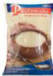
Arroz Philomena Tipo 1 - 5kg 26,90 CLUBE BIG DE DESCONTO 22,90 UN