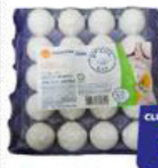
Ovos Katayama PVC Branco C/20 Grande 11,99 CLUBE BIG DE DESCONTO 8,99 UN