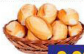
Pão Francês Big Cake kg 9,90 KG