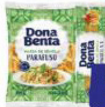
Macarrão Dona Benta Sêmola 500g 2,59 UN