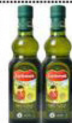
Azeite Carbonell Extra Virgem Vidro 500ml 41,90 CLUBE BIG DE DESCONTO 38,90 UN