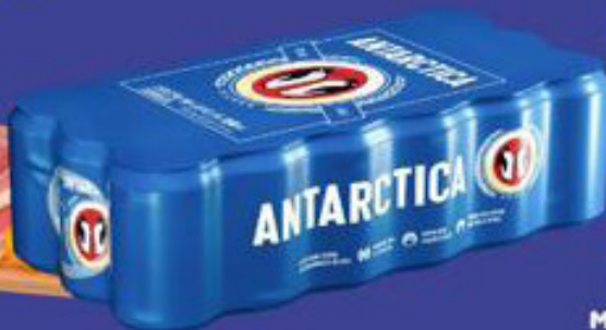
Cerveja Antarctica Lata 350ml Pack C/18 46,44 UN