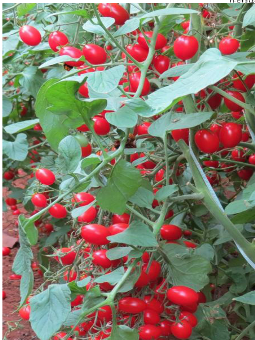
Produção anual de hortaliças no Brasil é de aproximadamente 23 milhões de toneladas