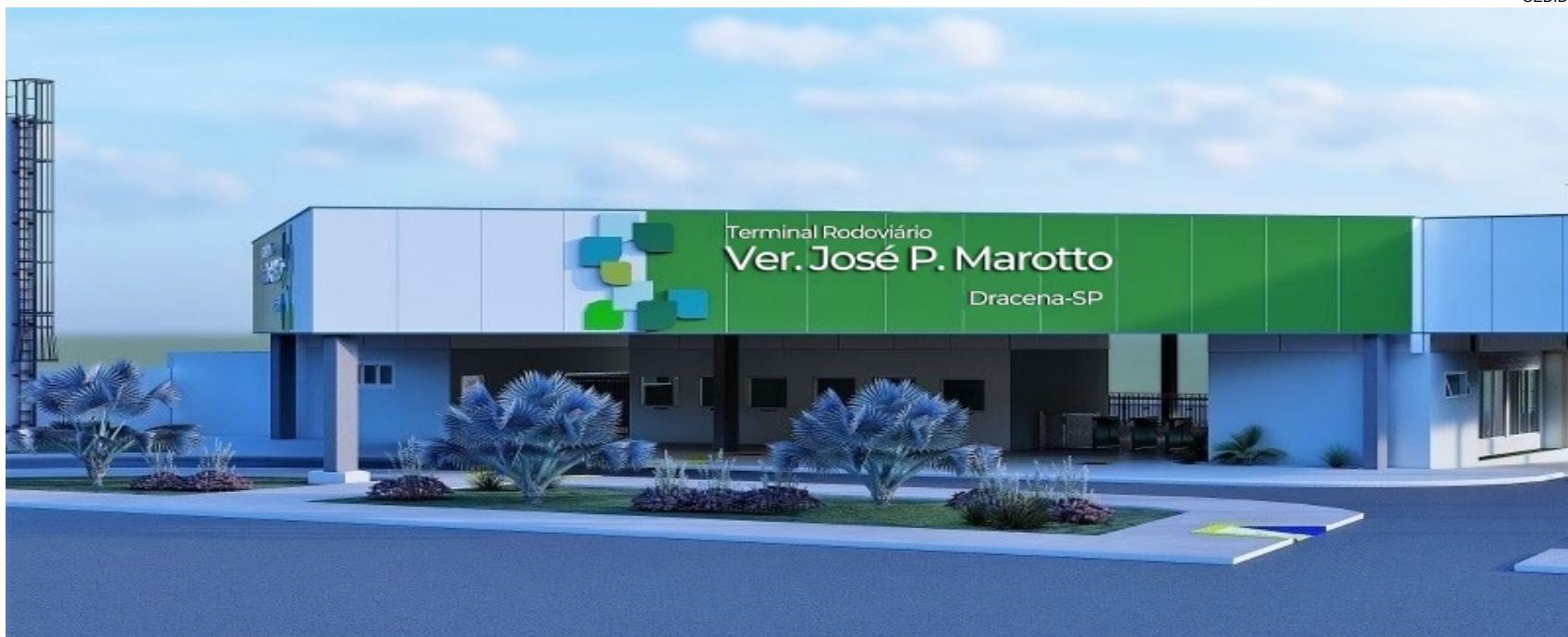
Terminal Rodoviário como ficará depois de finalizada a reforma geral