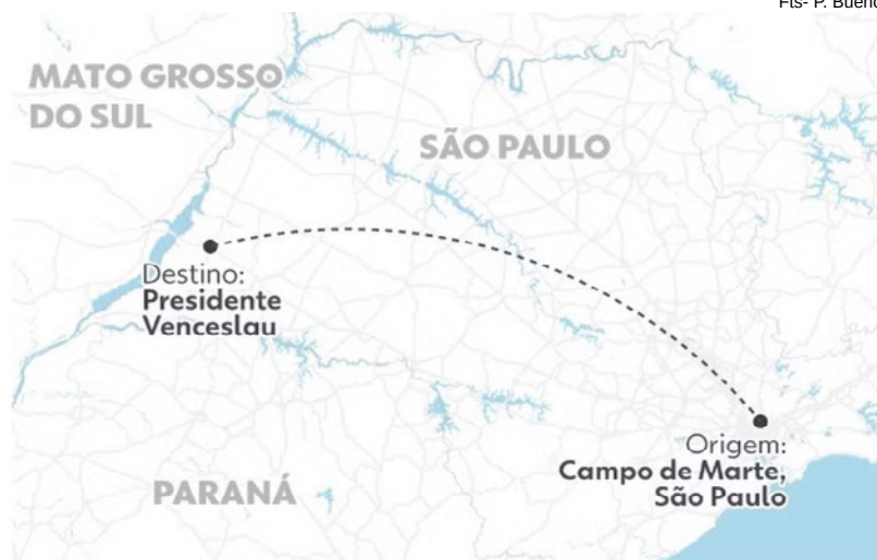
Aeronave decolou do campo de Marte com destino a Presidente Venceslau