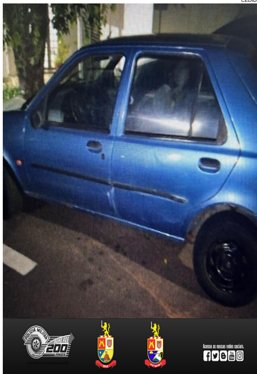
Ford Fiesta recuperado pela PM em Presidente Venceslau na terça-feira