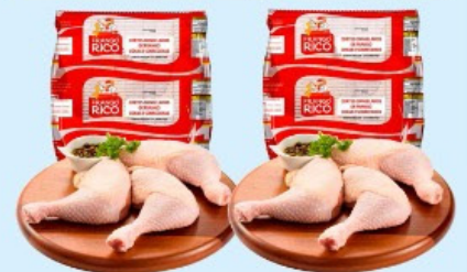
COXA E SOBRECOXA FRANGO RICO Kg