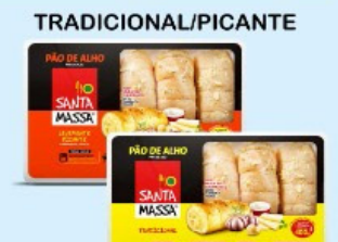
PÃO DE ALHO SANTA MASSA 400g