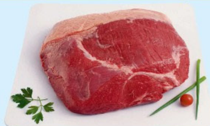
MIOLO DO ALCATRA Kg