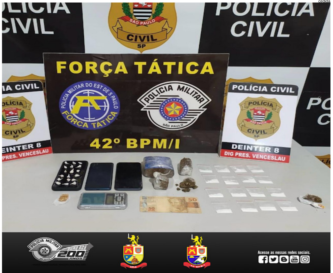
Drogas, celular e dinheiro apreendidos na operação de hoje (26) em Santo Anastácio

Na rua Luís de Oliveira Neto, foram apreendidas 2 porções grandes de maconha e meio tijolo da mesma