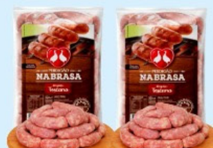
LINGUIÇA TOSCANA PERDIGÃO NABRASA À GRANEL Kg