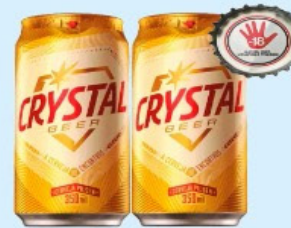
CERVEJA CRYSTAL PILSEN 350ml