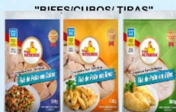
FILE DE PEITO FRANGO NUTRIBEM 500g