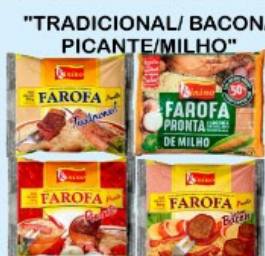
FAROFA KININO PRONTA 400g