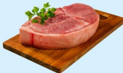
PERNIL SUINO COM OSSO Kg