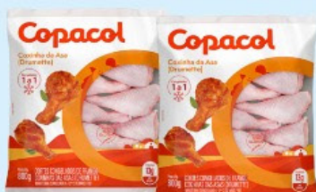
COXINHA DA ASA FRANGO COPACOL 800g