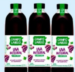
SUCO DE UVA CAMPO LARGO 1,350ml