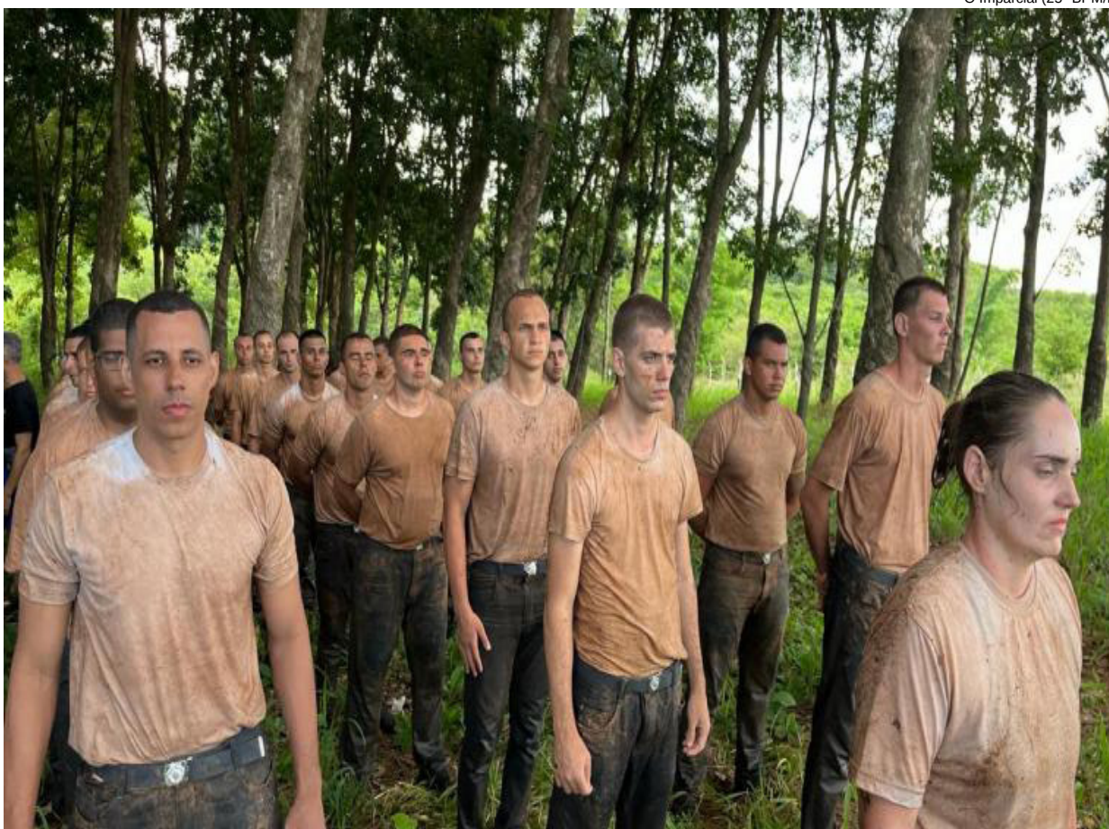
O Imparcial (25º BPM/I)