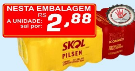
CERVEJA SKOL PILSEN 350ml