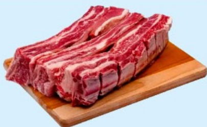
COSTELA DE BOI RIPA Kg

Ofertas válidas 26/01 A 28/01/2024 ou enquanto durarem os estoques.