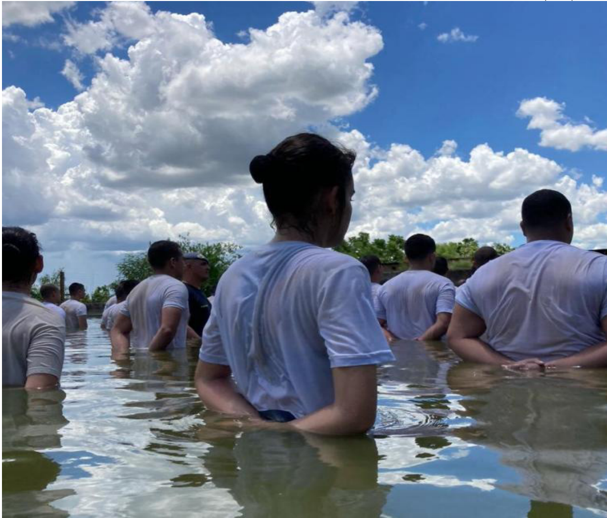
O Imparcial (25º BPM/I)