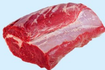
FILE DE COSTELA BOVINA "ENTRECOTE" Kg.