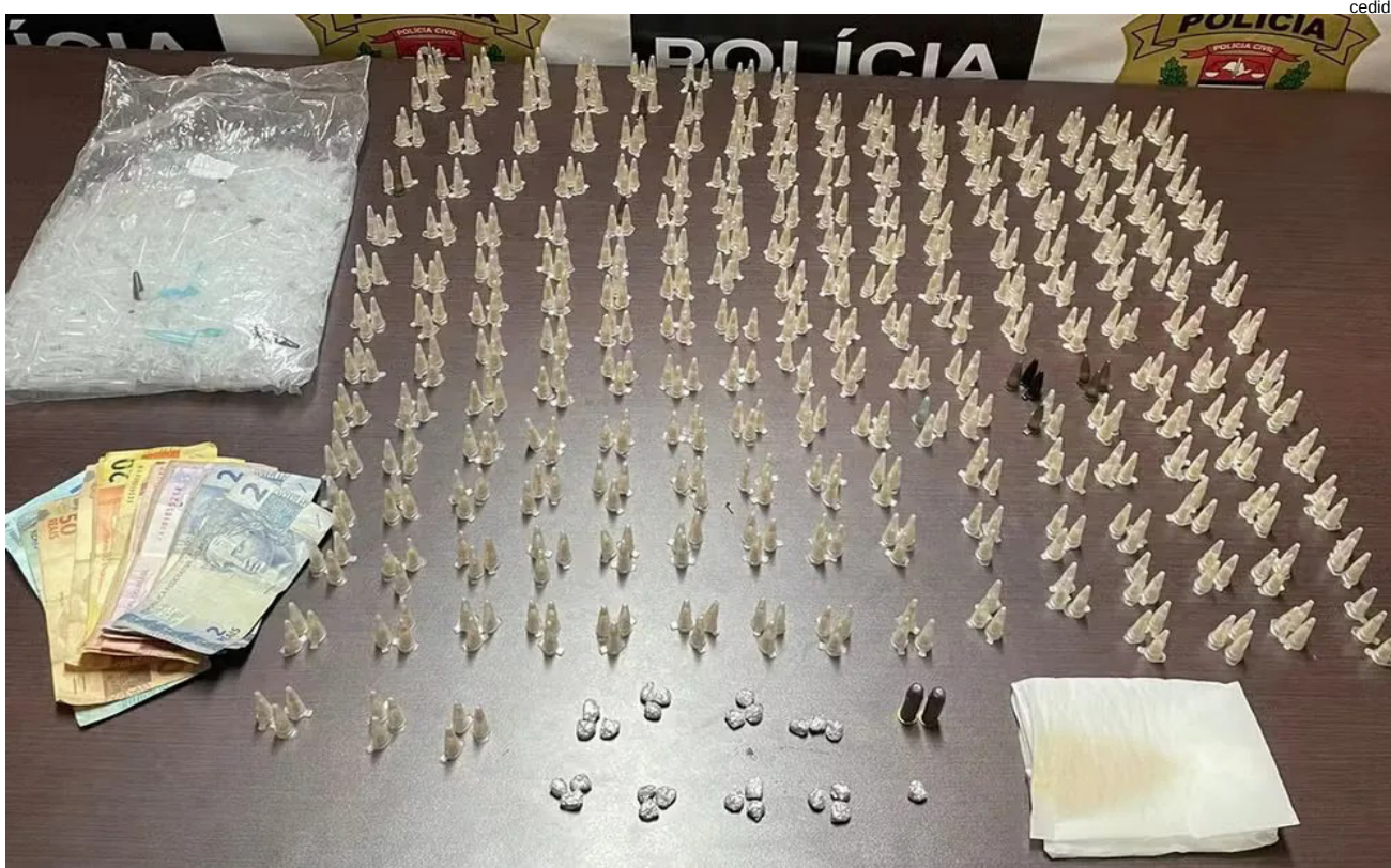
Pai, filho e namorada foram presos com centenas de porções de crack

Conforme a Polícia Civil, o local onde supostamente era praticado o tráfico está situado há poucos metros de uma creche municipal, “o que agrava ainda mais a situação dos autua-