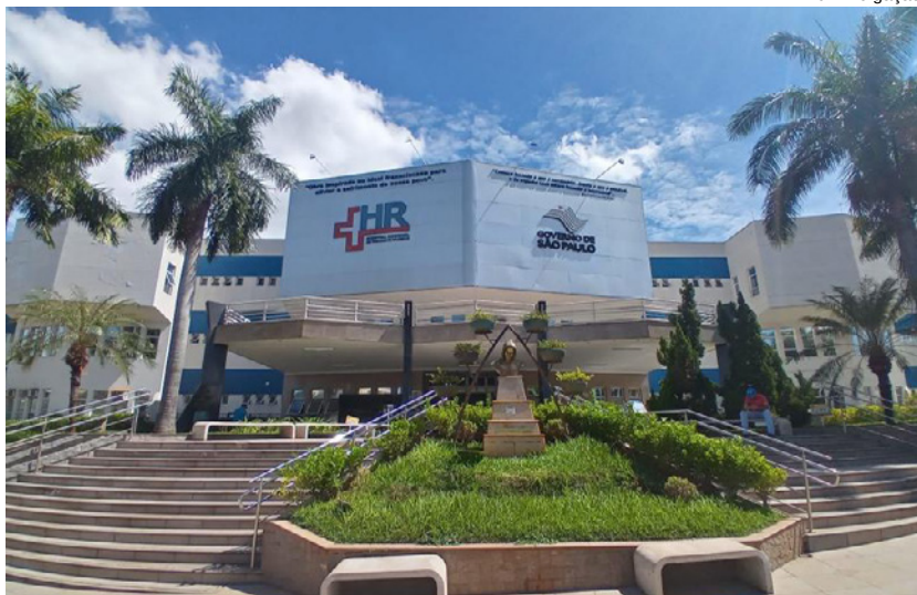
Homem de 29 anos morreu domingo no HR de Presidente Prudente