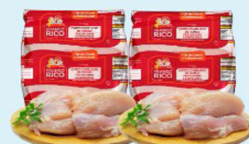
FILÉ DE COXA E SOBRECOXA FRANGO RICO kg