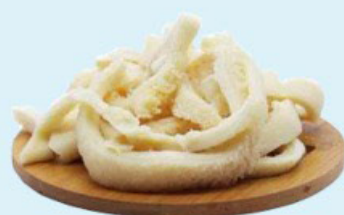
BUCHO BOVINO kg