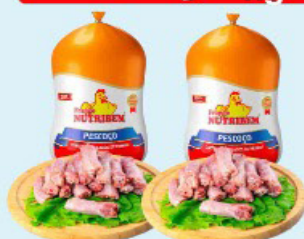
PESCOÇO DE FRANGO NUTRIBEM kg