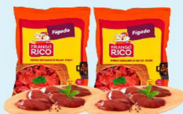
FÍGADO DE FRANGO RICO kg