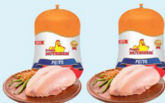
PEITO FRANGO NUTRIBEM kg