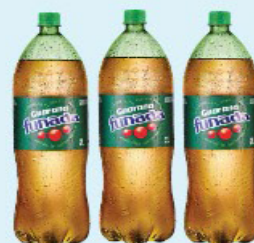
GUARANÁ FUNADA 2l