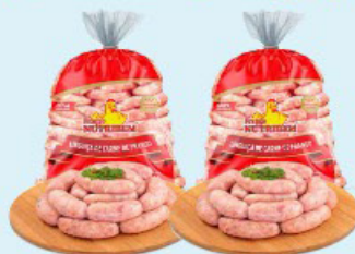
LINGUIÇA DE FRANGO NUTRIBEM kg