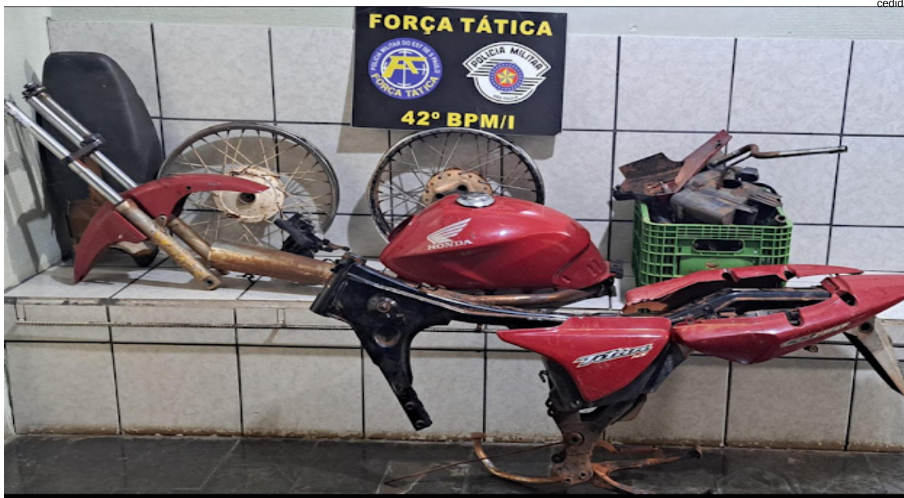
Motocicleta desmontada encontrada no assentamento: suspeito fugiu