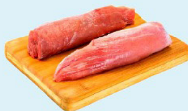
FILÉ MIGNON "FILEZINHO SUÍNO" kg