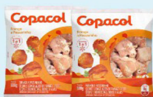
FRANGO A PASSARINHO COPACOL 800g