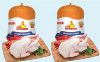
FRANGO INTEIRO NUTRIBEM kg