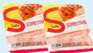
SOBRECOXA FRANGO SADIA BANDEJA 1kg