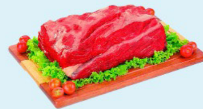
PONTA DE PEITO SEM OSSO kg