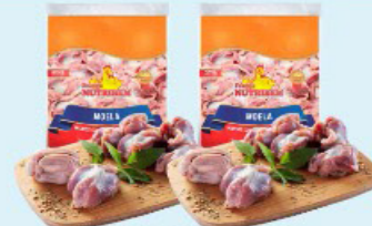
MOELA DE FRANGO NUTRIBEM 1kg