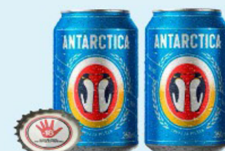
CERVEJA ANTARCTICA BOA LATA 350ml