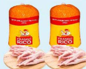
PÉ DE FRANGO RICO kg