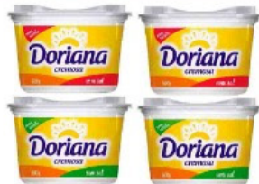
MARGARINA DORIANA 500 GR. COM E SEM SAL POTE