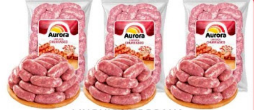
LINGUIÇA TOSCANA AURORA CHURRASCO KG