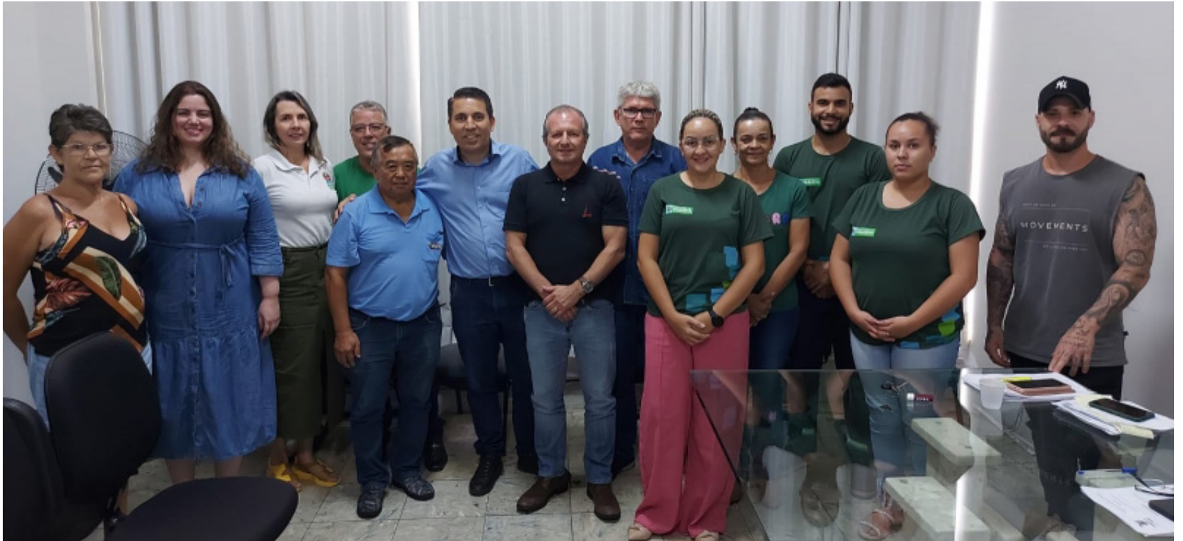
Reunião na sala do cidadão da Prefeitura, quarta-feira, 3