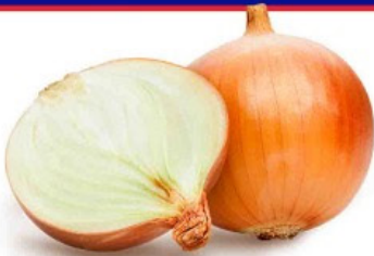
CEBOLA NACIONAL KG