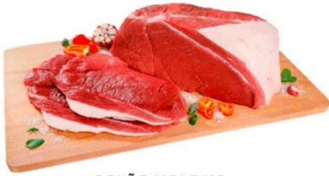
COXÃO MOLE KG

Ofertas válidas de 04/01 à 07/01/2024 ou enquanto durarem os estoques.