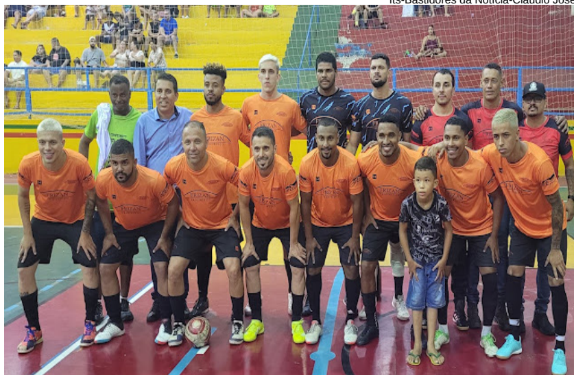
Madeiraira Triângulo/Frizan goleou por 12 x1 o Amigos do Nunes/Amigos do Riti