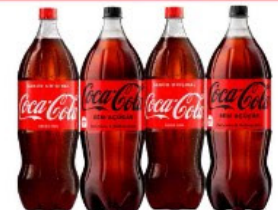
COCA COLA 2 LT "NORMAL/ZERO PET"