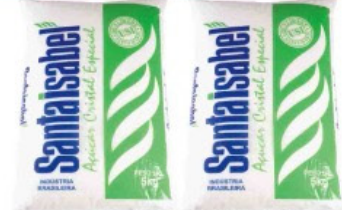
AÇÚCAR CRISTAL SANTA ISABEL 5 KG PACOTE