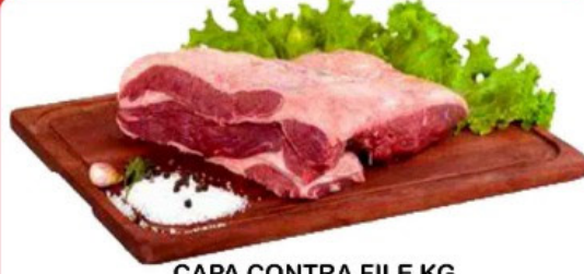
CAPA CONTRA FILE KG