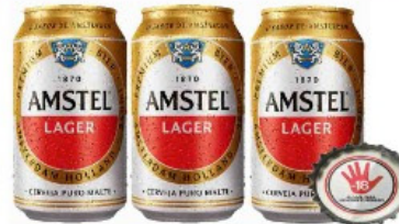
CERVEJA AMSTEL PURO MALTE 350 ML LATA