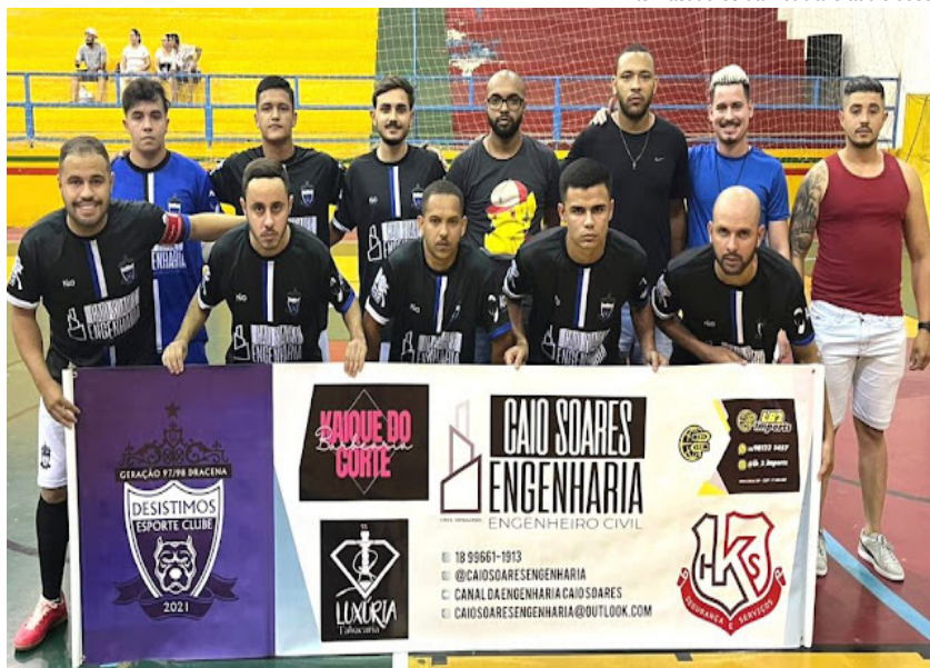
Desistimos F.C. venceu por 4 x 2 JZB United