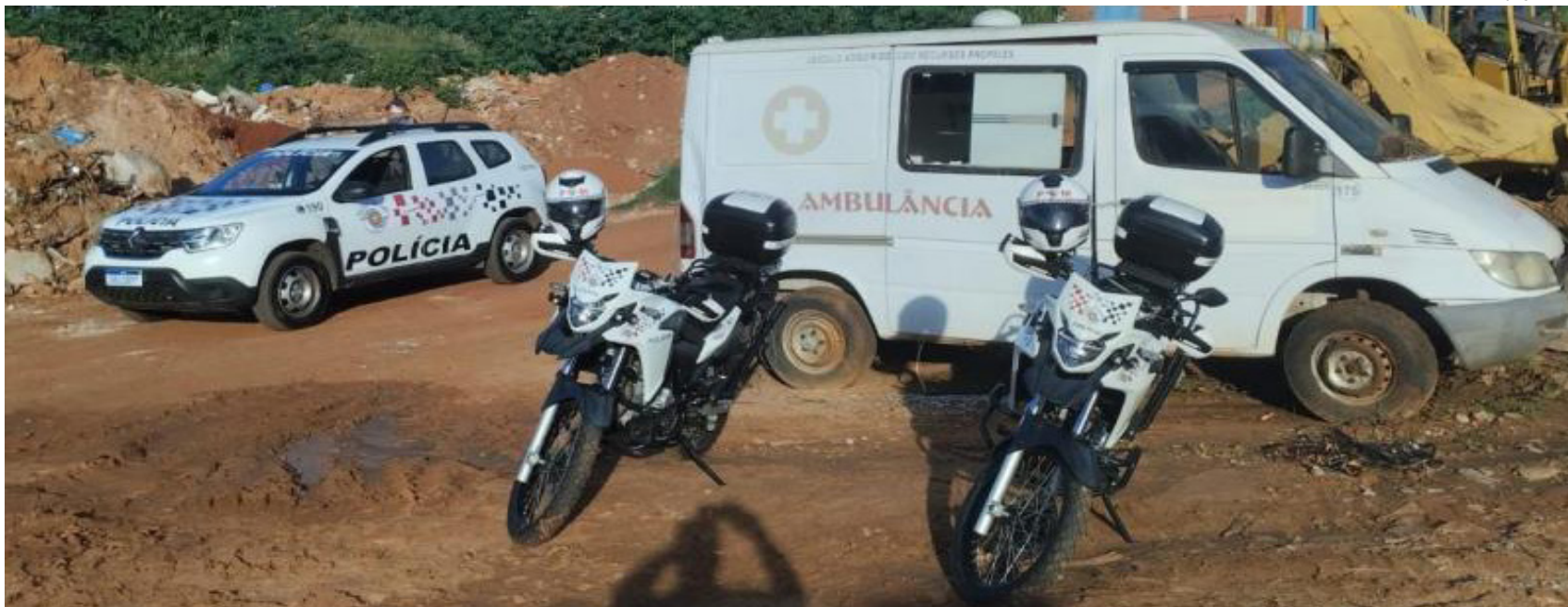
Homem danificou painel da ambulância para vender chicote elétrico