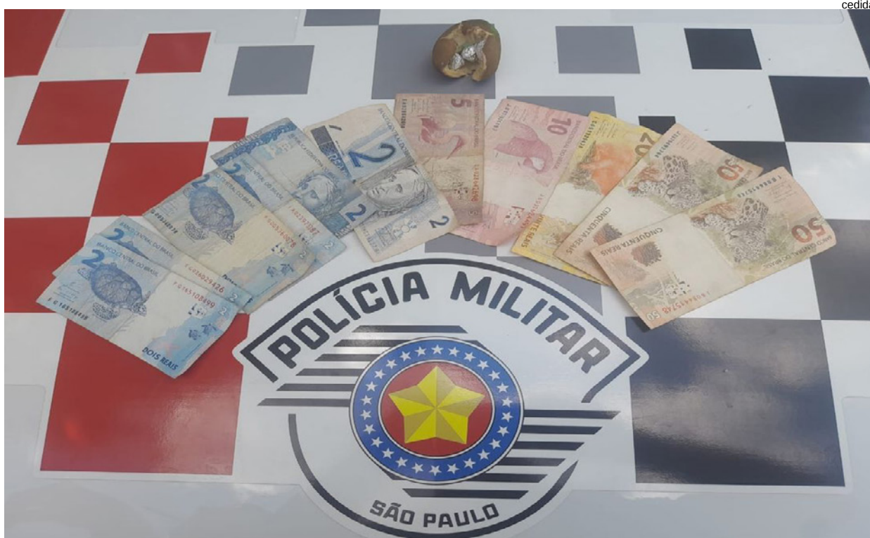
Dinheiro e porções de crack (entre o limão) encontrados com casal suspeito em Adamantina

Questionados novamente sobre a droga localizada, negaram os fatos, informando que nada sabiam sobre o entorpecente. A droga, dinheiro e o casal foram conduzidos ao Plantão de Polícia Judiciária de Adamantina, sendo confeccionado boletim de ocorrência de apreensão de substância entorpecente. O casal foi ouvido e liberado.