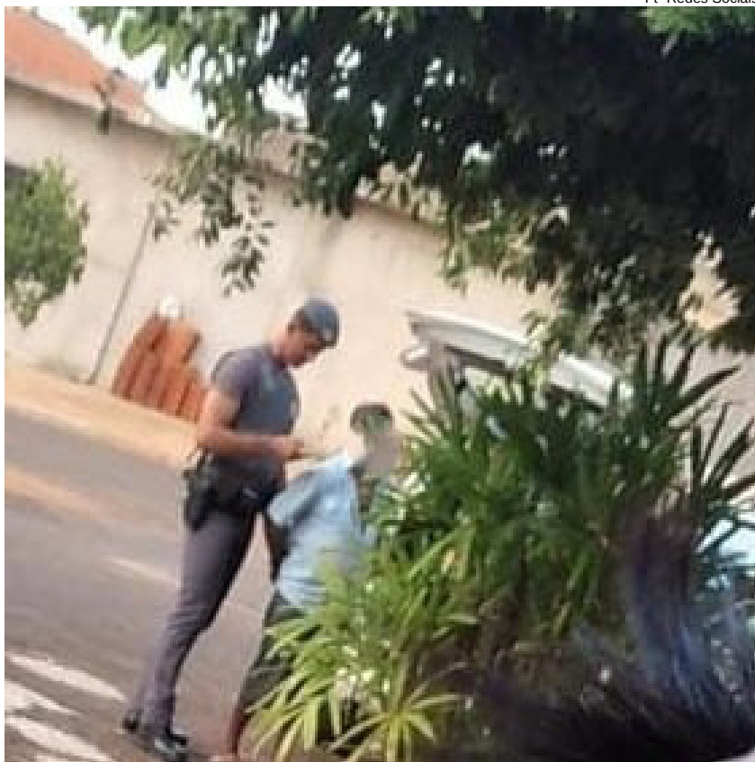
Homem acusado foi encontrado em uma residência em Paulicéia após denúncia