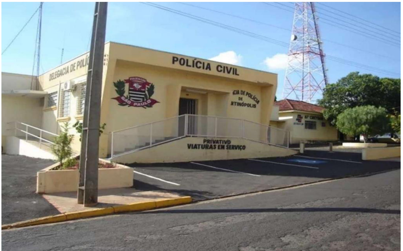
Delegacia de Polícia de Martinópolis