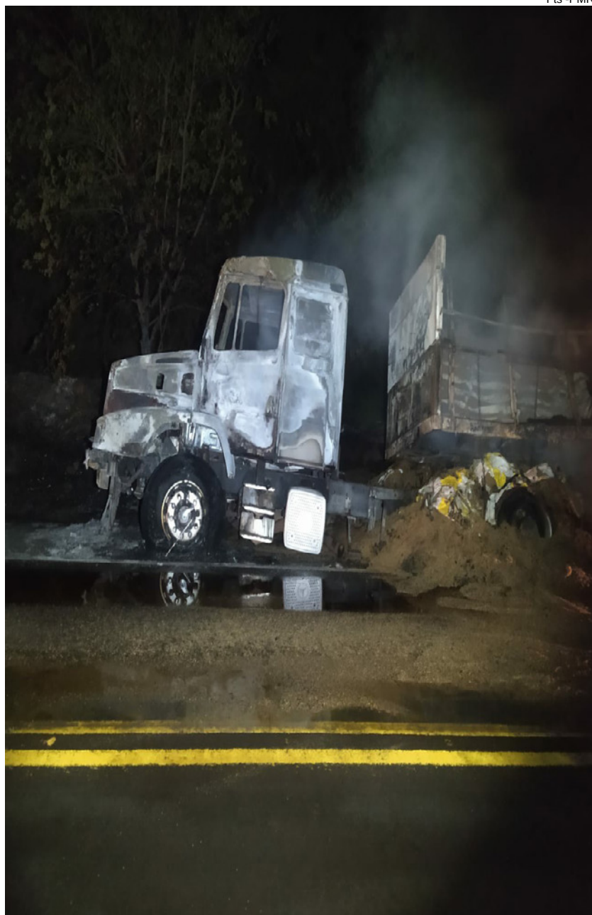
Caminhão e carga de ração bovina foram destruídos pelo incêndio

Paranapanema, quando foram tomados pelo fogo que teria iniciado em uma roda do eixo traseiro do caminhão trator.