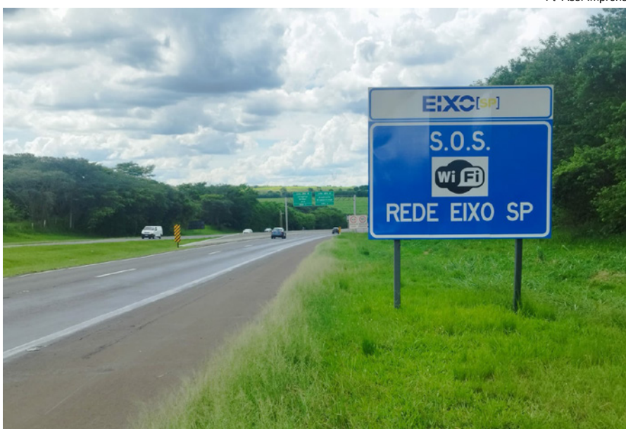
Tecnologia 5G está em operação nas rodovias da Eixo-SP que inclui a SP-294

de alta velocidade, os usuários podem realizar uma série de atividades, desde videochamadas com a equipe de Operações para obter informações ou suporte, até navegar na internet e utilizar aplicativos de streaming.