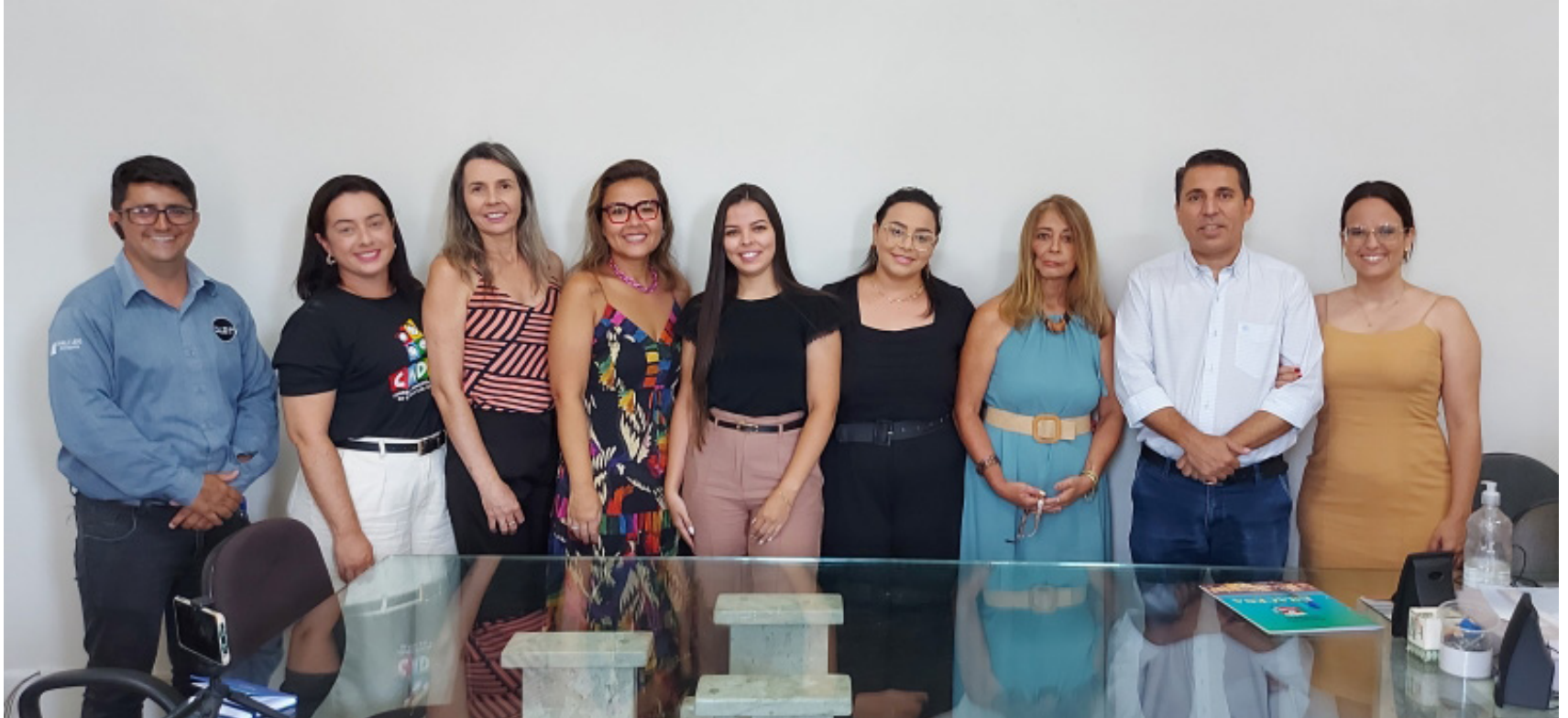
Prefeito André Lemos participa da cerimônia das assinaturas