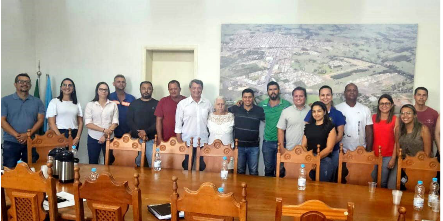
Prefeito Osmar (centro) e vice Rael anunciam índices de reajuste salarial para servidores municipais