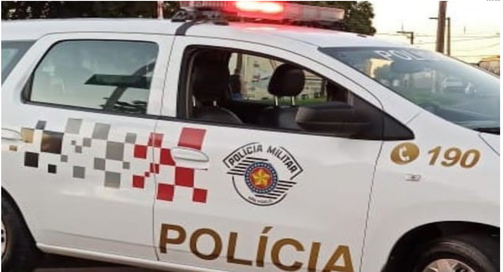
Homem foi preso pela PM no quintal da casa da filha