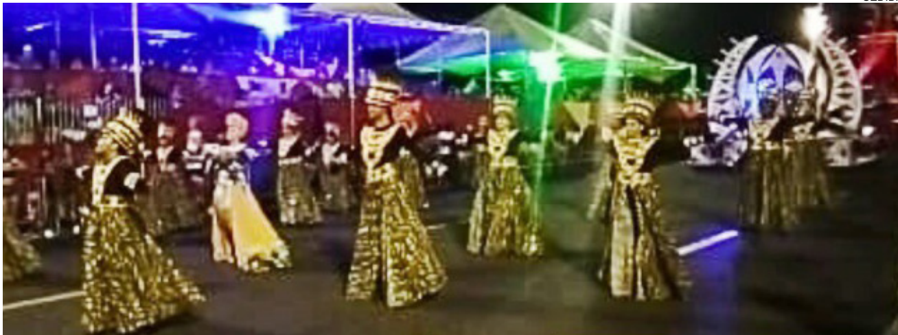
Unidos da Ribeira: campeã do carnaval de Presidente Epitácio