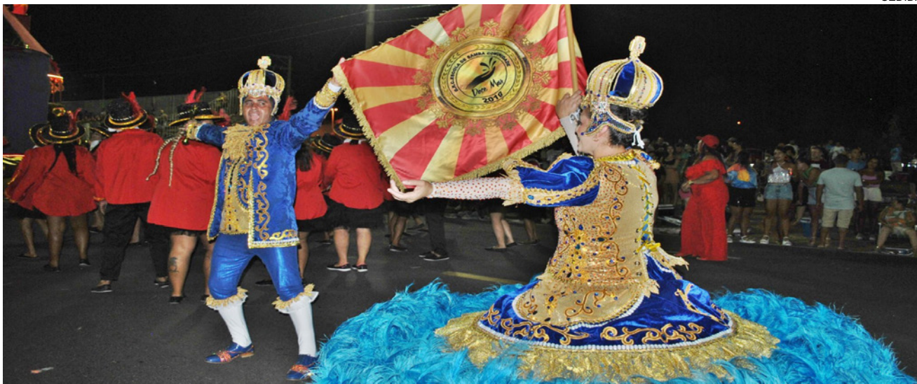
Vila Maria, vice-campeã