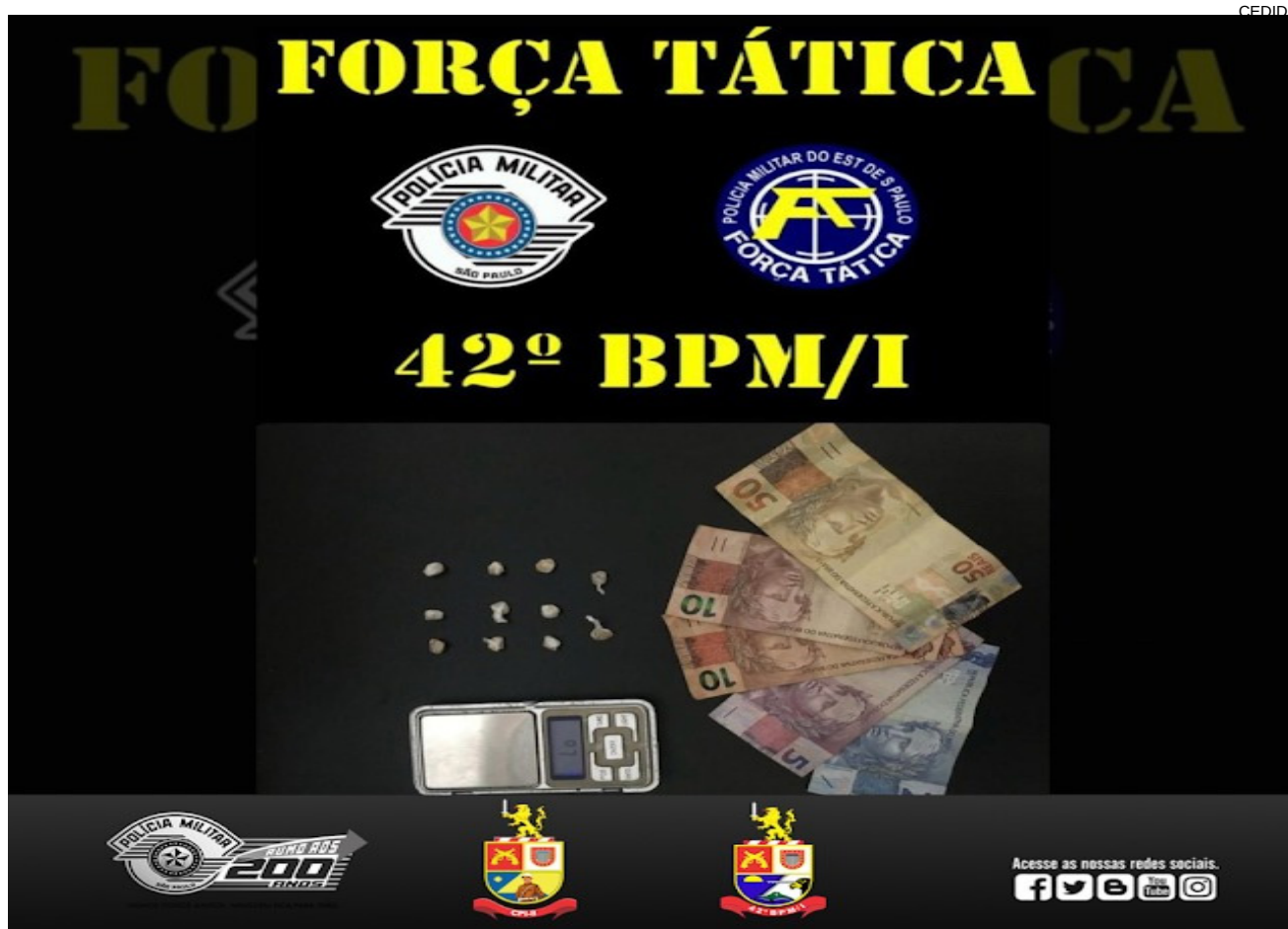
Porções de crack, balança de precisão e R$ 77 encontrados com o acusado