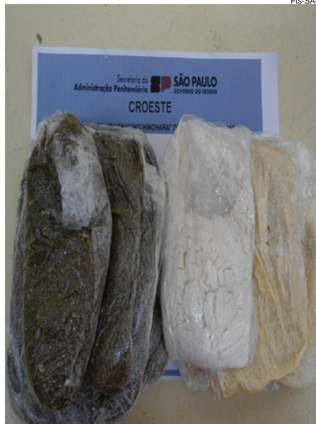
Penitenciária de Presidente Bernardes: apreensão de cocaína e maconha