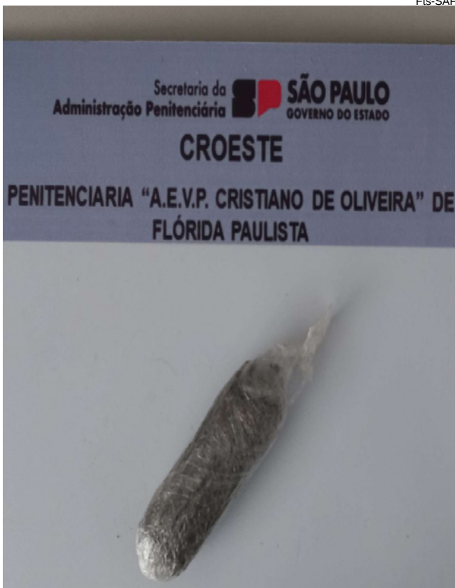
Penitenciária de Flórida Paulista: apreensão de maconha