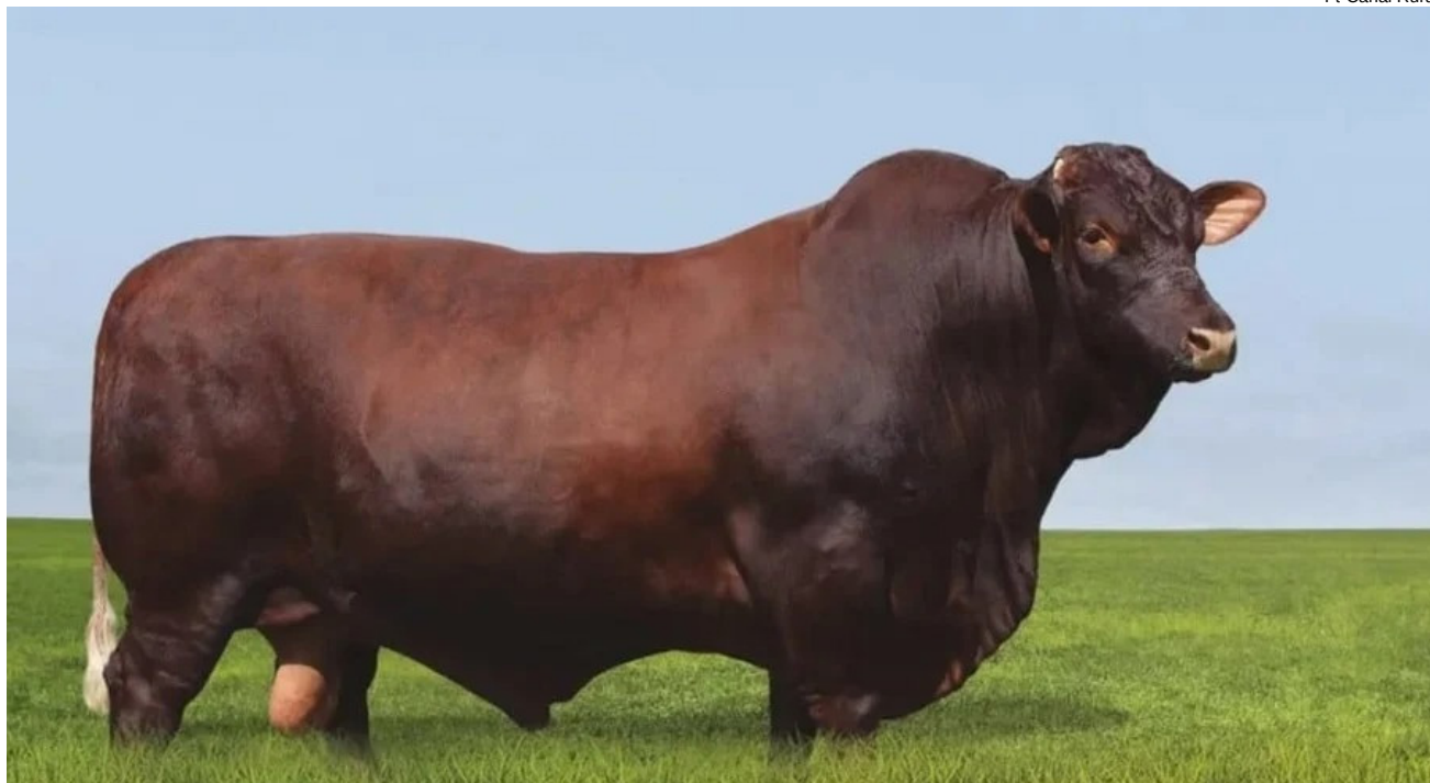
Reprodutor da raça santa gertrudis, Justus estava prestes a completar 12 anos de vida

de corte europeu na Central CRV, com uma notável produção de mais de 60 mil doses de sêmen.