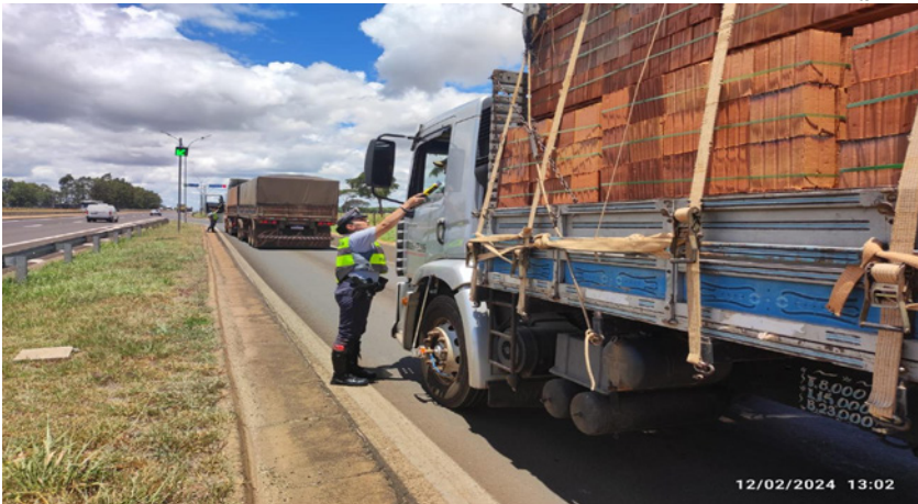
Fiscalização da PMR reforçada em rodovias 55 rodovias da região