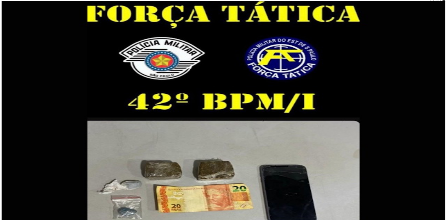
Porções de crack e maconha apreendidas, acusado foi encaminhado à Polícia Judiciária