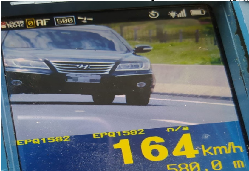
Veículo flagrado pelo radar com excesso de velocidade na região