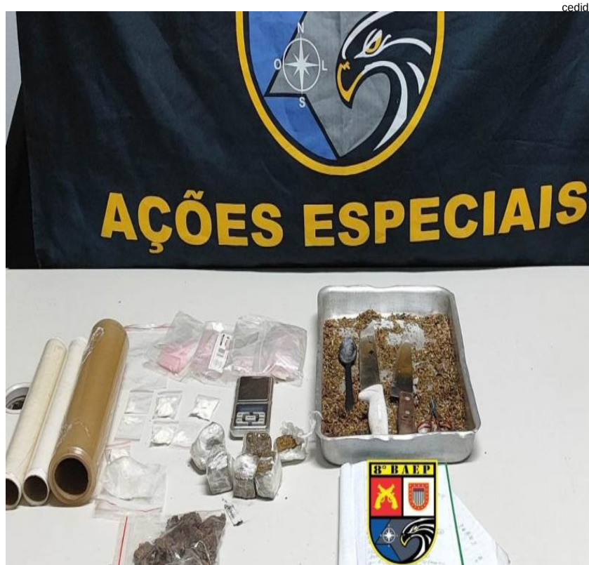
Maconha e cocaína apreendidas em Junqueirópolis