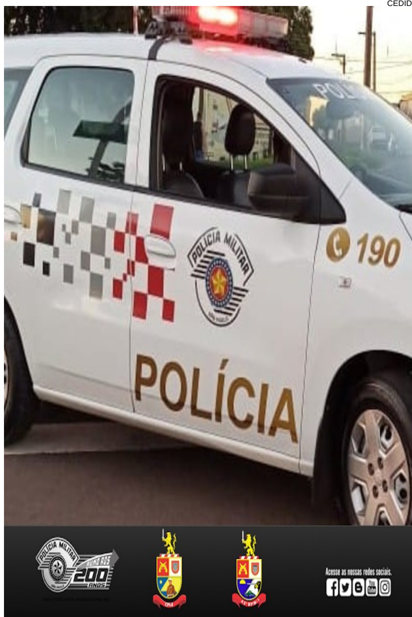
Homem preso pela PM alegou que usaria a foice para cortar galhos de árvore no quintal