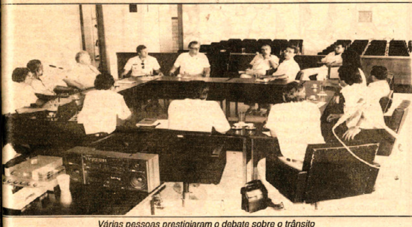
Várias pessoas prestigiaram o debate sobre o trânsito

Autoridades locais reunidas ontem na Câmara Municipal confirmaram que em breve será regulamentado o trânsito no centro da cidade, com proibição de tráfego de caminhões e fixação de horário para carga e descarga no comércio.