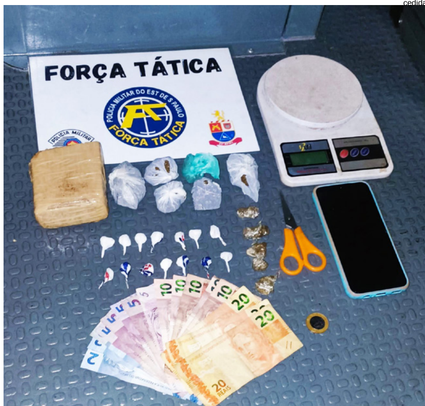
Drogas apreendidas em Presidente Prudente

Ocorrências distintas foram registradas com indivíduos flagrados com drogas após venderem porções a usuários