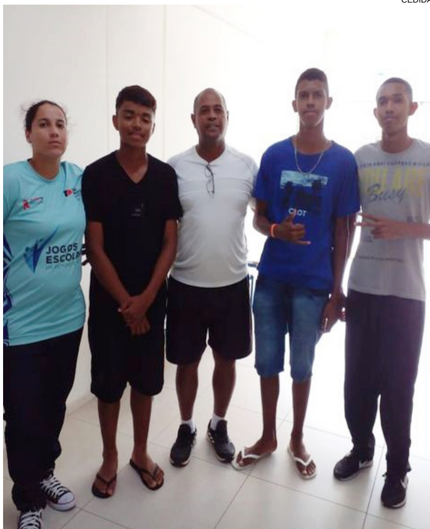
Alunos do projeto participam de avaliação em São Bernardo do Campo