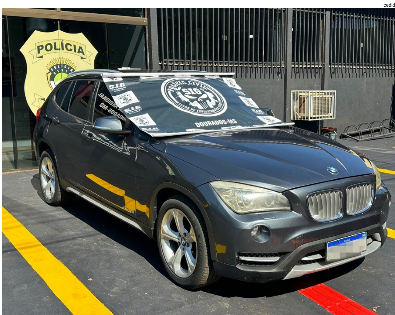
Veículo importado adquirido em Junqueirópolis foi recuperado