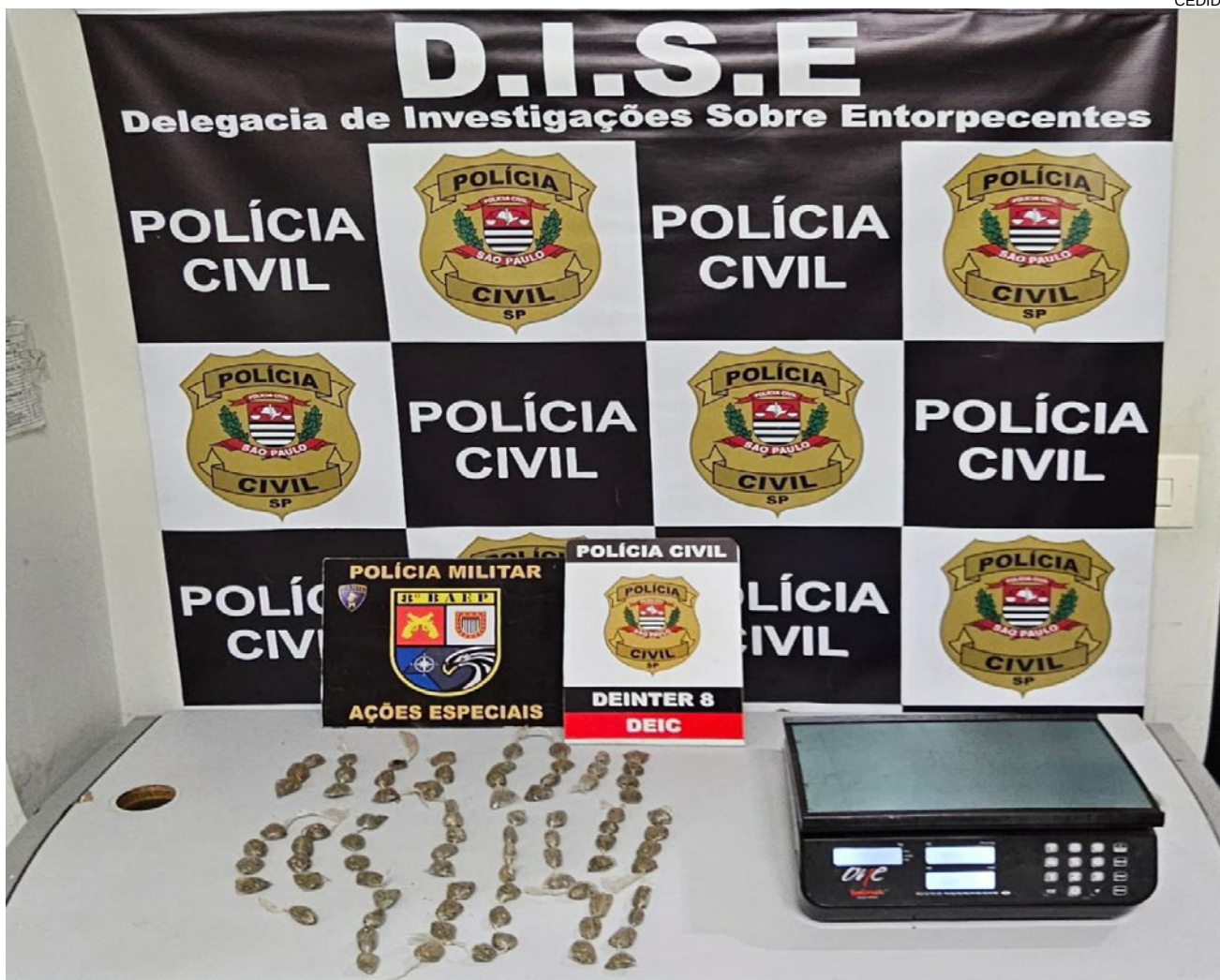
Drogas, celulares e balanças apreendidas na operação desta quinta-feira no Jardim Sabará, em Presidente Prudente