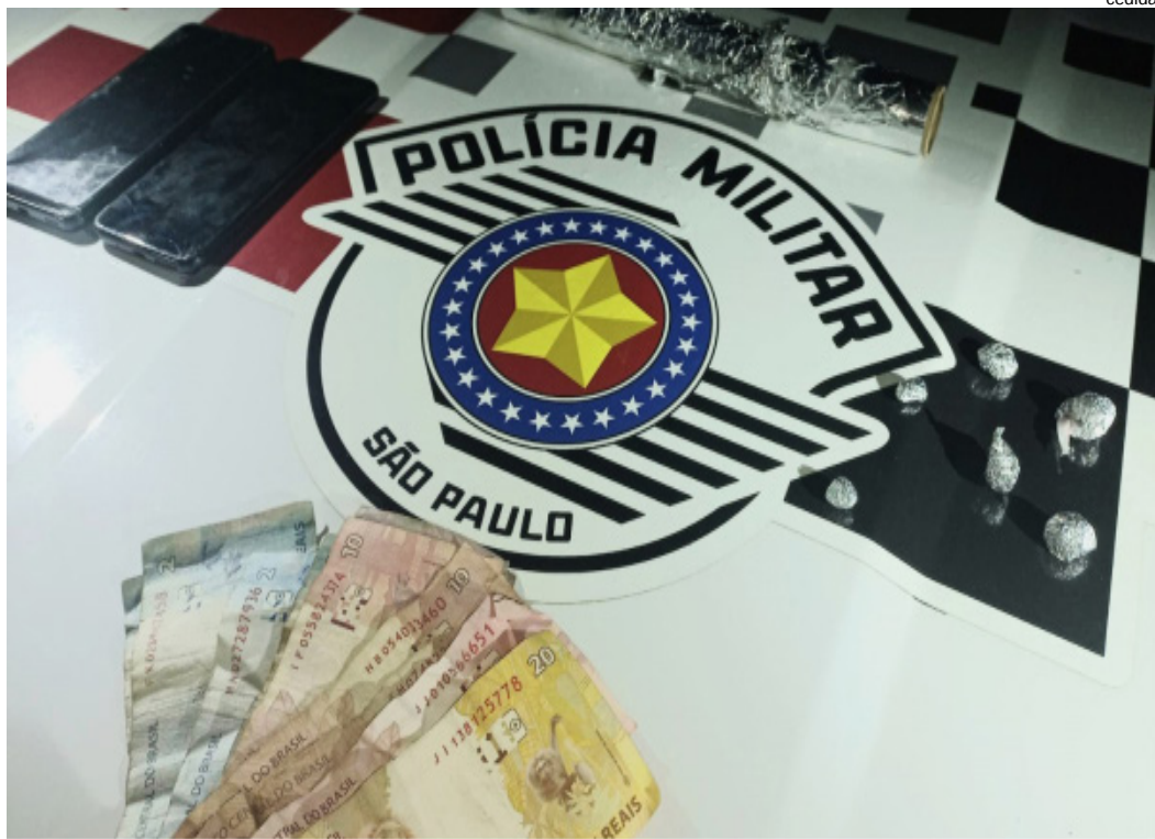
Drogas, celulares e dinheiro apreendidos com as mulheres