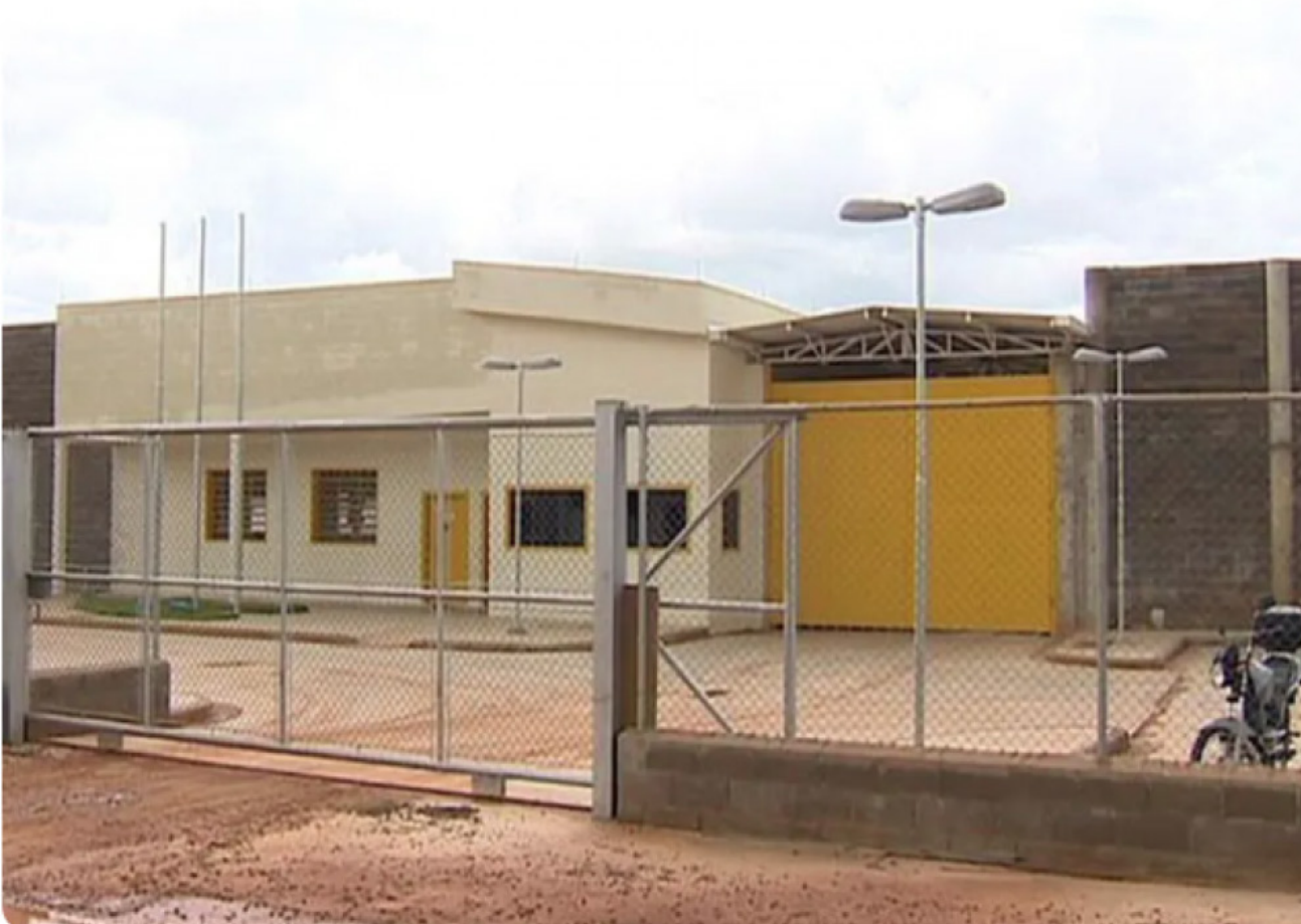
Fundação Casa de Presidente Bernardes, fechamento previsto para final de março

A unidade do centro socioeducativo da Fundação Casa localizada em Presidente Bernardes será fechada em março. Conforme o órgão, as atividades serão suspensas pois o local está operando abaixo da capacidade.