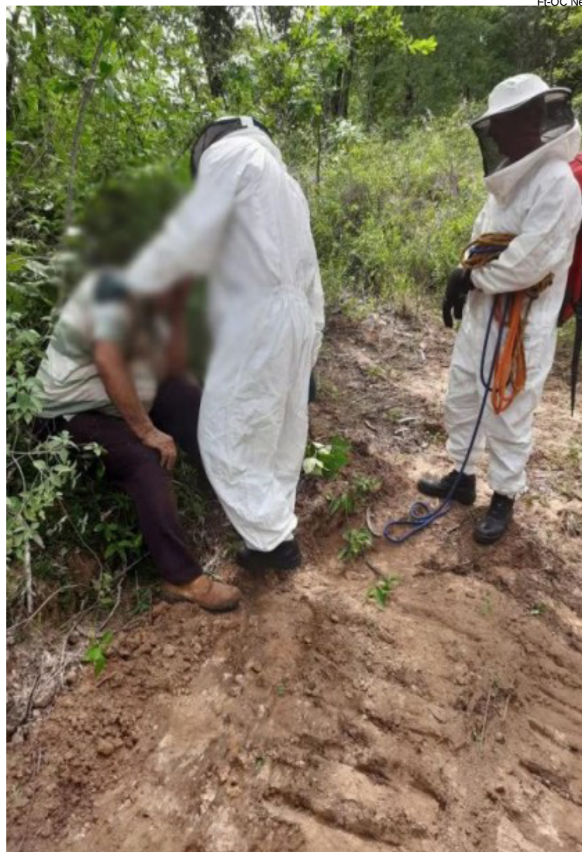
Vítima foi socorrida pelos bombeiros e encaminhada à santa casa de Tupã