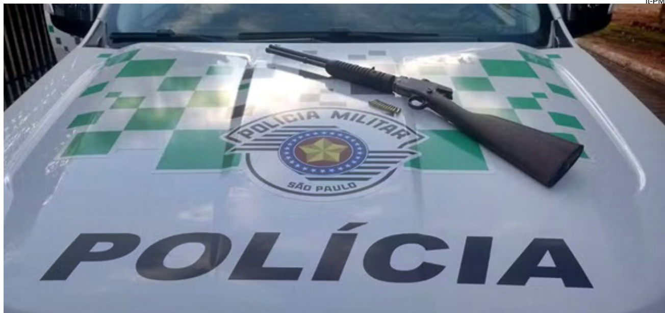
Espingarda calibre 22 e 12 munições intactas apreendidas no veículo do idoso