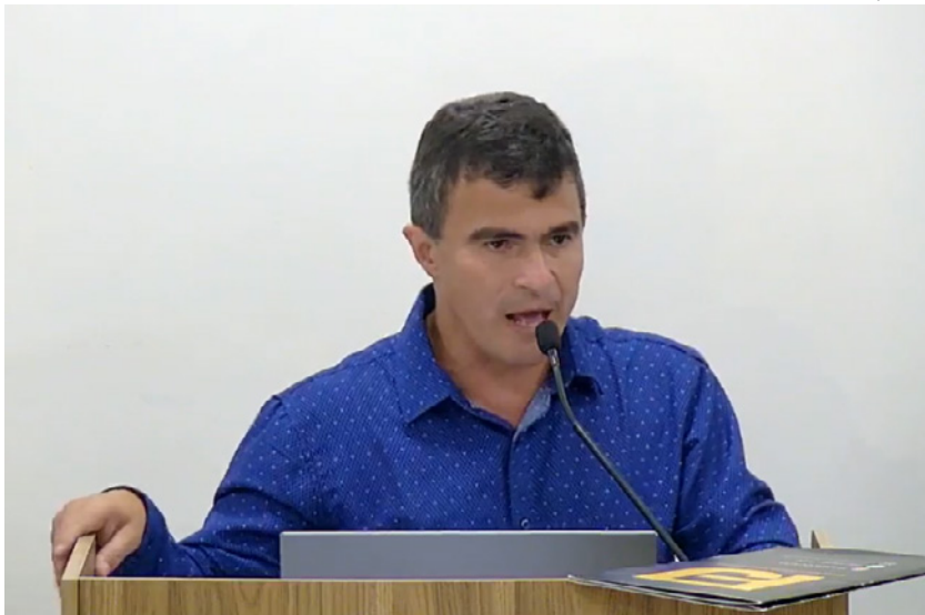
Prefeito Marco Antônio Jacomeli de Freitas (Republicanos), teve mandato cassado por 9 votos dos vereadores