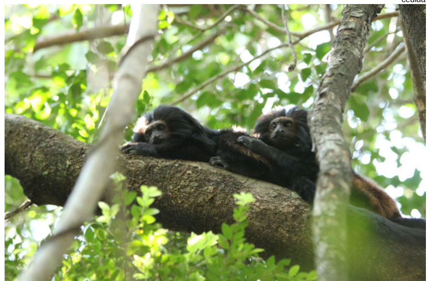
O mico-leão-preto, espécie símbolo do estado de São Paulo