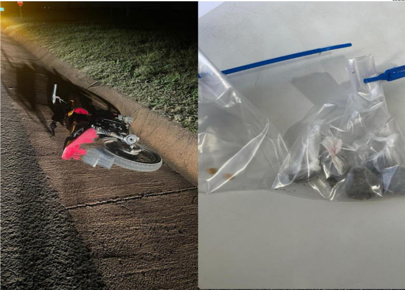
Moto furtada encontrada e porções de droga que estava com o maior de idade