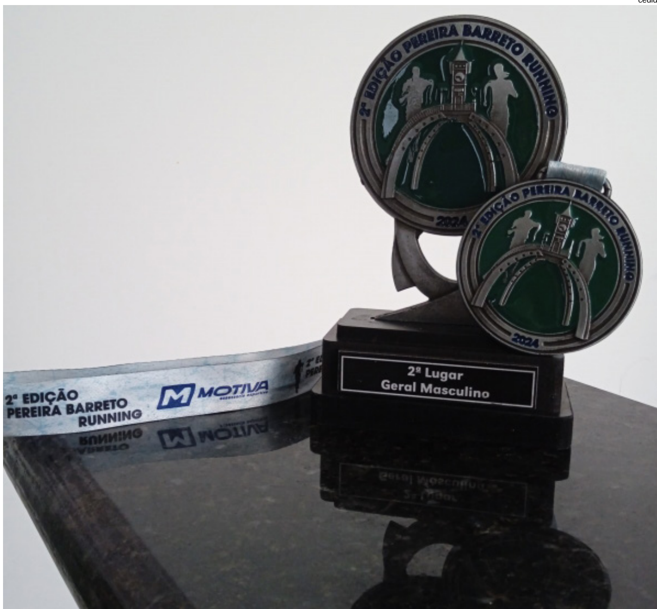
Atleta completou percurso em 16 minutos e 36 segundos