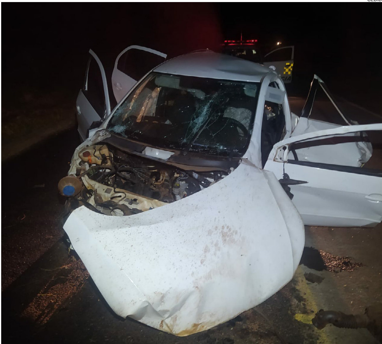
Veículo capotou após bater em barranco na estrada em Mirante do Paranapanema

O condutor recusou a realizar o teste de etilômetro, sendo autuado com base no artigo 165-A do CTB (recusar-se a ser submetido ao teste) e a ocorrência foi apresentada na Delegacia de Mirante do Paranapanema onde foi elaborado o boletim de ocorrência de homicídio culposo na direção de veículo automotor (Art. 302 do CTB) e o condutor seria ouvido posteriormente. A Polícia Científica realizou a perícia no local e no veículo. Não houve interdição do trânsito.