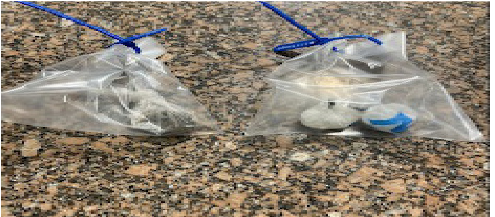
Cocaína apreendida com o procurado da Justiça em Presidente Venceslau