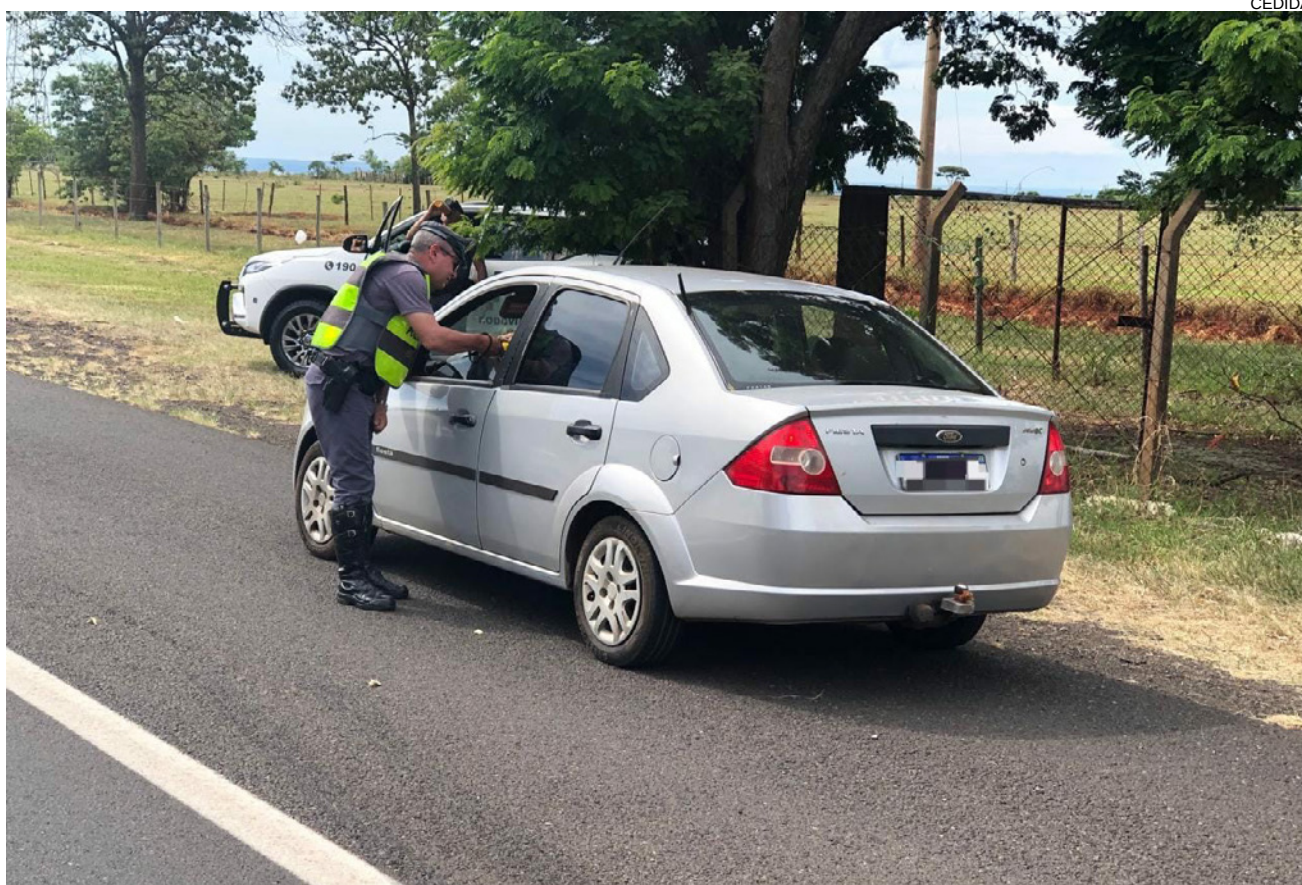
Operação Direção Segura, realizada sábado, na SP-270 em Presidente Epitácio

Destes, 12 condutores foram autuados por embriaguez ao volante e no total 26 autos de infração foram lavrados. A Operação foi realizada das 14h às 20h pela Polícia Militar Rodoviária (PMR) e Departamento Estadual de Trânsito (Detran-SP). A Direção Segura tem como objetivo repressão e combate à condução de veículo automotor por motoristas sob efeito de álcool.