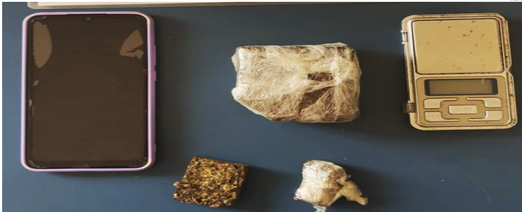
Droga e balança foram encontradas no interior de uma geladeira