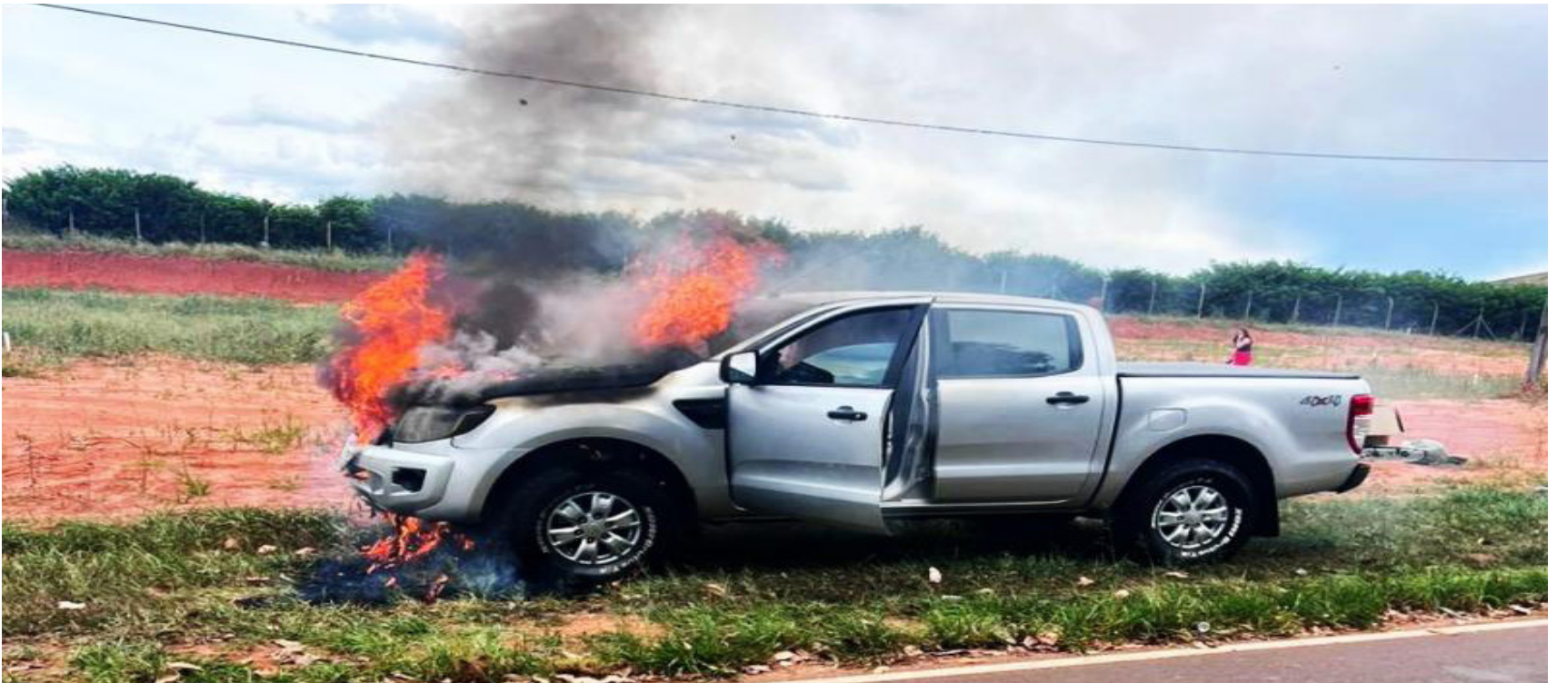
Caminhonete tomada pelo fogo na estrada entre Álvares Machado a Presidente Prudente ontem (7)