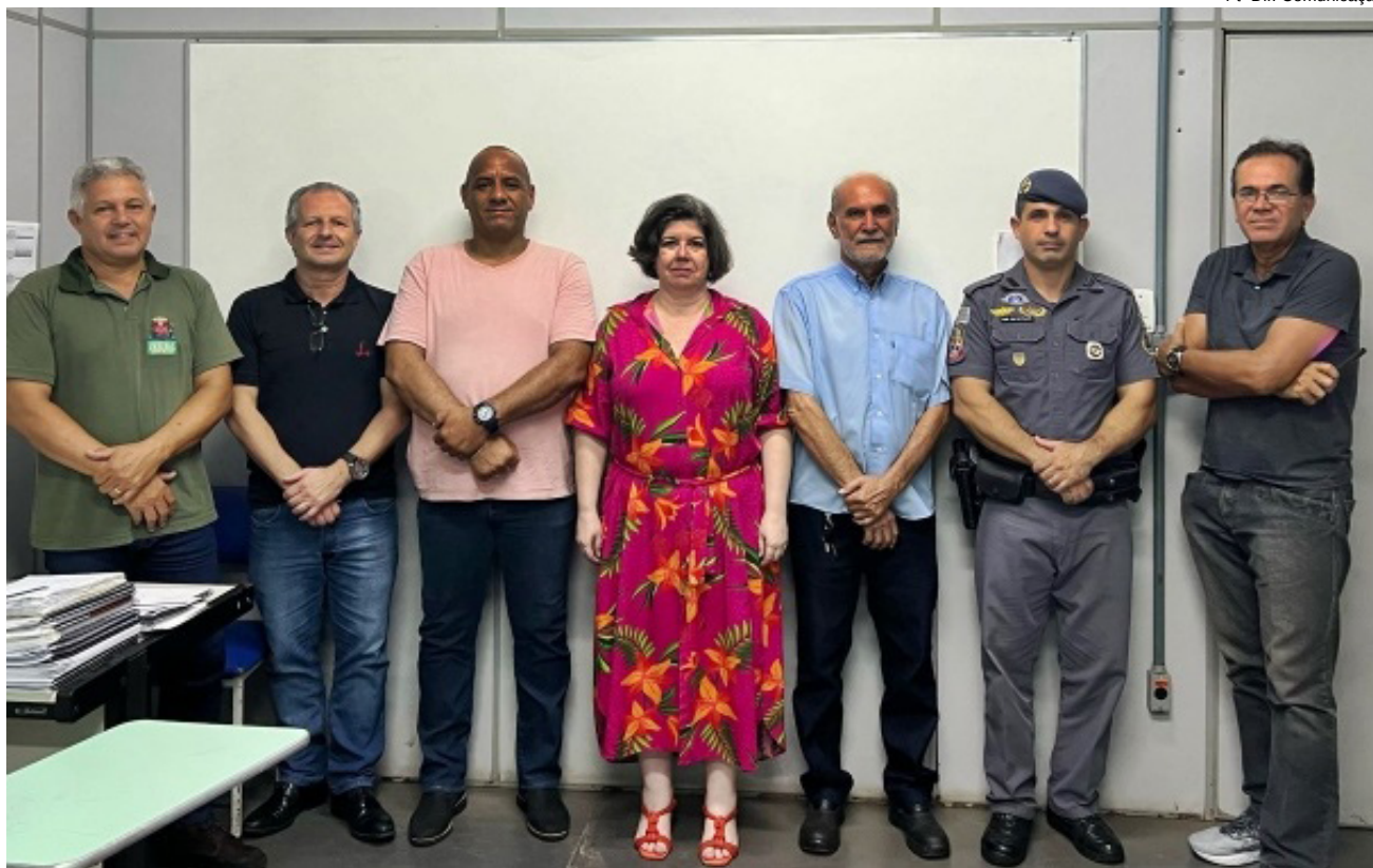
Integrantes do Comutra de Dracena