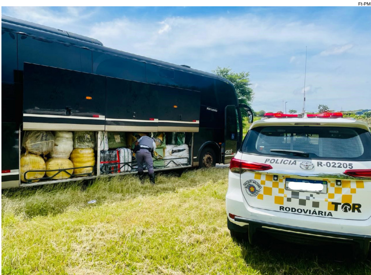
Produtos apreendidos no interior e porta-malas do ônibus com placas de São Paulo (SP)