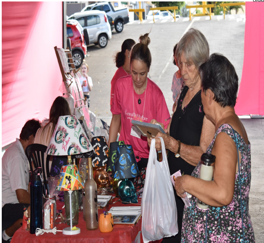
Novos espaços foram atrativos da edição de aniversário

A edição comemorativa contou ainda com diversas atrações culturais. "A pedido das empreendedoras fizemos em apenas um dia, mas estamos felizes com os resultados alcançados e mais do que isso, com a evolução das mulheres que estão conosco desde o começo e que tem atuado para fazer diferença no segmento em que atuam", afirma a secretária de Desenvolvimento