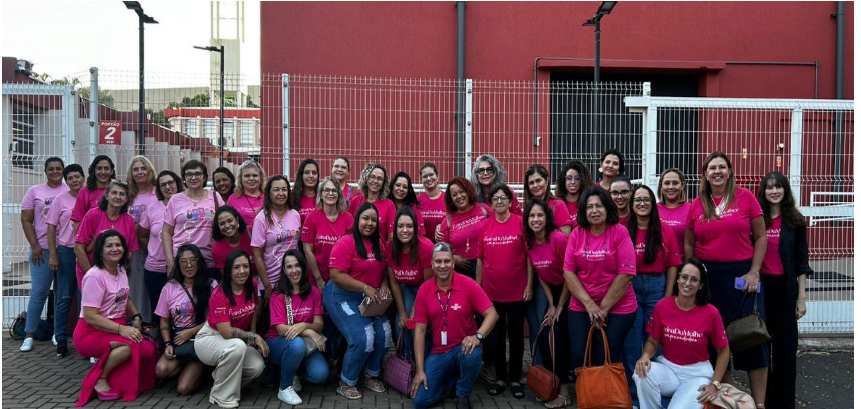
Mulheres do projeto “Feira da Mulher Empreendedora de Adamantina”, em Campinas