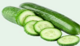
PEPINO JAPONÊS Kg