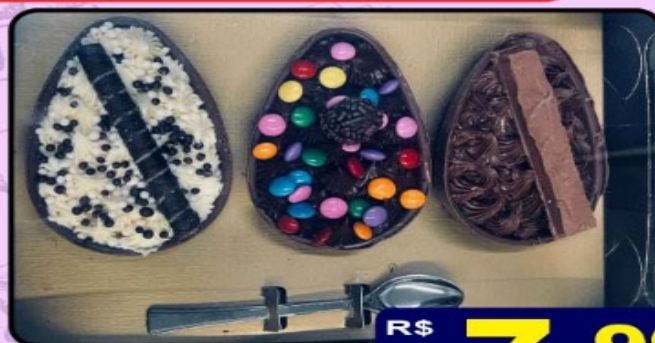
OVO DE COLHER cada 100g

DE: R$ 2,99 cada 100g POR: R$ 2,19 cada 100g