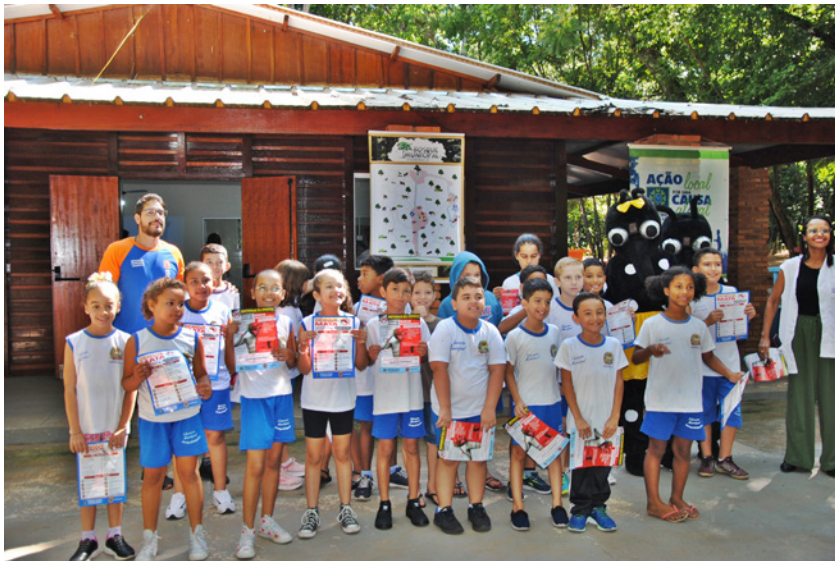
Palestra sobre prevenção da dengue deu início à Semana da Água