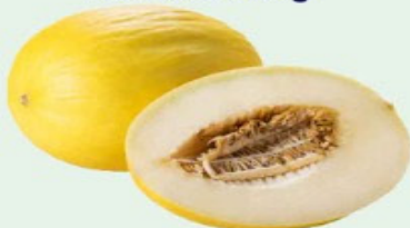
MELÃO AMARELO ESPANHOL Kg