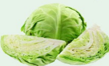
REPOLHO VERDE Kg