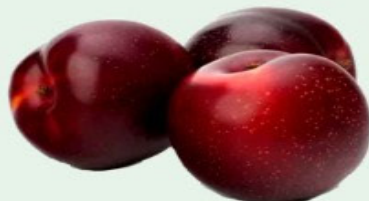
AMEIXA IMPORTADA Kg