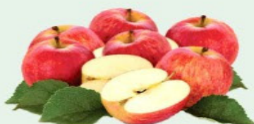
MAÇÃ GALA Kg