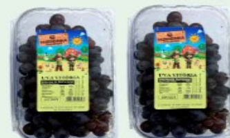
UVA VITÓRIA FAZENDINHA ÁGUA BRANCA 500g