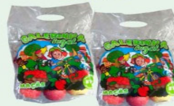
MAÇÃ GELERINHA LEGAL 810g PCT