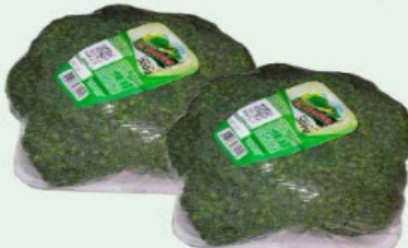
BRÓCOLIS NINJA 250g