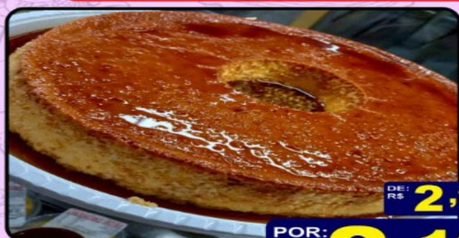
PUDIM DE LEITE CONDENSADO cada 100g

DE: R$ 2,99 cada 100g POR: R$ 2,19 cada 100g