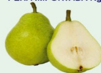
PERA IMPORTADA Kg