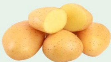
BATATA MONALISA Kg

Frutas, verduras, legumes, carnes e ofertas fresquinhas pra você.