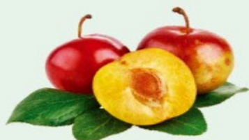
NECTARINA IMPORTADA Kg