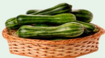
ABOBORA PAULISTA VERDE Kg