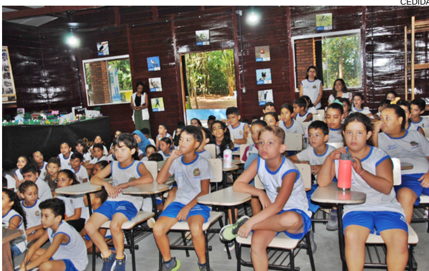
Alunos da Rede Municipal de Educação participaram da abertura