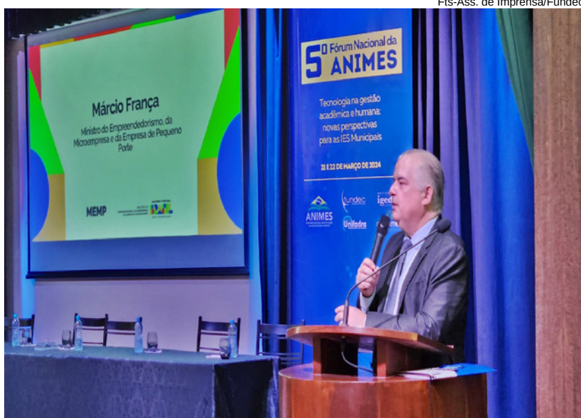
Ministro Márcio França ministra palestra no primeiro dia do evento