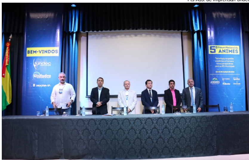
Cerimônia de abertura com presenças de autoridades e convidados