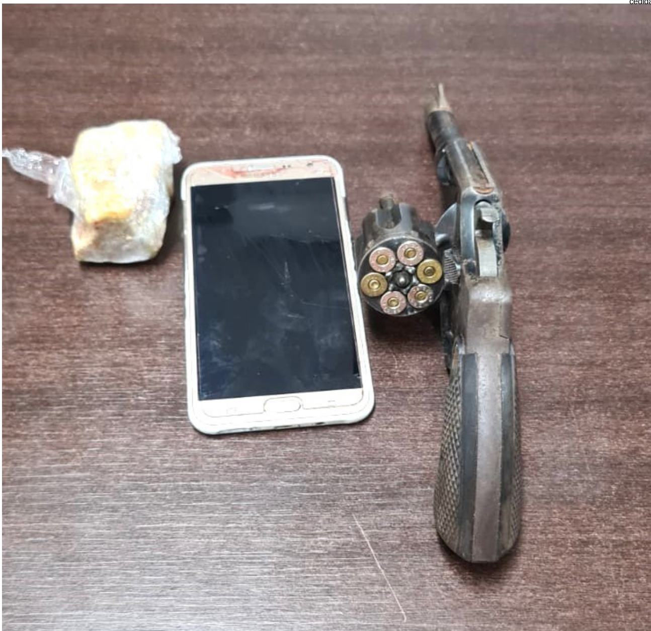
Revólver, munições e pedra de crack localizados com o suspeito morto

Ao se aproximarem do local, os oficiais foram alvo de disparo de arma de fogo. Neste momento, dois PMs efetuaram três tiros, cada, na direção ao indivíduo, que não pôde ser visualizado em função do espaço estar escuro.