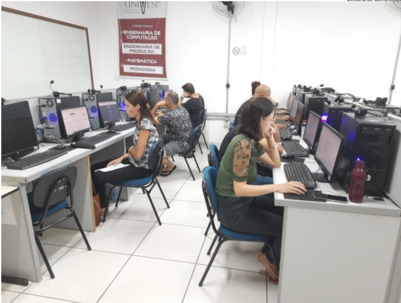
Diretoria de Comunicação

em 2024, há tempo. As inscrições estão abertas até 08 de abril de 2024, até as 21h, e devem ser realizadas através do site vestibular.univesp.br .