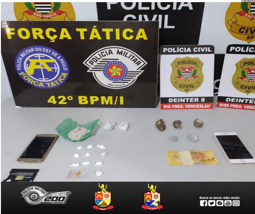
Trio é preso e por tráfico e drogas são apreendidas na casa