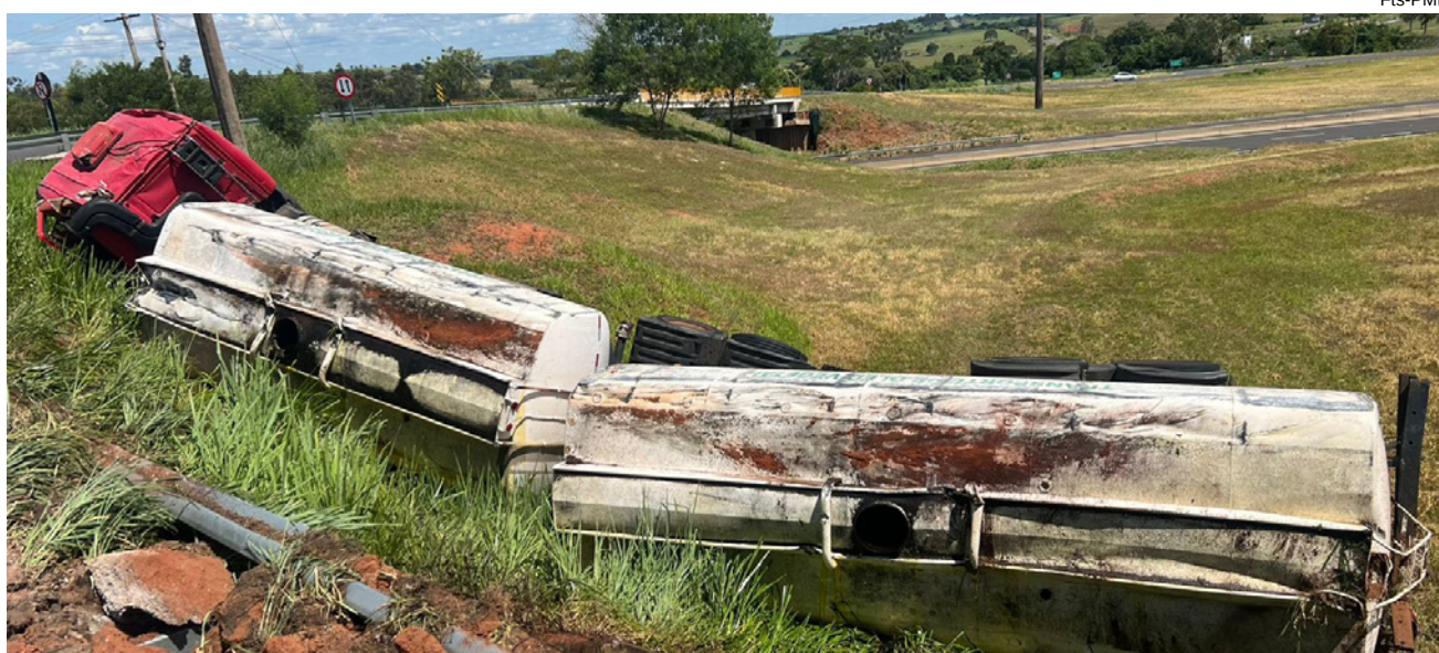
Carreta capotou na rotatória da rodovia existente no local