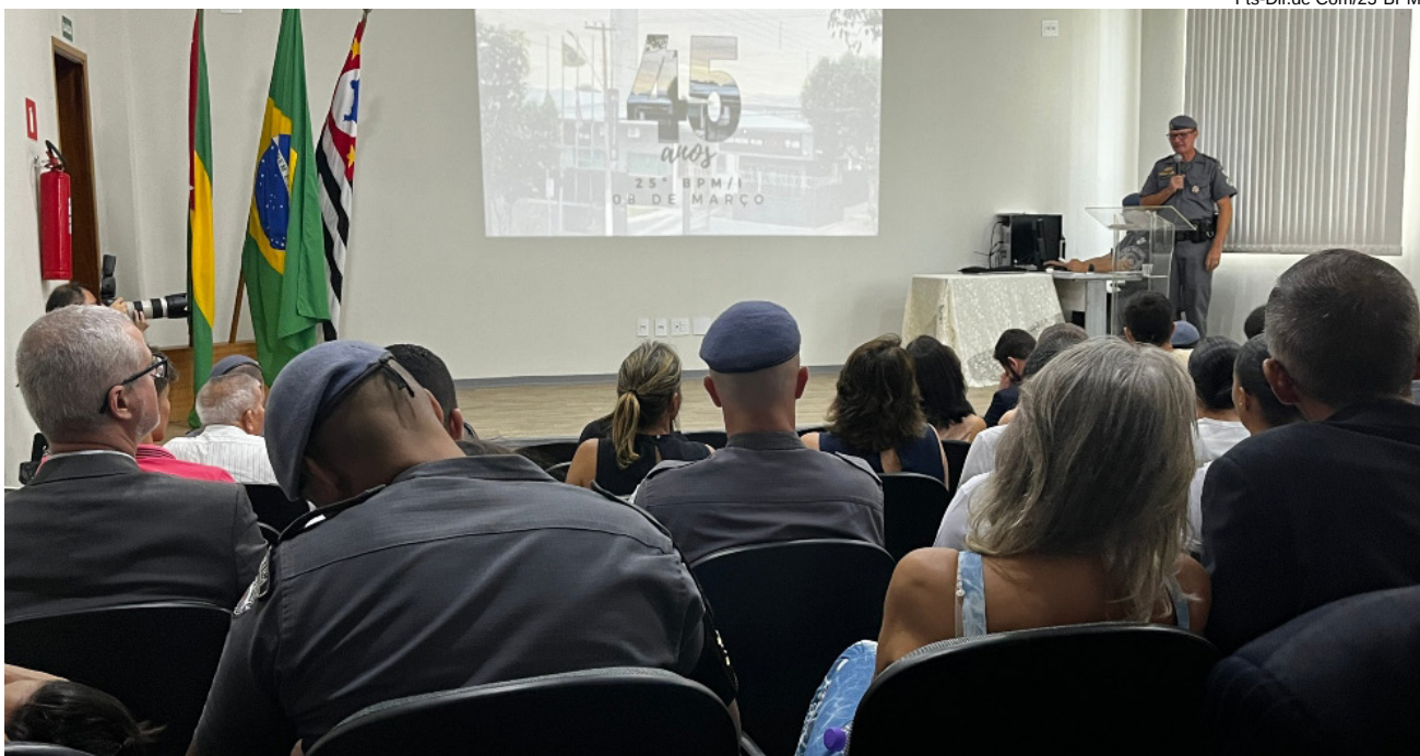
Prefeito André Lemos com autoridades do Legislativo, Judiciário e Militares do município