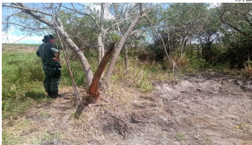
Vegetação nativa foi extraída na propriedade sem autorização de órgão ambiental