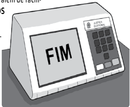
ILUSTRAÇÃO: MÔNICA LIE

L S P E S O C I E D A D E L S N N C B S C G Y A R B O T F T T L C T C E D U L A S H D O L I U A T F S E C R E T O G N R D B H C T T P C D C A N Y L E L E I T O R E S L C O C D R A E I D T D R M T N N M T R R N F V B G P E R N N I B I T F D T T R D D N D N E B N O S C T O D R S D N A N A L F A B E T O S D L I O E R N G Q S C P C A F N Y R L D E N N I D M F T A G U F N O B D P L E I T O T T T T E E D E C T E Y G V H D L L G T B E N N T I N D T L L O T D G O V E R N A N T E S F T C T C F E M M E H D N D C N T G T T F N L T O E E D Y E N S O I R A S E M S R E T N G D S