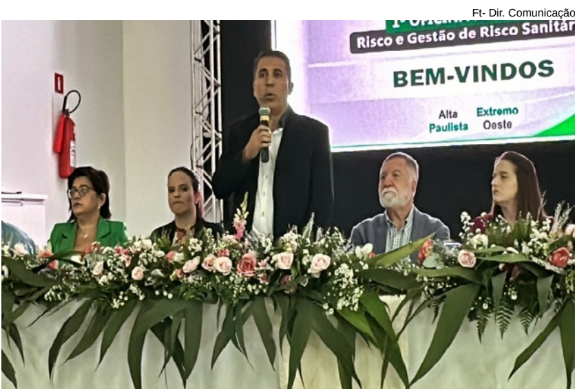
Parte do público presente