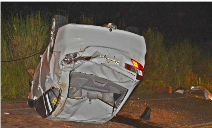
Três ocupantes com ferimentos leves foram socorridos à santa casa local