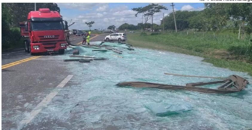
Vidros quebrados se esparramaram na rodovia