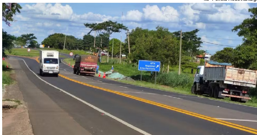
Caminhão com irregularidades foi apreendido