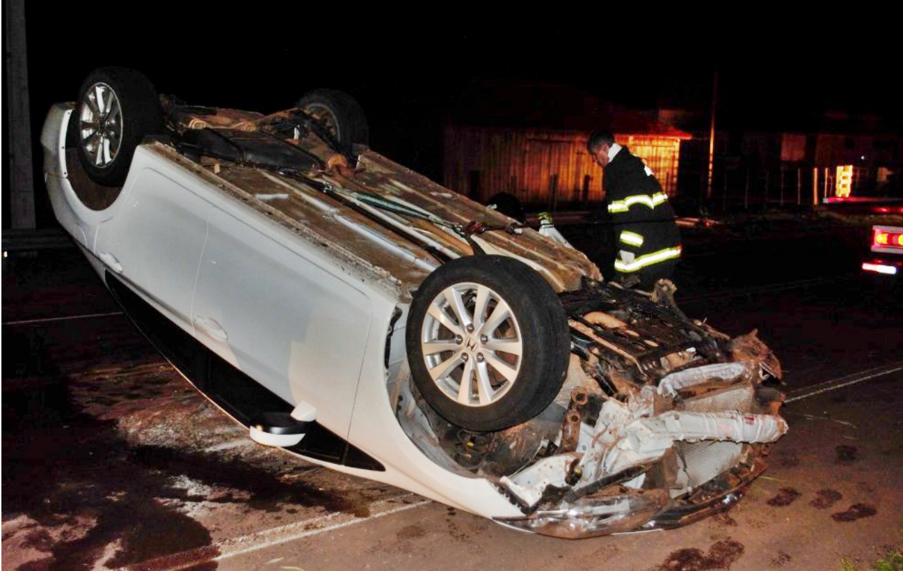
Capotamento ocorreu quando carro atingiu trecho da ponte da vicinal