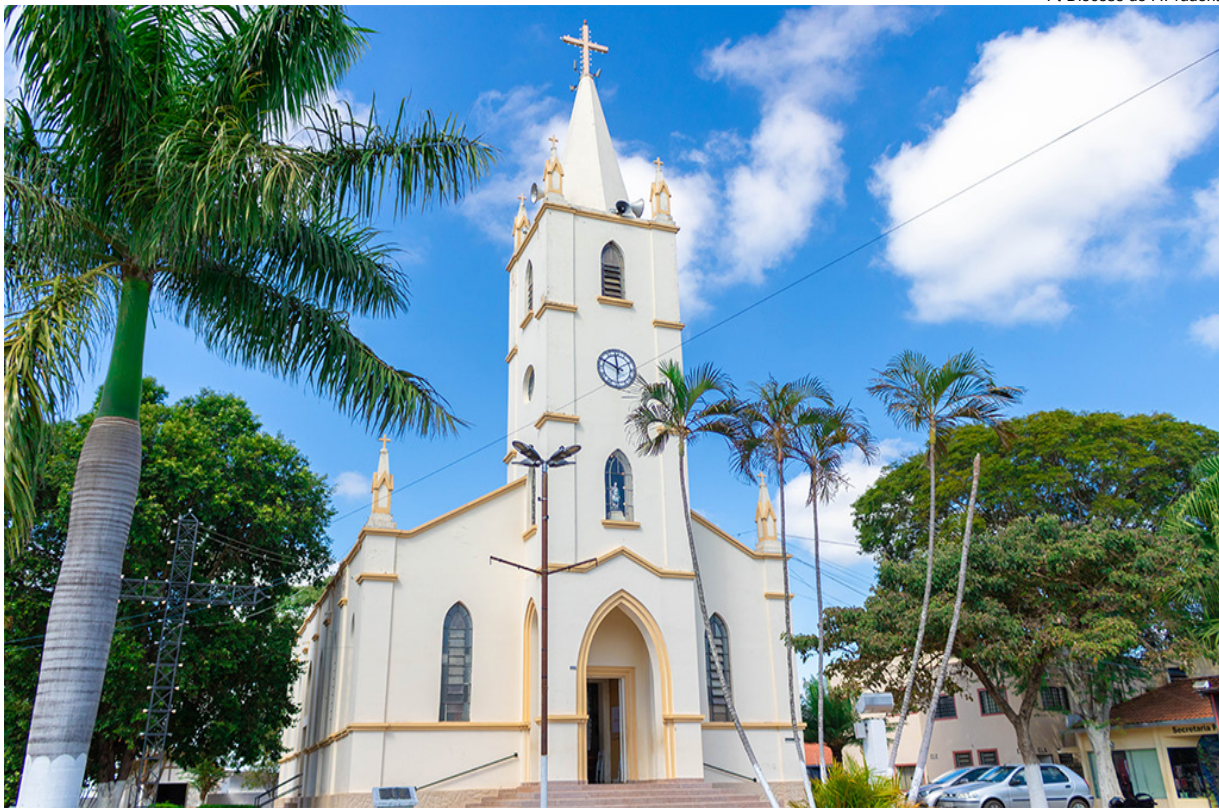
Igreja matriz de Santo Expedito: cidade espera milhares de romeiros