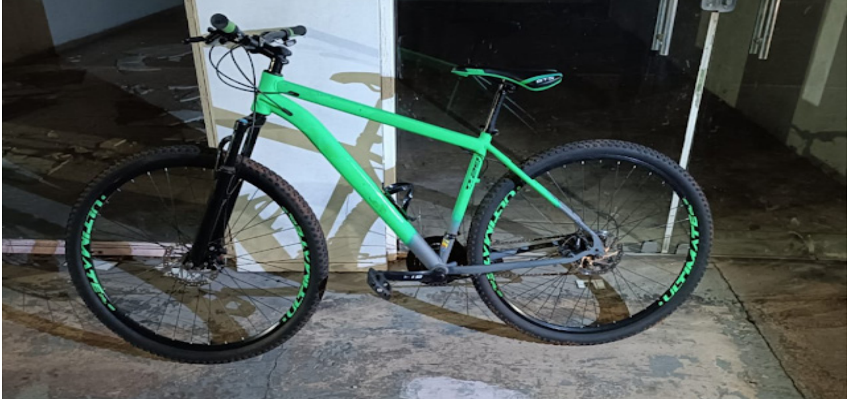
Bicicleta havia sido roubada domingo (14) na cidade