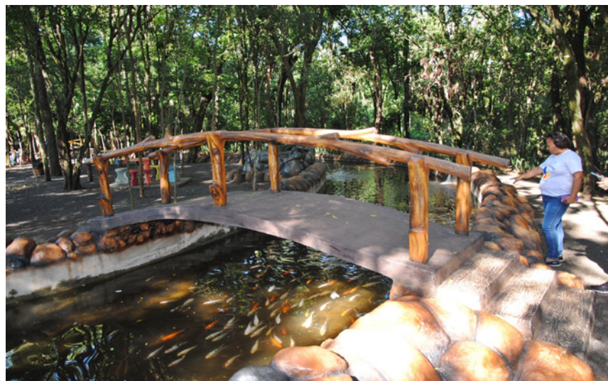
Lago foi restaurado e agora com peixes ornamentais