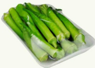
Quiabo Yuba 380g kg