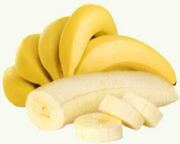
Banana nanica kg

Frutas, verduras, legumes, carnes e ofertas fresquinhas pra você.