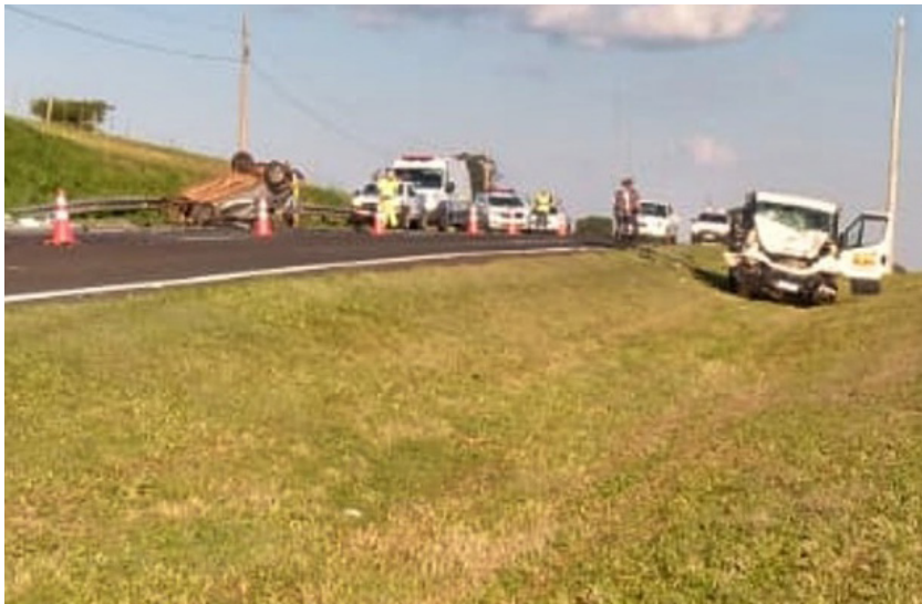
Um terceiro veículo foi atingido pelo motor do Kwid que se despreendeu

“Na sequência, o motor do Kwid despreendeu-se e foi arremessado sobre um terceiro veículo, um VW/Gol, com placas de Campinas, que estava logo atrás da caminhonete e que também seguia para Presidente Prudente”, acrescentou a Polícia Rodoviária.