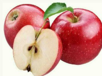
Maçã Fuji kg