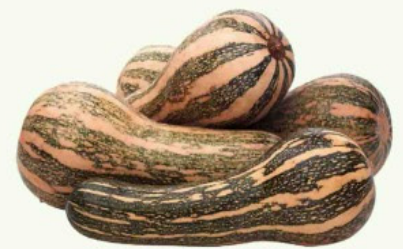
Abobora Paulista Madura kg