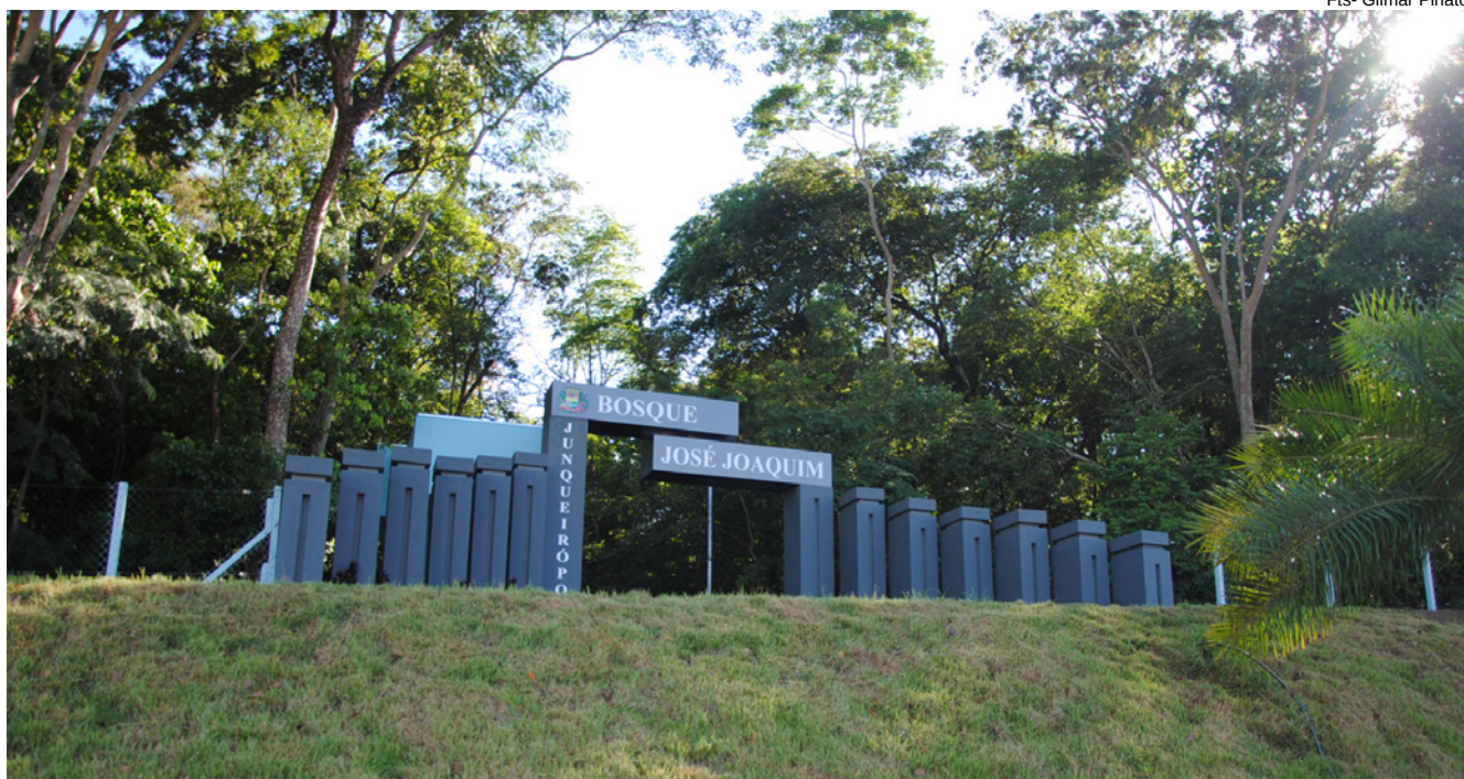
Localizado a 1,7 km da zona urbana, bosque é aberto à visitação

Possui 5,6 hectares de fragmentos da floresta de Mata Atlântica