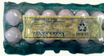
Ovos Pães C/12 Branco Grande