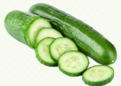
Pepino Japones kg