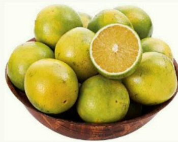
Laranja Pera Rio kg