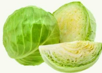
Repolho Verde kg