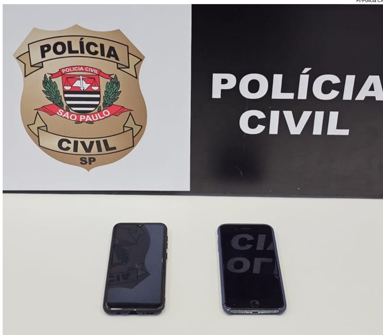
Aparelhos celulares apreendidos para identificar o cibercrime na região

A Polícia Civil reafirma seu compromisso com o combate à criminalidade em todas as suas formas, incluindo o cibercrime.