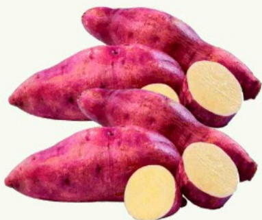
Batata Doce kg