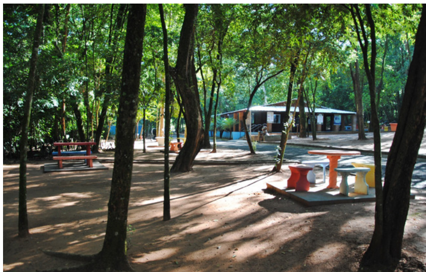
Bosque Municipal: opção de lazer e educação ambiental