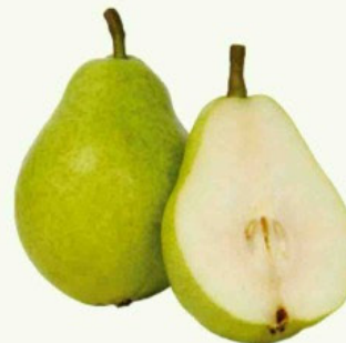
Pera Importada kg