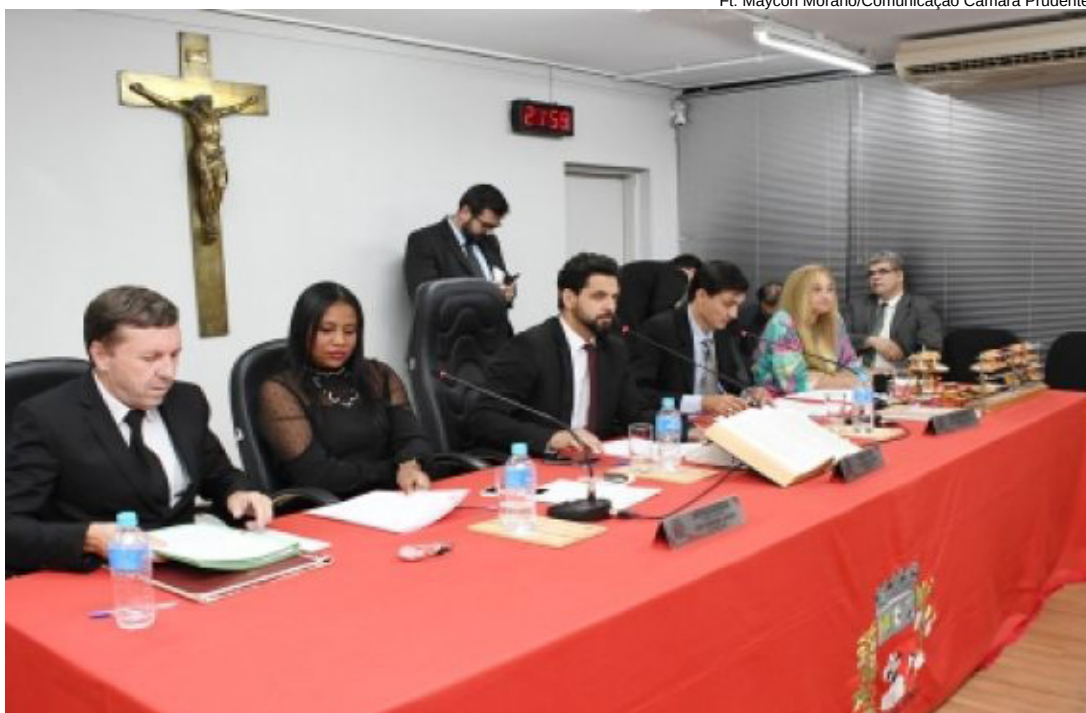
Sessão da Câmara que votou contra pedido de cassação