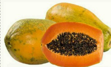
Mamão Formosa kg