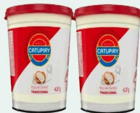
REQUEIJÃO CATUPIRY TRAD. 420g