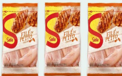
FILE DE PEITO FRANGO SADIA 1Kg PACOTE