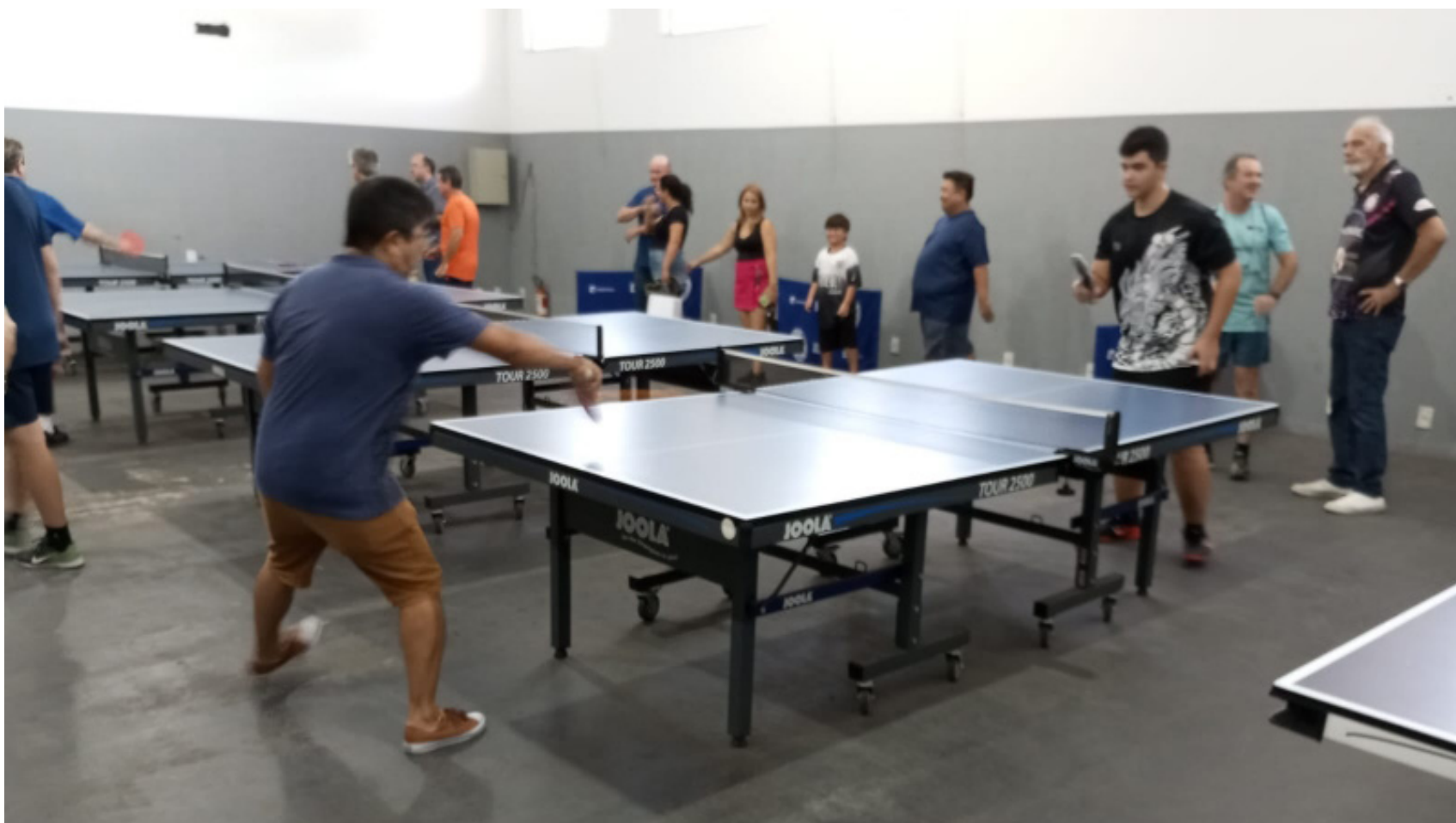
Prefeito André Lemos durante pronunciamento na solenidade