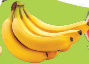
Banana Nanica kg