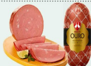
MORTADELA PERDIGÃO OURO DEFUMADA CADA 100g