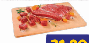
Capa Coxão Mole Bovino Vácuo kg