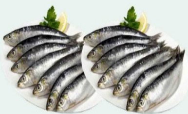
SARDINHA INTEIRA À GRANEL Kg