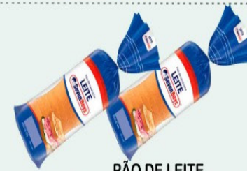
PÃO DE LEITE SEVEN BOYS 450g PACOTE