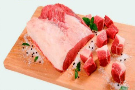
PONTA DE PEITO SEM OSSO Kg