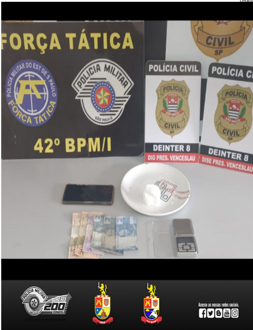
Suspeito foi abordado no quintal de sua casa, onde a droga foi encontrada