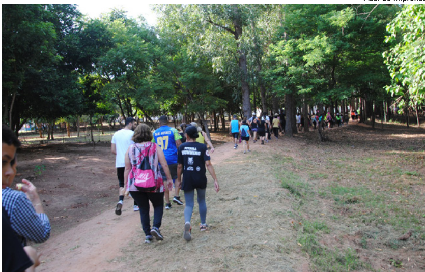
Percurso foi feito nos bairros e parques ecológicos