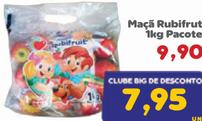
Maçã Rubifrut 1kg Pacote