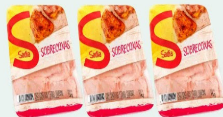
SOBRECOXA FRANGO SADIA 1Kg BANDEJA