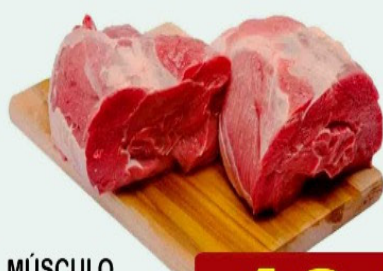
MÚSCULO DIANTEIRO Kg