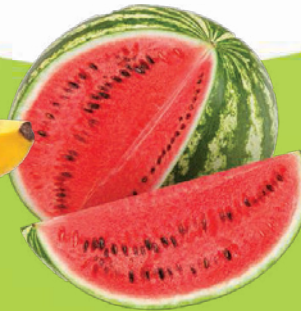
Melancia Inteira kg