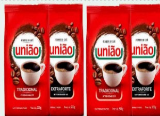
CAFÉ UNIÃO 500g PCT "TRAD./EXTRA FORTE