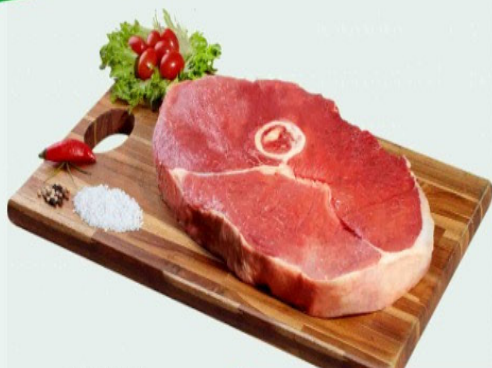
CORTE AMERICANO DA PALETA Kg

Frutas, verduras, legumes, carnes e ofertas fresquinhas pra você.