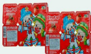
IOGURTE FRUTAP 360g BANDEJA PATATI PATATA MORANGO