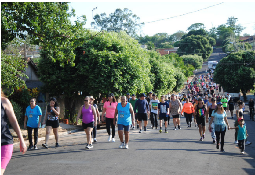
Centenas de pessoas participaram da caminhada