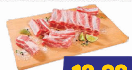
Costelinha Suína kg