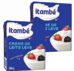
Creme de Leite Itambé TP 200g