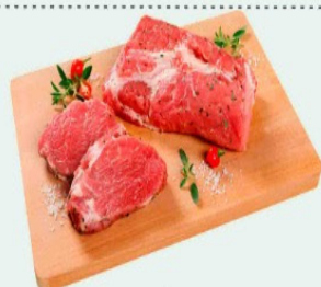
COPA LOMBO SUÍNO SEM OSSO Kg