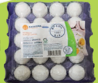
Ovos Katayama PVC Branco C/20 Grande