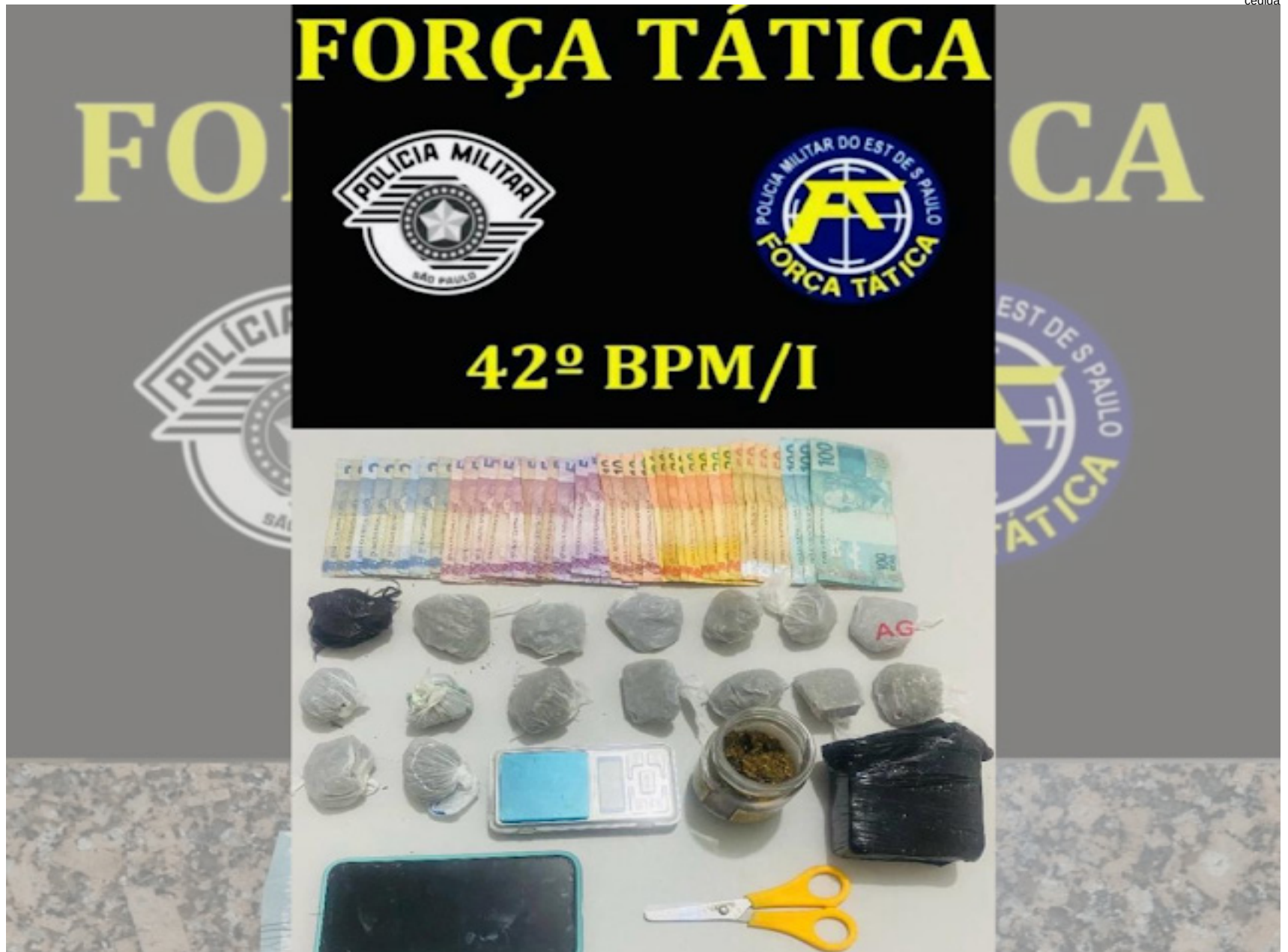
Porções da droga, dinheiro, celular e balança de precisão apreendidos