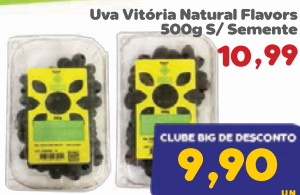
Uva Vitória Natural Flavors 500g S/ Semente