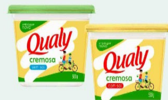
MARGARINA QUALY 500g COM E SEM SAL POTE