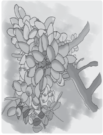
ILUSTRAÇÃO: LUZIMAR LAINES

Da família das anacardiáceas, o pistache é uma semente OLEAGINOSA originária da ÁSIA Central. No mundo todo, essas AMÊNDOAS são muito consumidas, sob a forma TORRADA e salgada, como tira-gosto ou PETISCO . Além disso, fazem parte da CULINÁRIA de diversos países, sendo usadas na preparação de SOBREMESAS , chocolates, batidas e saladas. Os maiores produtores de PISTACHE são Irã, Turquia, Estados Unidos (especialmente a Califórnia), Tunísia, SÍRIA e China. No Brasil, não existe PLANTIO comercial desse fruto, mas é fácil encontrá-lo em MERCADOS e mercearias, que o compram do EXTERIOR . O pistache possui alto valor NUTRITIVO , incluindo vitaminas A, B-1, B-6 e E, e sais MINERAIS como ferro, magnésio, potássio, cobre, fósforo, SELÊNIO e zinco. É um alimento que, entre outros benefícios, ajuda a reduzir o COLESTEROL ruim (LDL) e aumentar o bom (HDL), tem EFEITO anti-inflamatório e antioxidante e auxilia o trabalho da corrente SANGUÍNEA .