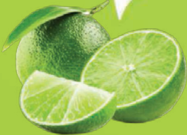
Limão Taiti kg