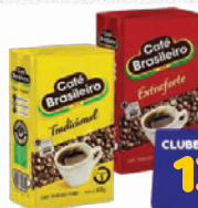
Café Brasileiro 500g