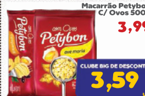
Macarrão Petybon C/ Ovos 500g