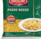
Macarrão Basilar Semolado 400g Exceto Ninho