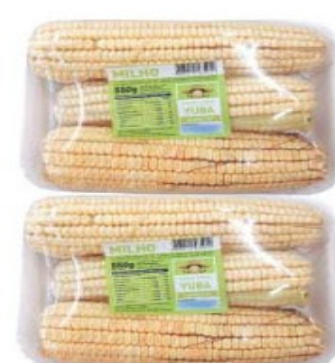
MILHO VERDE YUBA 550g