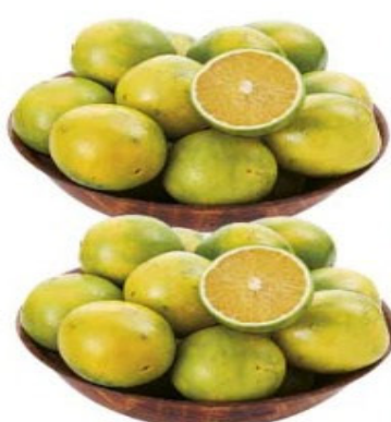
LARANJA PERA RIO Kg