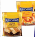
Mistura Bolo Fleischman 390g