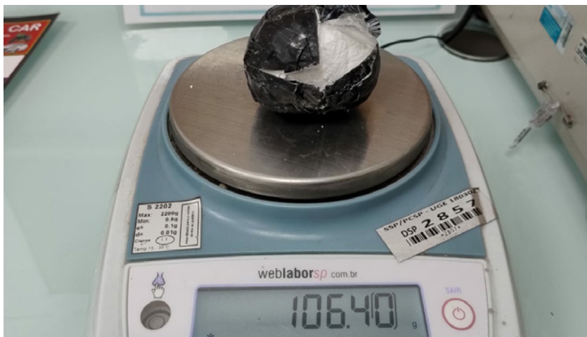
Porção de cocaína apreendida na penitenciária de Junqueirópolis