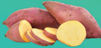
Batata Doce kg