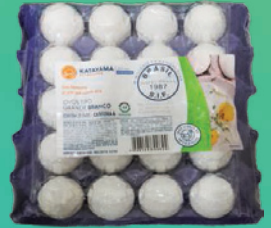
Ovos Katayama PVC Branco C/20 Grande