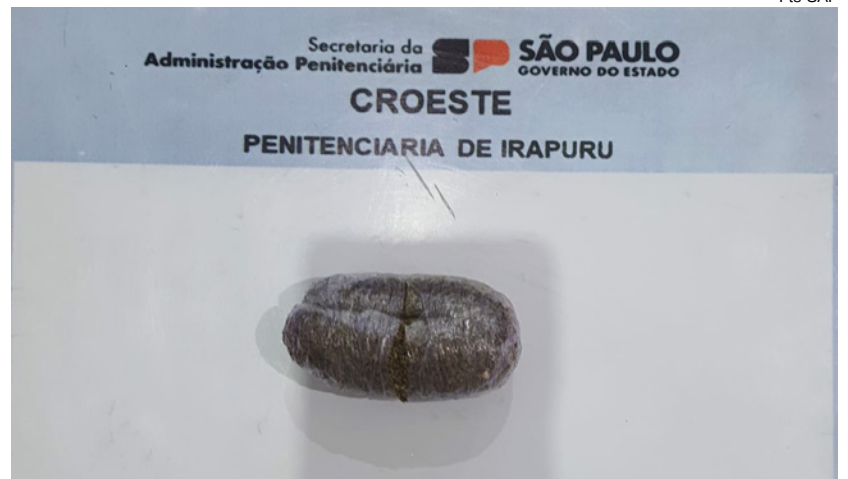
Porção de maconha apreendida na penitenciária de Irapurú