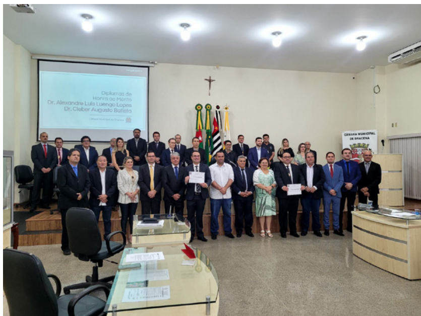
Presentes na sessão solene, segunda-feira, 13