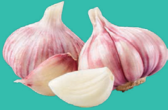
Alho Granel kg