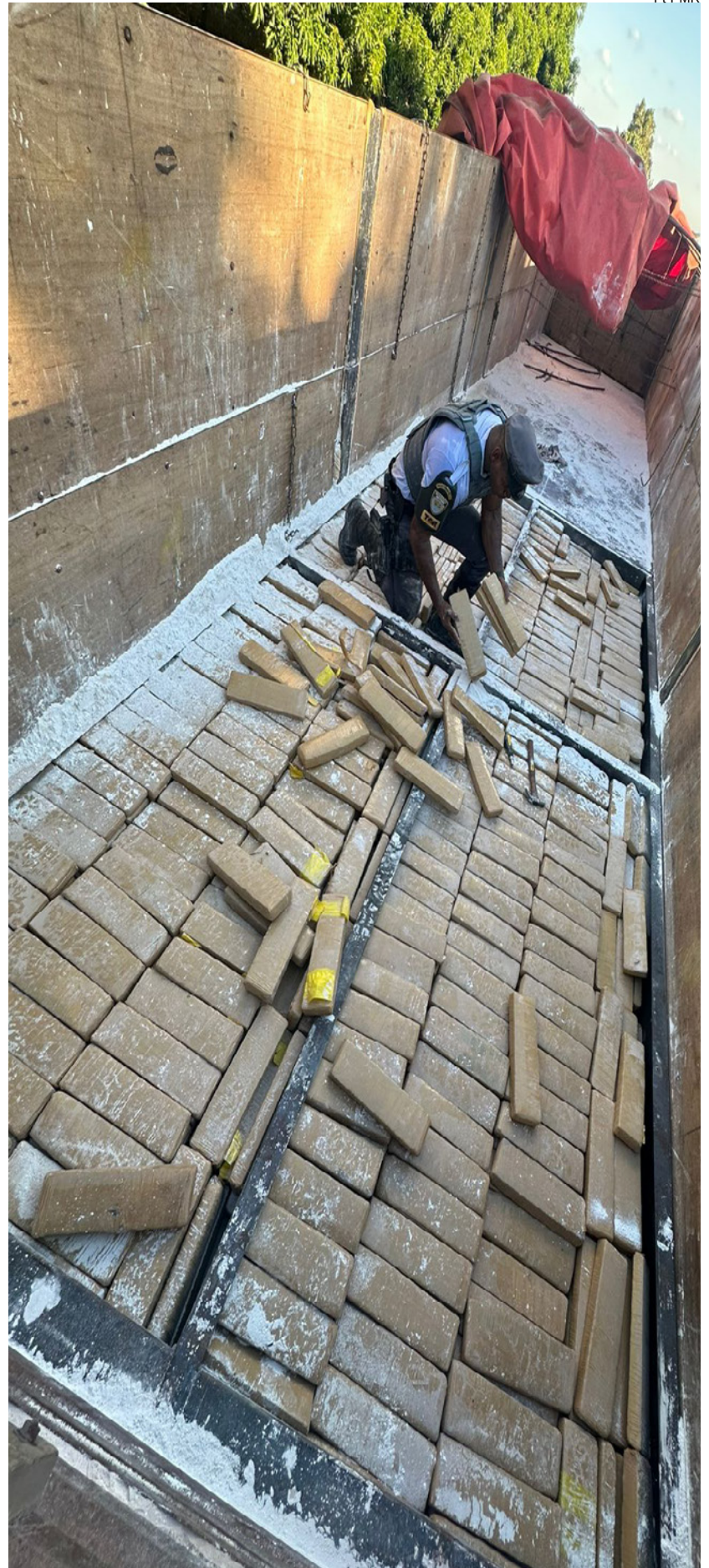
Carga da droga estava em fundo falso do semirreboque do caminhão

A ocorrência foi apresentada na Delegacia de Polícia Federal de Presidente Prudente, onde o delegado de plantão ratificou a voz de prisão em flagrante delito, apreendeu a droga e o caminhão. No total foram apreendidos 1.107,300 quilos (1 mil cento e sete quilos e trezentos gramas) da droga dividida em vários tabletes.