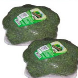
BRÓCOLIS NINJA 250g