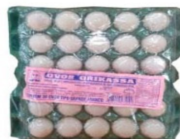
OVOS ORIKASSA GRANDE BRANCO C/30