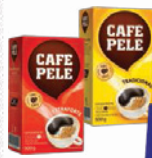
Café Pelé 500g