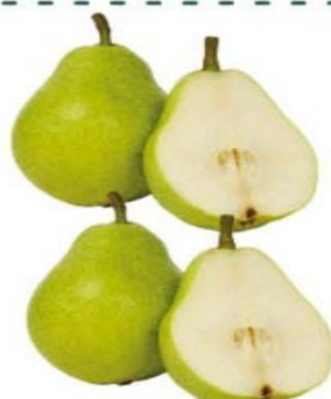
PERA IMPORTADA Kg