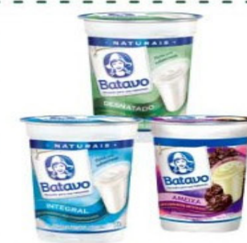
IOGURTE BATAVO 170g NATURAL SABORES