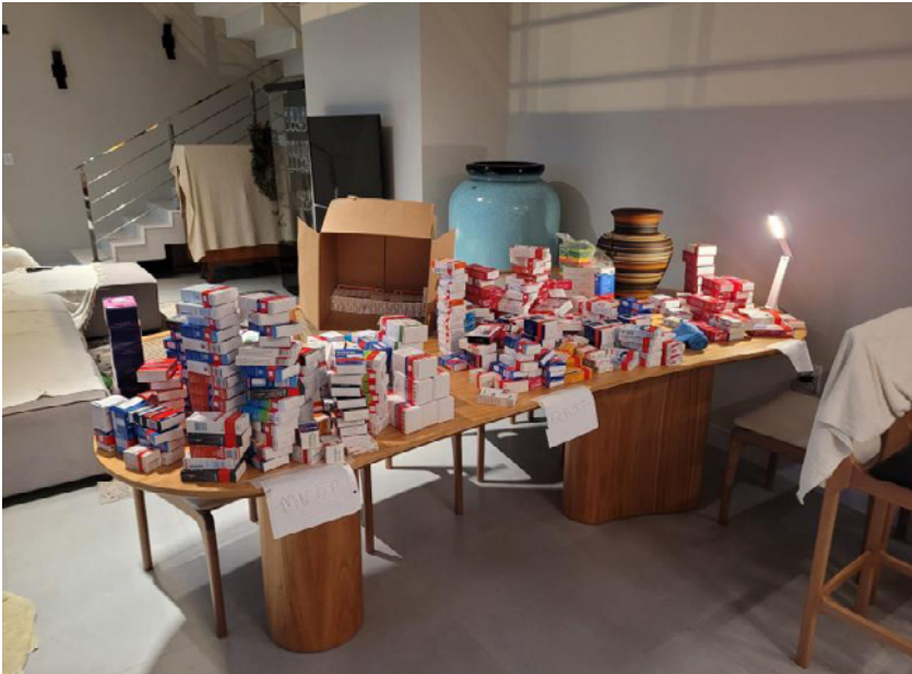
Casal havia recebido grande quantidade de medicamentos