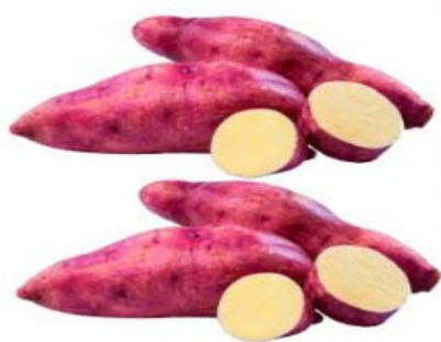
BATATA DOCE Kg