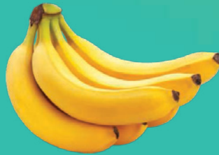
Banana Nanica kg