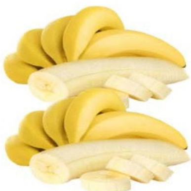
BANANA NANICA Kg

Frutas, verduras, legumes, carnes e ofertas fresquinhas pra você.