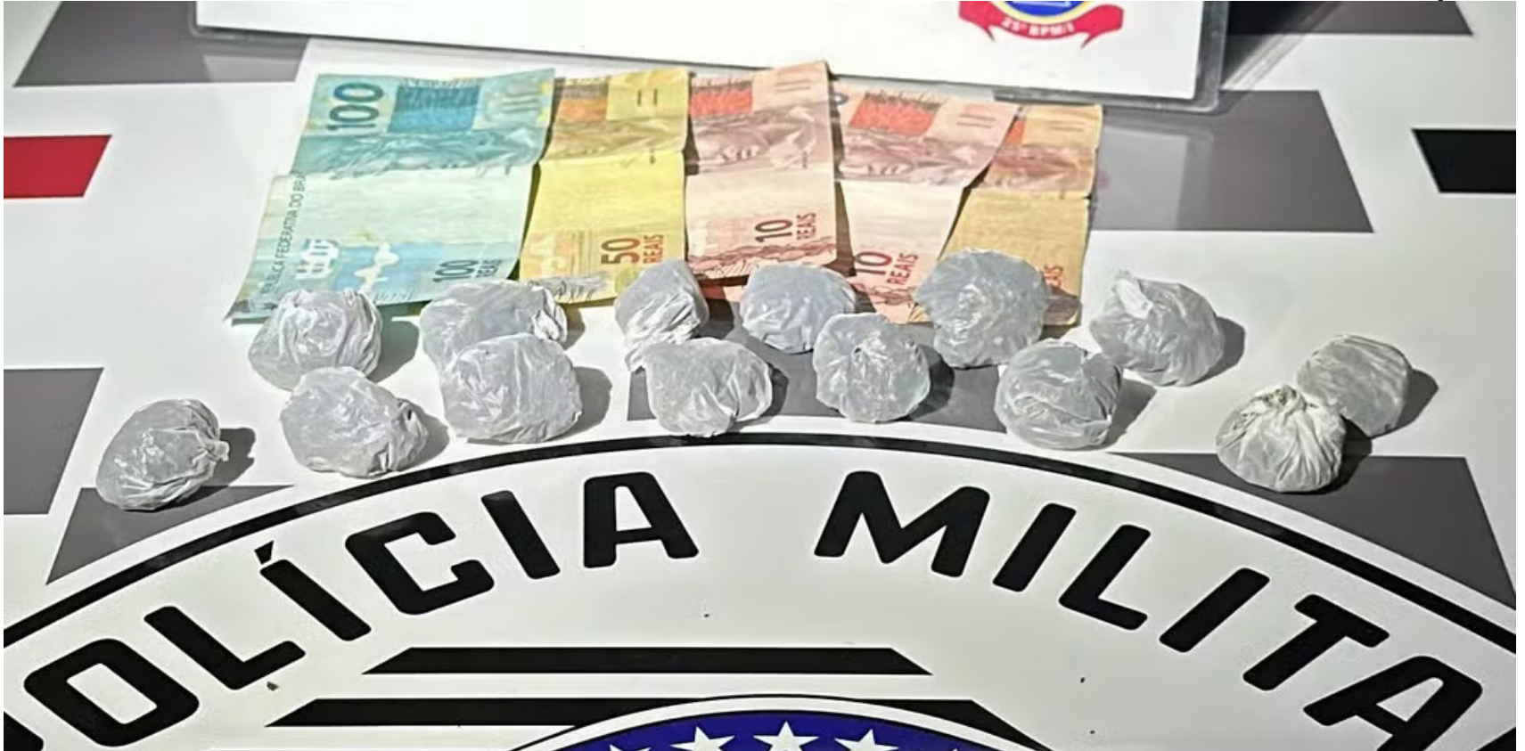
Porções de maconha e dinheiros apreendidas