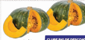
Abóbora Kabotia kg