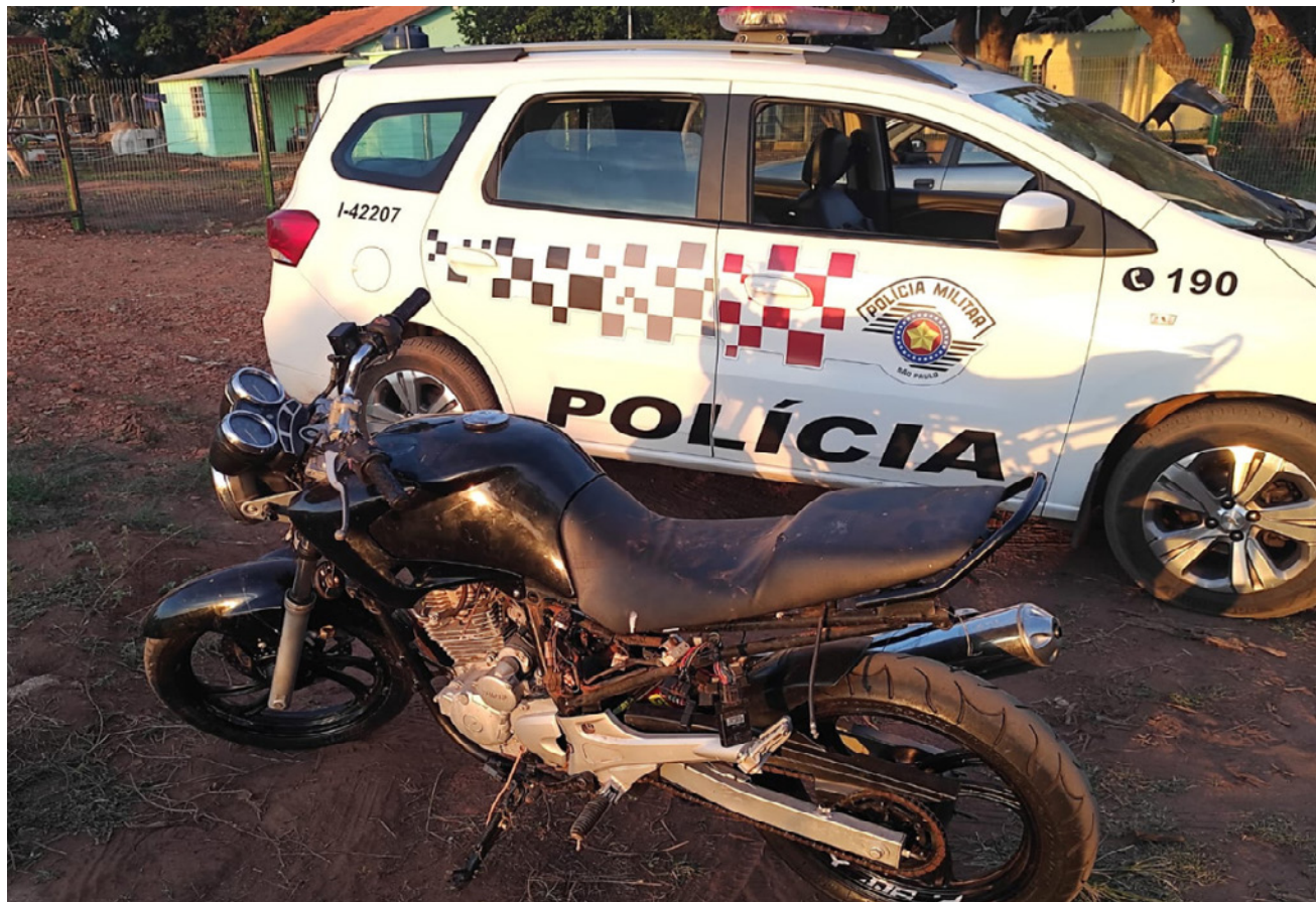
Motocicleta furtada foi encontrada em uma área de pastagem

A Polícia Militar (PM) recuperou sexta-feira (10), em Presidente Epitácio uma motocicleta que havia sido furtada no município no mês de março.