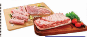
Costelinha ou Panceta Suína kg