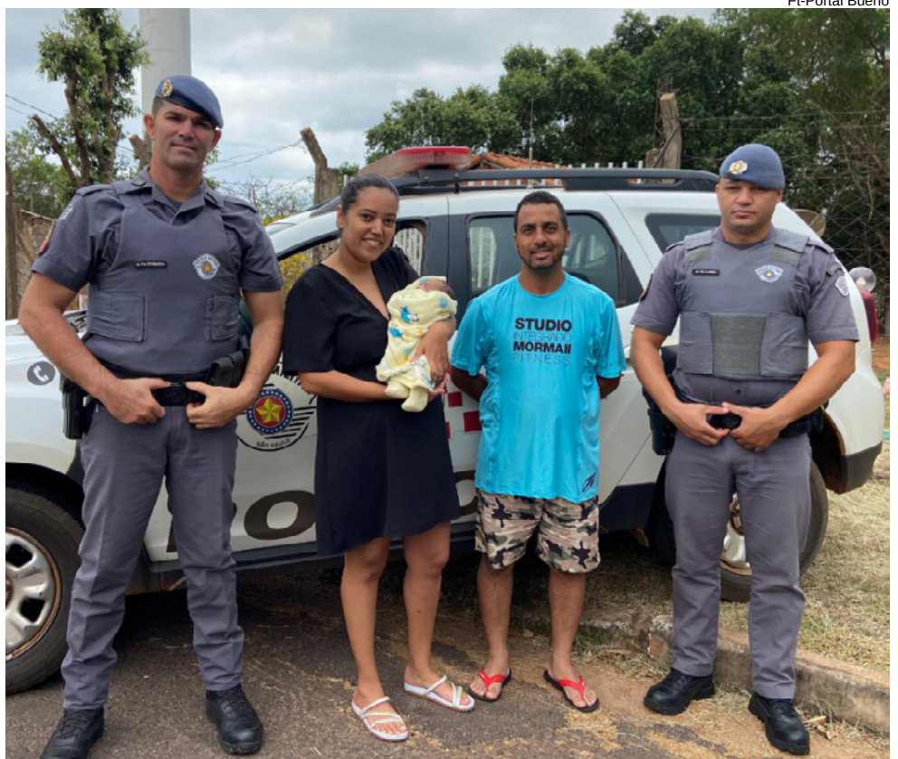
Policiais Militares ao lado dos pais do pequeno Miguel, socorrido na manhã de hoje

Após o procedimento, mãe e filho foram encaminhados ao Hospital de Presidente Epitácio, onde a criança permaneceu sob cuidados médicos e foi liberada.