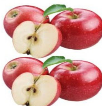
MAÇÃ FUJI Kg