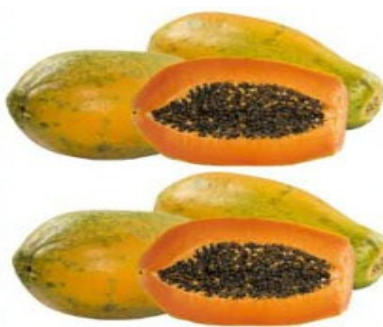
MAMÃO FORMOSA Kg