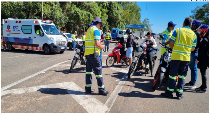
Motociclistas receberão orientações, higienização das viseiras e antenas corta pipa

Em Dracena ação será nesta quarta-feira (15), no km 644 (sentido oeste) da SP-294, das 8h às 12h