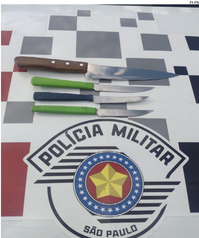
Facas usadas pelo homem nas ameaças contra a atendente de 51 anos