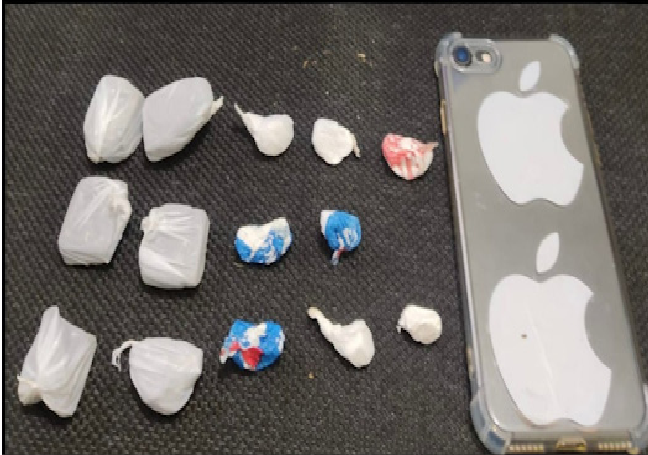
Porções de cocaína e maconha encontradas em posse do homem

Diante os fatos o homem foi conduzido ao Plantão Policial onde permaneceu à disposição da Justiça.