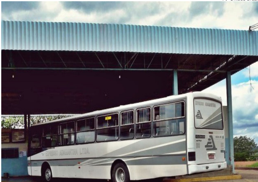
Ft- Ônibus Brasil

Artesp convida outras empresas para assumir serviços