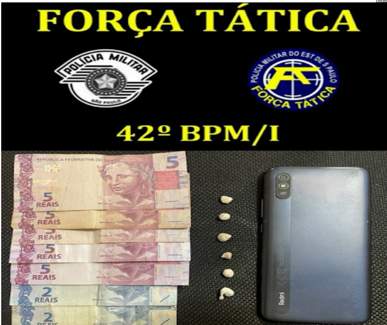
Porções de crack embaladas para venda encontradas com o menor