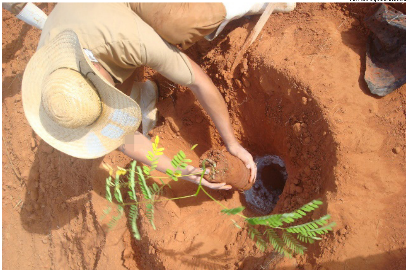
Viveiro de mudas na Penitenciária de Osvaldo Cruz

Atualmente, o viveiro do presídio mantém mudas que estão em processo de rustificação e crescimento, contemplando mais de 50 espécies diferentes, entre elas Oiti, Flamboyant, Aroeira Pimenteira, Gabiroba, Guapuruvu, Ipê, Moringa, Orapronóbis, Angico, Jacarandá Mimoso, Urucum, Pitanga, Goiaba, Manga, Pinha, Jaca, Abacate, Lichia Branca, Jambolão, Limão, Jatobá, Ingá, Amora, Pata de Vaca e Unha de Vaca. São aproximadamente 20 mil exemplares recebendo cuidados necessários para a manutenção das atividades.