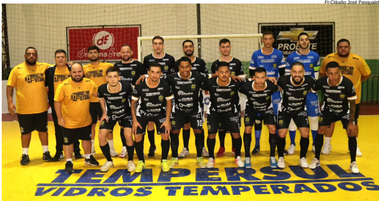
Time de Pindamonhangaba campeão da Copa da LPF 2024