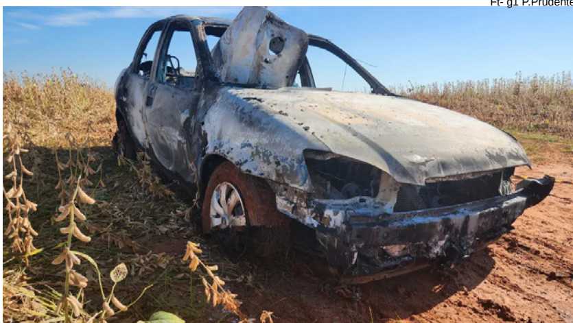
Corpo da professora foi encontrado carbonizado no porta-malas do veículo dia 15/5/23