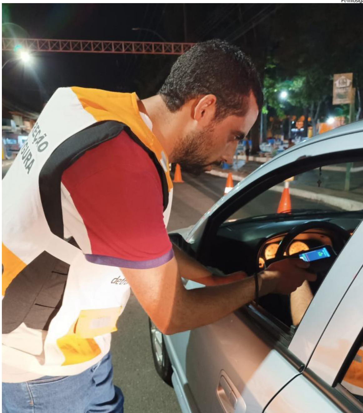
Operação Direção Segura Integrada (ODI) aumentou nas cidades da região de Presidente Prudente