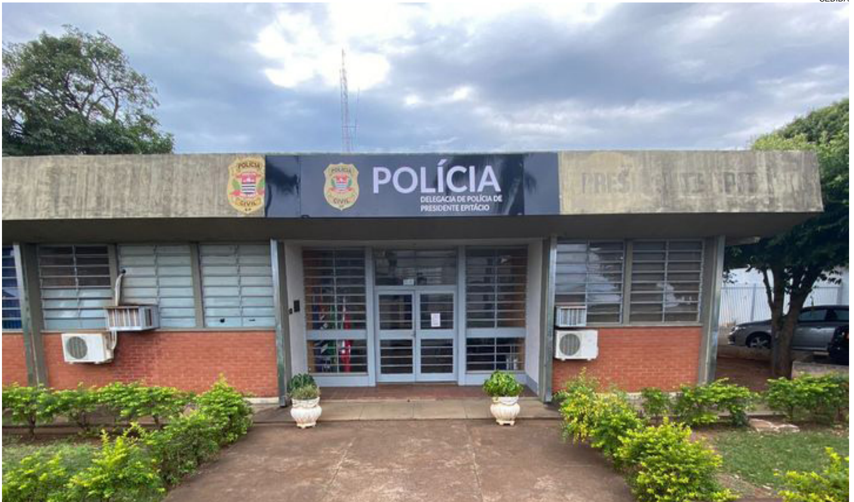
Três menores de 14 e 15 anos foram apreendidos pela Polícia Civil de Presidente Epitácio