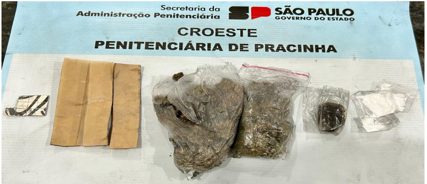
Cocaína, maconha e droga sintética apreendidas com a visitante na penitenciária de Pracinha