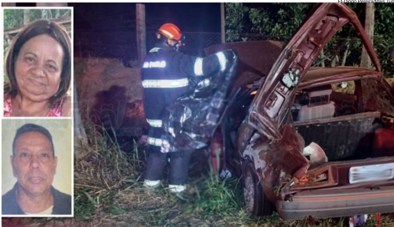
Vítimas eram moradoras de Bastos