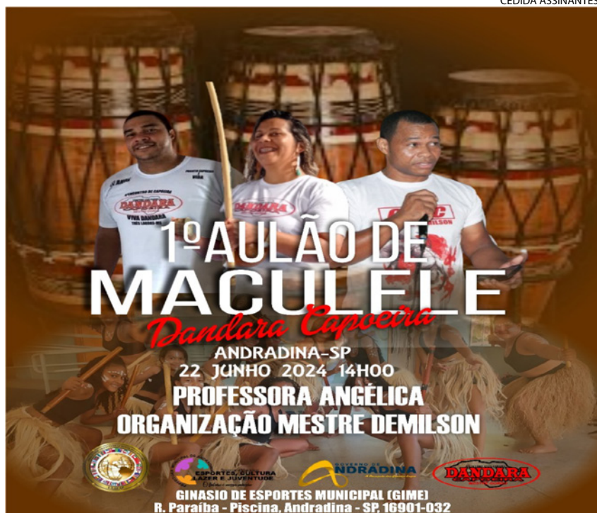
Primeiro Aulão de Maculele.