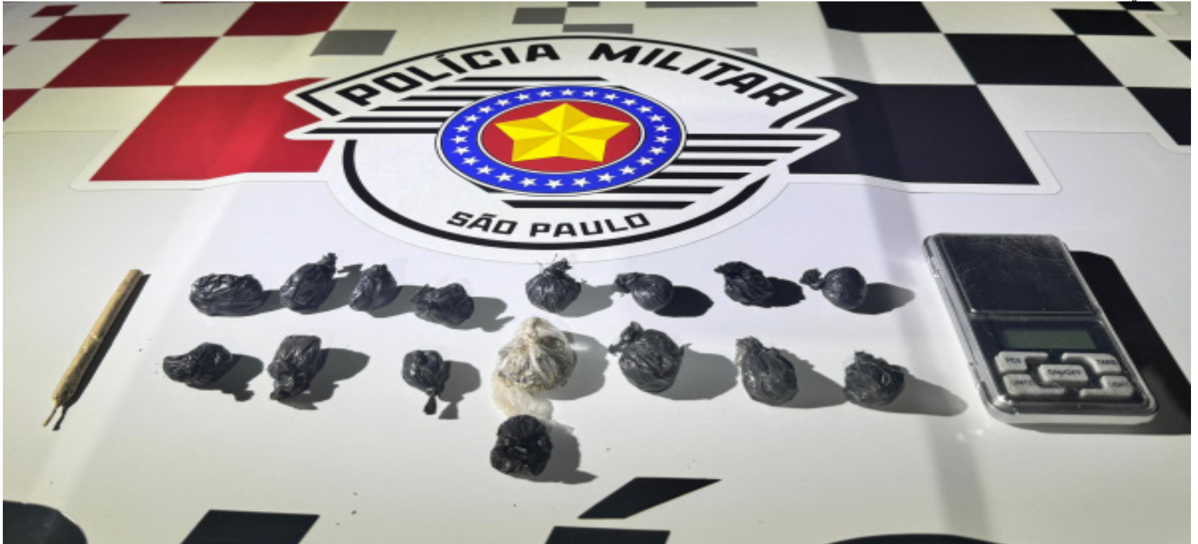
Drogas foram apreendidas durante patrulhamento da equipe de motos da PM