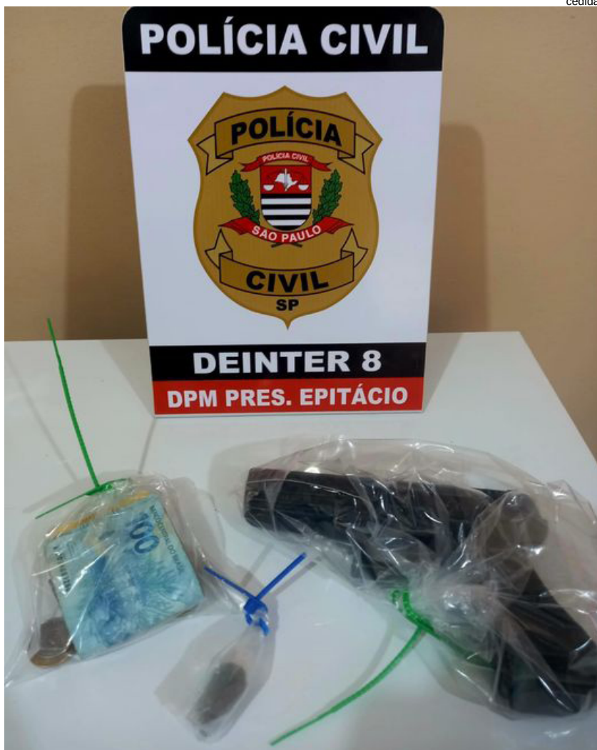
Porções de crack, dinheiro e simulacro de pistola apreendidos com o menor