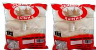
MANDIOCA CRUA RAINHA 1Kg EMBALADA CONGELADA PACOTE