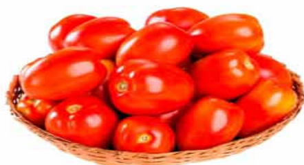
TOMATE SALADETE Kg

Frutas, verduras, legumes, carnes e ofertas fresquinhas pra você.