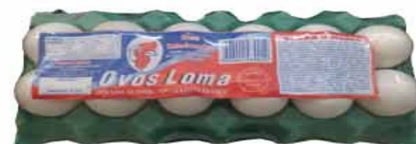
OVOS LOMA C/12 BRANCO GRANDE BDJ.