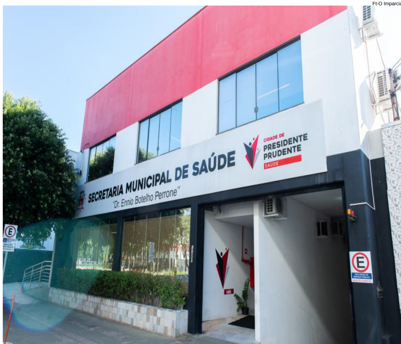
Secretaria Municipal de Saúde de Presidente Prudente investiga óbito suspeito de meningite

Menina estava matriculada no pré 1 da Escola Eluiza de Rezende Rodrigues