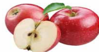
MAÇÃ FUJI Kg