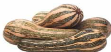
ABOBORA PAULISTA MADURA Kg