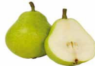
PERA IMPORTADA Kg