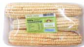
MILHO VERDE YUBA 550g EMBALADO BDJ.