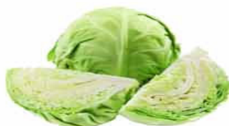
REPOLHO VERDE Kg