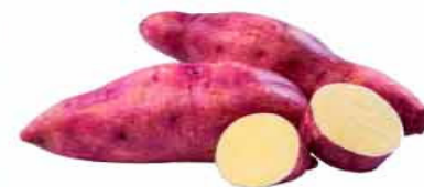
BATATA DOCE Kg