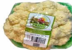
COUVE FLOR 200g PRIMO BANDEJA