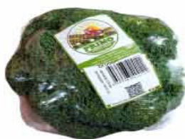
BRÓCOLIS NINJA 200g PRIMO BANDEJA