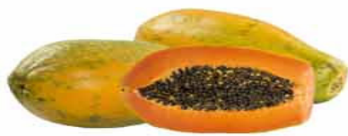
MAMÃO FORMOSA Kg