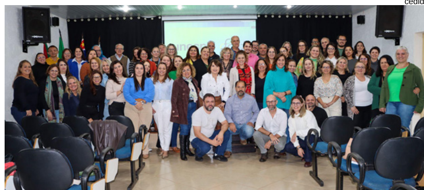
Dirigentes das Escolas e equipe FCAT reunidos