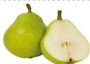
PERA IMPORTADA kg