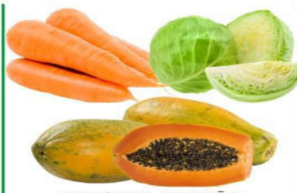
CENOURA / MAMÃO FORMOSA / REPOLHO VERDE Kg