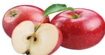
MaÇA FUJI Kg