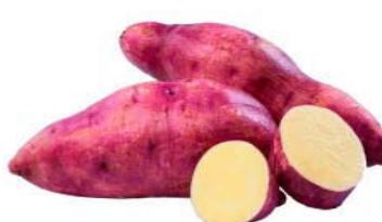
BATATA DOCE kg