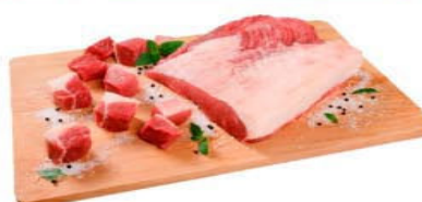
PONTA DE PEITO SEM OSSO Kg