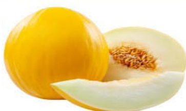
MELÃO AMARELO ESPANHOL kg