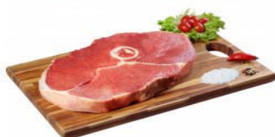
CORTE AMERICANO DA PALETA Kg