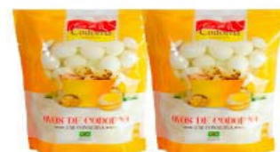
OVO CIA DA CODORNA 500g CIA CONSERVA PACOTE