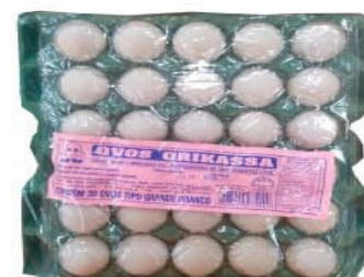
OVOS ORIKASSA C/30 BRANCO GRANDE BANDEJÃO