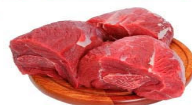
MÚSCULO TRASEIRO Kg