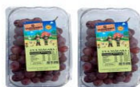
UVA NIAGARA 500g FAZENDINHA BANDEJA