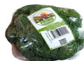
BRÓCOLIS NINJA BANDEJA 250g