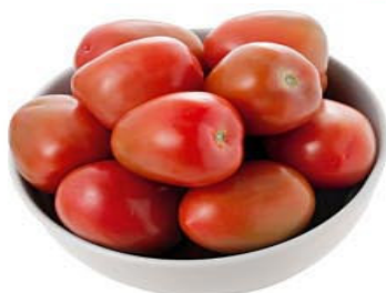
TOMATE SALADETE Kg