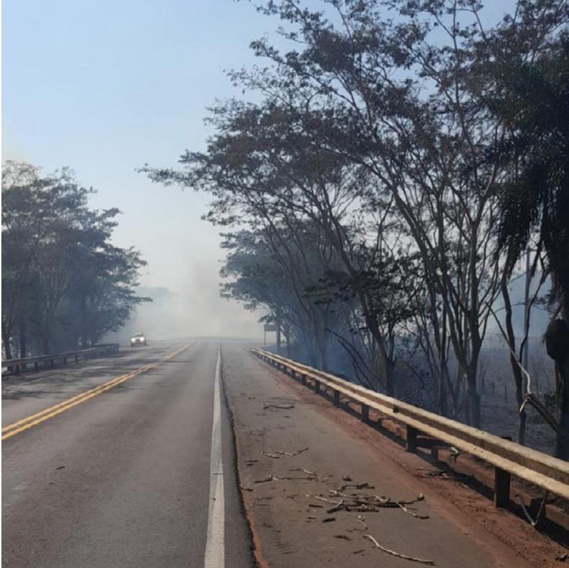
Exemplo de fumaça nas estradas foi registrado nesta quarta-feira, no distrito de Primavera, em Rosana