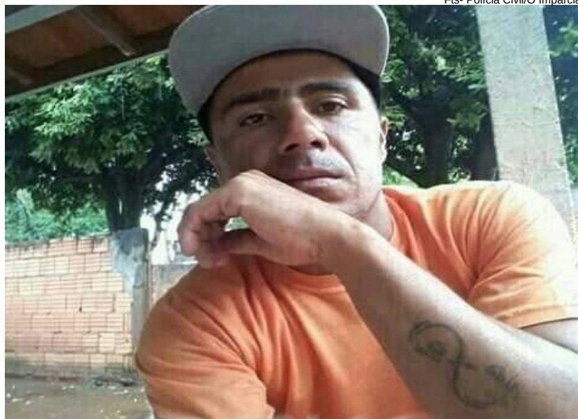
Delegacia de Polícia de Martinópolis investiga o crime