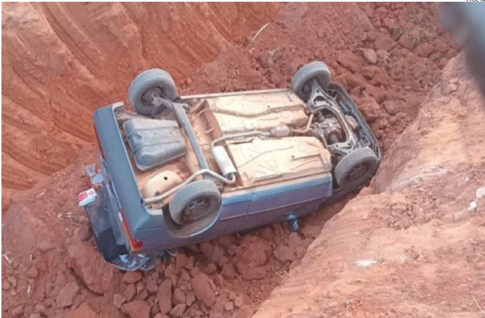
Automóvel Gol cai em vala aberta pela Prefeitura de Osvaldo Cruz