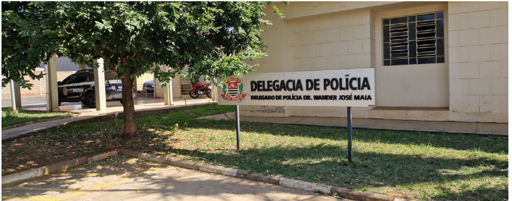
Polícia Civil de Rancharia fez representação na Justiça para bloqueio das atividades ilícitas