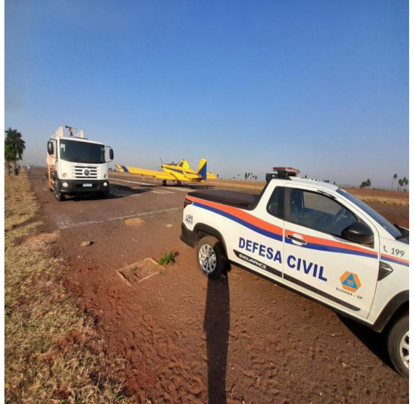
Alerta é para todos condutores de veículos que trafegam no oeste paulista

um caminhão pipa também atuou na ocorrência fornecendo água para o avião. “O local do incêndio era de difícil acesso e os ventos fortes dificultaram o combate e controle do fogo. Com a umidade relativa do ar atingindo níveis críticos e o aumento da temperatura, é essencial redobrar a atenção em áreas de vegetação seca.”, explicou.