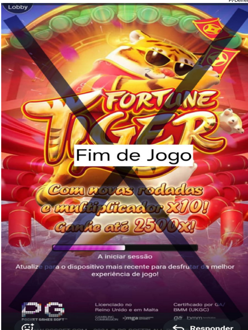
Foram bloqueados vários perfis e cessados os jogos de azar online