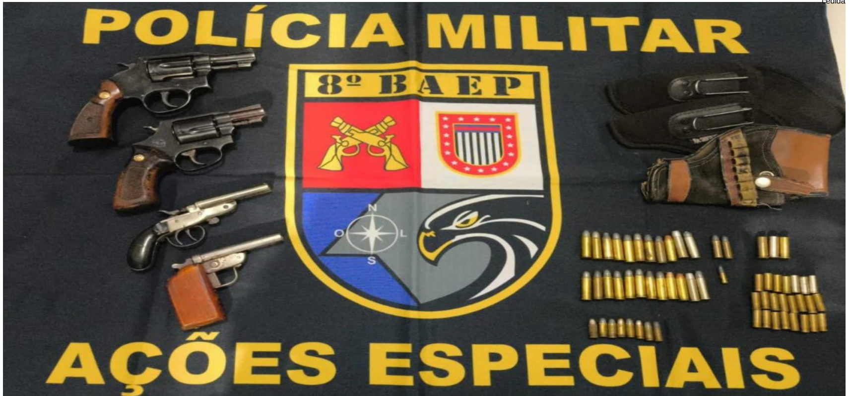
Na casa do homem foram encontradas mais armas