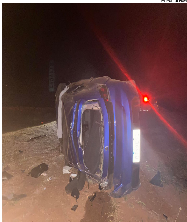
Motorista sofreu ferimentos e foi socorrido ao hospital de Teodoro Sampaio