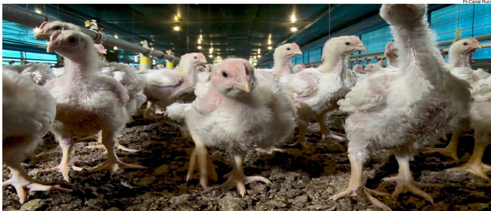
Estado de emergência vigorou no RS após confirmação da doença Newcastle em julho